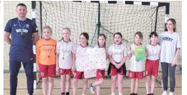
Dziewczyny z Kąkolewnicy miały tylko jedno rywalki, Ekipę Księżniczek z Czemiernik. Takie przeciwniczki pokonać nie jest łatwo, ale Kąkolewnica teraz będzie pisać swoją bajkę...