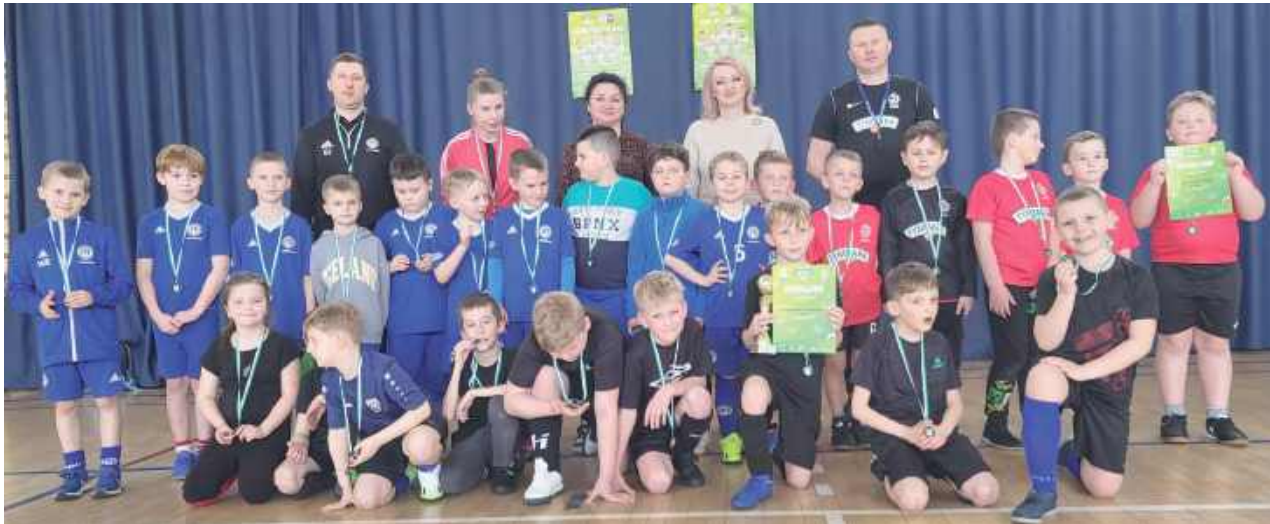
Awansować mogła tylko jedna drużyna ośmiolatek, udało się to ekipie z Komarówki Podlaskiej, ale na brawa zasłużyli też dzielne ekipy ze szkół w Czemiernikach i Kąkolewnicy

W sali oraz na Orliku przy Zespole Oświatowym w Kąkolewnicy rozegrano eliminacje powiatowe XXV Turnieju o Puchar Tymbarku w kat. U-8 chłopców, U-10 dziewcząt i Chłopców i U-12 dziewcząt. Wszyscy uczestnicy mają powody do dumy, najlepiej poszło piłkarzom gospodarzy.