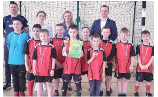
Dziesięciolatek z Kąkolewnicy okazali się najlepszymi w powiecie. Grom może być spokojny o swoją przyszłość

Wyniki: SP Białka - Viva Barca Czemierniki 2:2, SP Komarówka Podlaska - SP Kąkolewnica 1:2, SP Białka - SP Komarówka Podlaska 1:1, Viva Barca Czemierniki - SP Kąkolewnica 0:8, SP Białka - SP Kąkolewnica 2:4, Viva Barca Czemierniki - SP Komarówka Podlaska 1:2