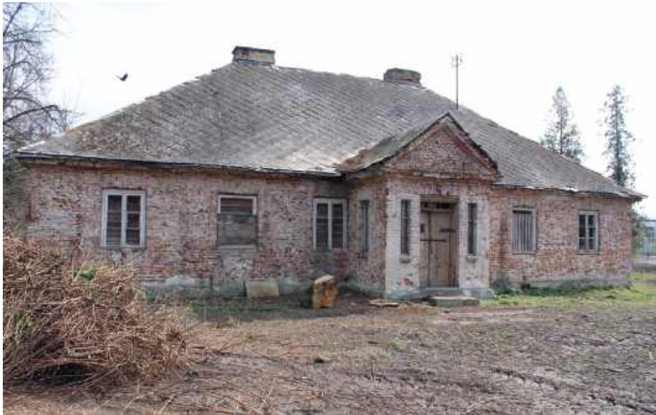
Swoją nową siedzibę w tym miejscu będzie miała Gminna Biblioteka Publiczna