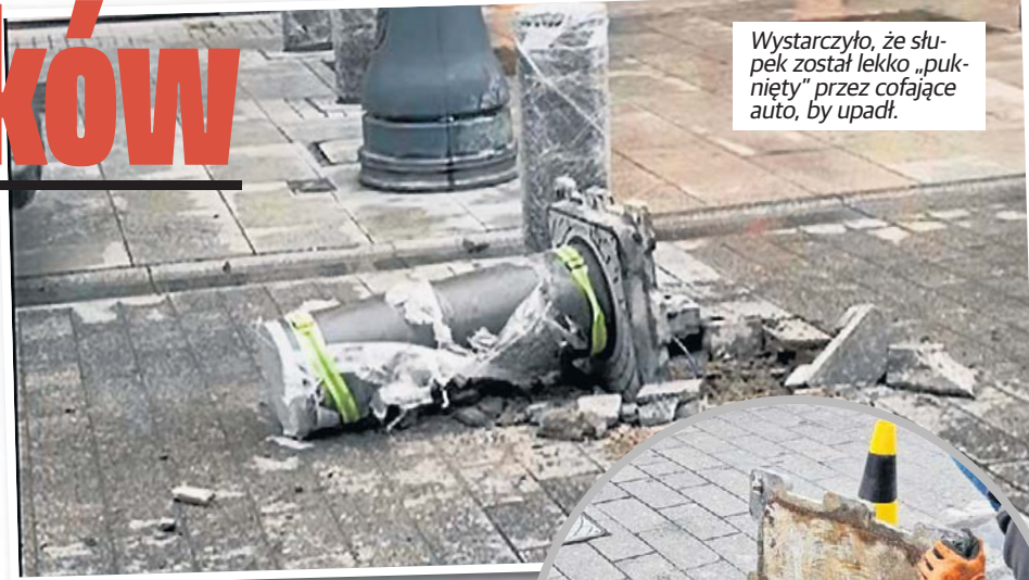
Wystarczyło, że słupek został lekko „puknięty” przez cofające auto, by upadł.

Jeden z 128 słupków, które za prawie 6 mln zł miały powstrzymać samochody przed wjazdem na Piotrkowską, padł. Wystarczyło, że auto dostawcze, cofając najechało na niego bokiem. I słupek... się przewrócił.