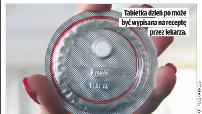
Tabletka dzień po może być wypisana na receptę przez lekarza.

kresie zdrowia reprodukcyjnego” w maju 2024 r. Jego celem było ułatwienie pacjentkom, zwłaszcza tym najmłodszym, dostępu do antykoncepcji awaryjnej. Receptę na tabletkę dzień po zgodnie z założeniami programu może im wystawić farmaceuta w aptece po przeprowadzeniu wywiadu i wyjaśnieniu jej zasad przyjmowania tabletki oraz wątpliwości jakie się z jej strony pojawiają. Tabletki nie jest refundowana, a pacjentka w zależności od apteki płaci za nią kilkadziesiąt złotych. Tabletkę może otrzymać nastolatka, która ma ukończone 15 lat.