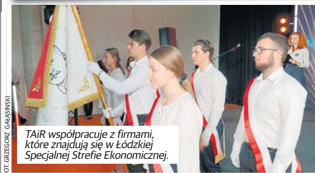
TAiR współpracuje z firmami, które znajdują się w Łódzkiej Specjalnej Strefie Ekonomicznej.