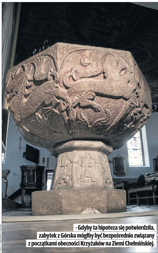
- Gdyby ta hipoteza się potwierdziła, zabytek z Górska mógłby być bezpośrednio związany z początkami obecności Krzyżaków na Ziemi Chełmińskiej.

Zagadką pozostaje jednak kamienna chrzcielnica - starsza od samego kościoła. Badacze datują ją zwykle na pierwszą połowę XIV wieku i wiążą