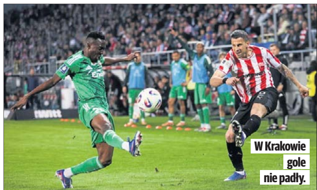
W Krakowie gole nie padły.