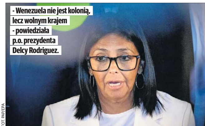
- Wenezuela nie jest kolonią, lecz wolnym krajem - powiedziała p.o. prezydenta Delcy Rodriguez.

„Izraelska armia traktuje ten incydent z wielką powagą, ponieważ szanuje wolność religii i kultu, jak również miejsca święte i symbole wszystkich religii i wspólnot” - przekazało biuro prasowe wojska.