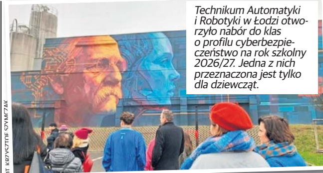
Technikum Automatyki i Robotyki w Łodzi otworzyło nabór do klas o profilu cyberbezpieczeństwa na rok szkolny 2026/27. Jedną z nich przeznaczoną jest tylko dla dziewcząt.

Szkoła oferuje na przyszły rok 2026/27 kształcenie w trzech klasach: