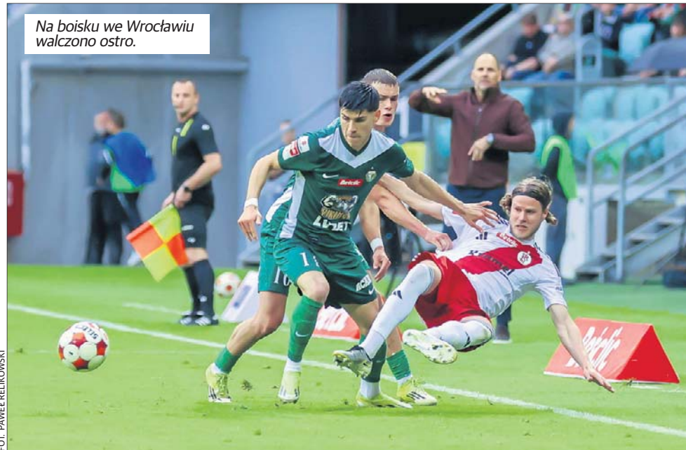
Na boisku we Wrocławiu walczone ostro.

ŁKS dominował na boisku, prezentując duży wachlarz ofensywnych poczynań. Dynamiczne ataki sprawiały, że defensywa gospodarzy popelnia-