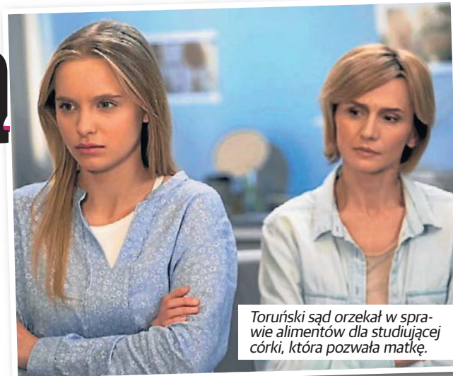
Toruński sąd orzekł w sprawie alimentów dla studiującej córki, która pozwała matkę.

Pozwana o alimenty matka, w sądzie sprzeciwiła się takim wyliczeniom i oszczerzeniom. Podkreślała, że córka przedstawia zawyżone koszty utrzymania, a do tego - zarabkuje już