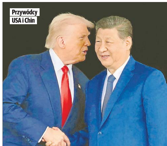
Przywódcy USA i Chin