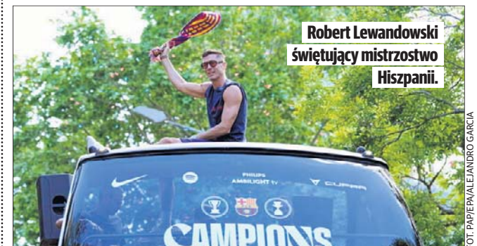
Robert Lewandowski świętujący mistrzostwo Hiszpanii.