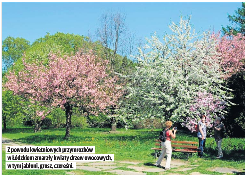
Z powodu kwietniowych przymrozków w Łódzkiem zmarły kwiaty drzew owocowych, w tym jabłoni, grusz, czereśni.

Uprawom szkodzi również pogłębiająca się susza glebowa. W kwietniu spadło w Łódzkiem nieco powyżej 16 litrów wody na m kw., niektóre stacje pomiarowe w okolicach Łodzi odnotowały oko-