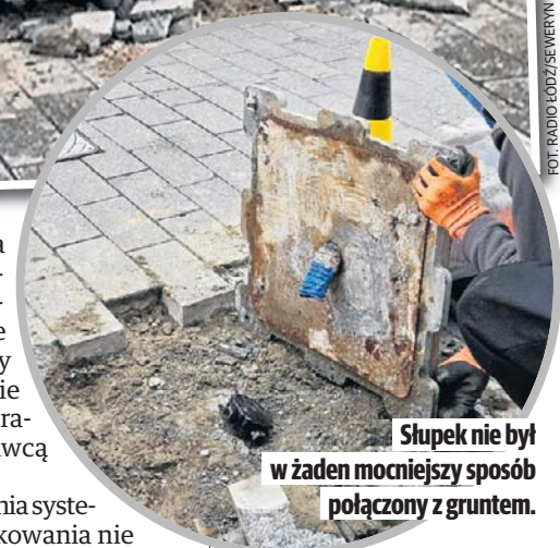
Słupek nie był w żaden mocniejszy sposób połączony z gruntem.

- To może potrwać dwa miesiące, ale niewykluczone, że potrwa do końca roku - tłumaczy Piotr Kurzawa. - Testowaliśmy