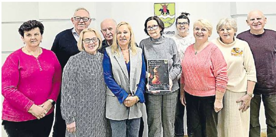
Rada Seniorów Gminy Siedlce funkcjonuje od lipca 2024 r.

Rada spotyka się regularnie, co dwa miesiące, a jej priorytetem jest stworzenie kompleksowej polityki senioralnej dla gminy. – Chcemy zdiagnozować potrzeby. Współpracujemy z wójtem,