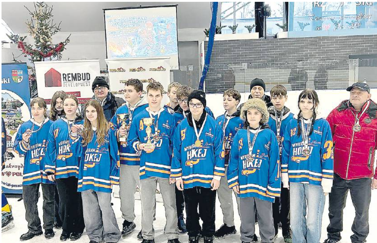
SWH Siedlce odniosła dwa cenne zwycięstwa.

Organizatorzy i zawodnicy serdecznie zapraszają wszystkich kibiców do hali, by wspólnie dopingować młodych sportowców i przeżywać emocje sportowe w sercu Siedlec. RED.ID