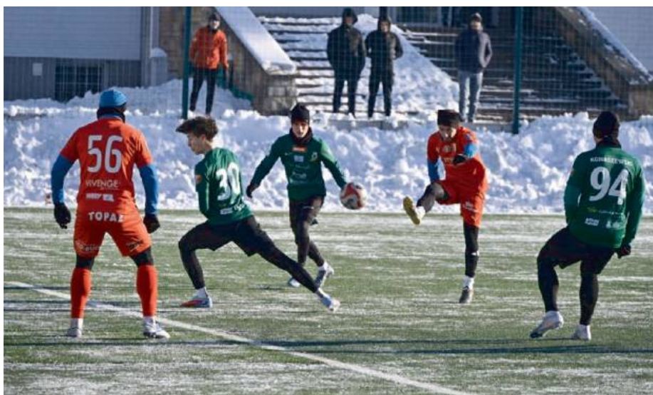
Obie drużyny są dobrze przygotowane kondycyjnie i taktycznie.

Na rozpoczęcie zimowych przygotowań do rundy wiosennej zespoły Pogoni Siedlce zanotowały zwycięstwa w meczach kontrolnych. Pierwszy zespół pokonał Podlasie Białą Podlaska 6:2, a rezerwy wygrały 1:0 ze SportsMate360, pokazując dobrą formę i przygotowanie do nadchodzących wyzwań.