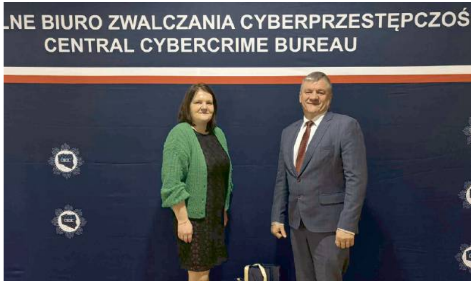
Szkoła zdobyła III miejsce w konkursie „Mazowiecki Lider Cyfryzacji 2025”

Rok szkolny w Zespole Szkół Publicznych w Suchożebrych był pełen sukcesów i wyjątkowych wydarzeń. Szkoła zdobyła III miejsce w konkursie „Mazowiecki Lider Cyfryzacji 2025”