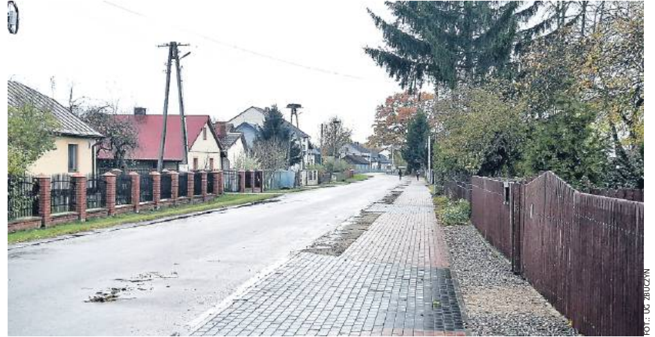
W ramach prace wybudowano i zmodernizowano chodnik w Grochówce.

W ramach projektu wykonano 22 zadania. Łączna długość