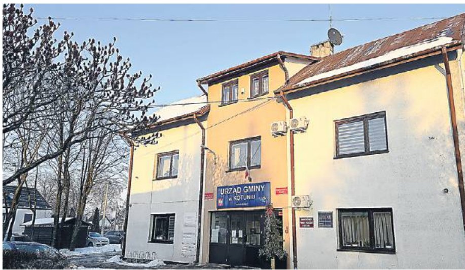
Urząd gminy musi jeszcze poczekać na nową siedzibę.

Powodem do radości włodarza z Kotunia jest też to, ile przy ustalaniu budżetu przeznaczono na inwestycje. To aż 30 mln zł. Najważniejszą z nich będzie remont 2 km drogi gminnej Kotuń-Polaki prowadzącym od drogi powiatowej do krajowej „dziewięćdziesiątkidwojki”. Dziś ten odcinek jest w naprawdę złym stanie. Prace obejmują przebudowę dwóch mostów, powstanie jezdni i 3-metrowego ciągu pieszo-rowerowego na całej długości łącznie z infrastrukturą pomoczną, czyli odwodnieniem i oznakowaniem. – Jeśli chodzi