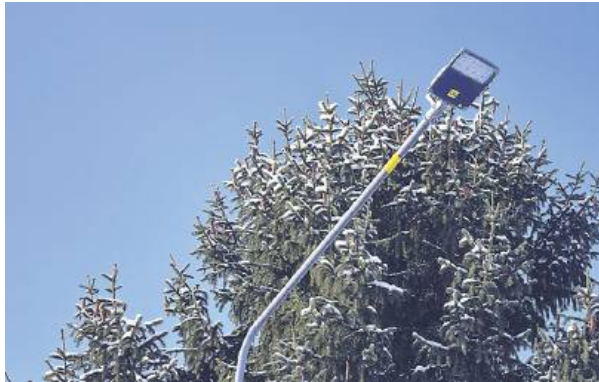
Oświetlenie uliczne w gminie jest teraz nowoczesne.

Włodarz gminy Przesmyki dodaje, że jego najbardziej zainteresował fakt, iż wymagania programu narzucały konieczność wdrażania takich rozwiązań, które zawierają możliwość zdalnego sterowania. Na którymś ze spotkań czy konferencji wójt usłyszał o oprogramowaniu Smart City do zarządzania oświetleniem ulicznym. Jak się dowiedział, aplikacje tego typu centralizują kontrolę nad infrastrukturą, umożliwiając zdalne sterowanie, harmonogramowanie (np. zależne od zachodu słońca, ruchu), monitorowanie zużycia energii i szybkie wykrywanie usterek. A to wszystko prowadzi do oszczędności i zwiększenia bezpieczeństwa.