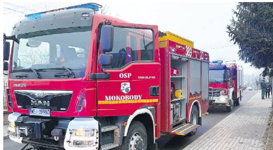
Działalność OSP w Mokobodach pozostaje jednym z filarów bezpieczeństwa lokalnej społeczności.