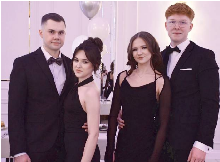
Studniówka „Samochodówki” była nie tylko udaną zabawą, ale także ważnym etapem nowej drogi.

Podczas wieczoru nie zabrakło również wzruszających wystąpień. Głos zabrali uczniowie młodszych klas, którzy dziękowali maturzystom za pokazanie drogi, wsparcie i przykład, jaki dawali przez lata nauki. W swoich słowach życzyli starszym koleżankom i kolegom udanej zabawy, niezapomnianych chwil oraz powodzenia na zbliżających się egzaminach.