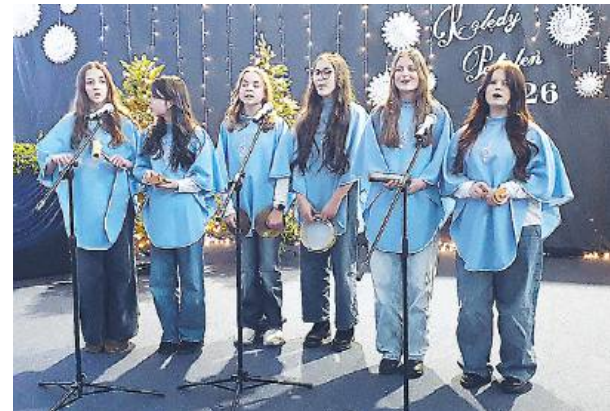
KO W koncercie wzięły udział m.in. uczniowie szkół podstawowych.

Koncert udowodnił, że kolędowanie nie zna granic wieków – łączy społeczność i wzmacnia tradycję.