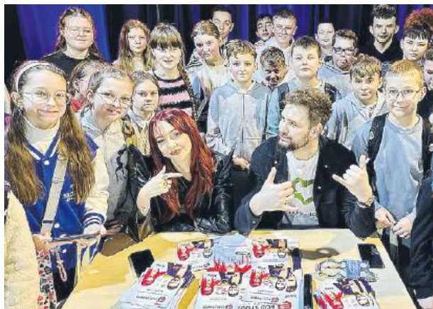
Po spotkaniu uczniowie wszystkich placówek mogą przystąpić do programu eko-PROFIT – REcycling to się opłaca!

W roku 2026 odbędzie się łącznie 6 eventów ekologiczno-edukacyjnych w wielu regionach Polski. Jest to doskonały sposób, aby zwrócić uwagę młodego pokolenia na problematykę ochrony środowiska, zwłaszcza w kontekście zużycia sprzętu elektrycznego i elektronicznego. Podczas każdego wydarzenia odbywa się lekcja