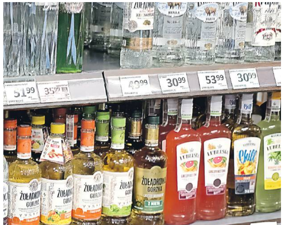
STRONA 2 Autor petycji domaga się ograniczeń w sprzedaży alkoholu

Co ważne, według autora petycji, zakaz powinien być niezależny od chwili złożenia zamówienia i jego formy (np. telefonicznie lub przez internet). A każde jego naruszenie karać sankcjami przewidzianymi w Ustawie o wychowaniu w trzeźwości i przeciwdziałaniu alkoholizmowi, łącznie z cofnięciem zezwolenia w przypadkach ustawowo określonych.