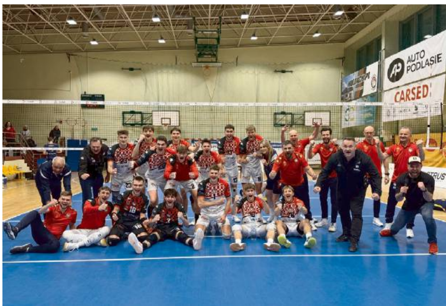
Po pięciosetowej walce KPS Siedlce pokonał Stal Nysa 3:2 (20:25, 32:30, 25:27, 25:19, 15:11).

Pierwsza partia rozpoczęła się od wyrównanej gry. Do stanu 9:9 żądna z drużyny nie była w stanie przejąć inicjatywy.