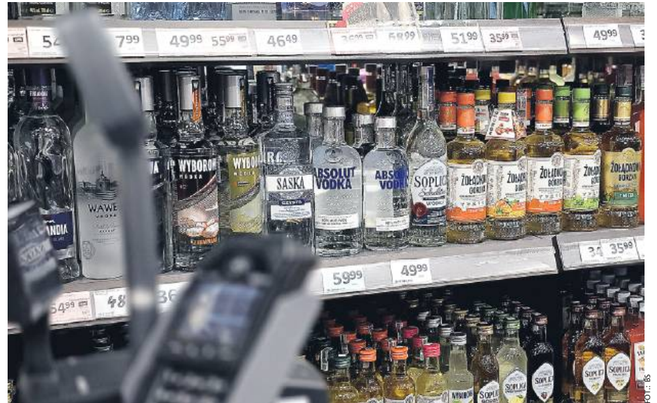
Co Siedlczanie powiedzą na proponowane zmiany?

Kolejne zmiany powinny, według autora petycji, objąć minimalną odległość punktów sprzedaży napojów wysokokawowych od tzw. obiektów chronionych. Kategoria ta obejmuje: publiczne i niepubliczne: szkoły i inne placówki oświatowe (z wyłączeniem szkół wyższych), żłobki, przedszkola, placówki