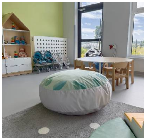
To miejsce powstało przede wszystkim z myślą o najmłodszych.

– „Wodmiś” to przestrzeń, w której dzieci mogą rosnąć, uczyć się i bawić w bezpiecznych warunkach – dodaje zastępca wójta Mar-