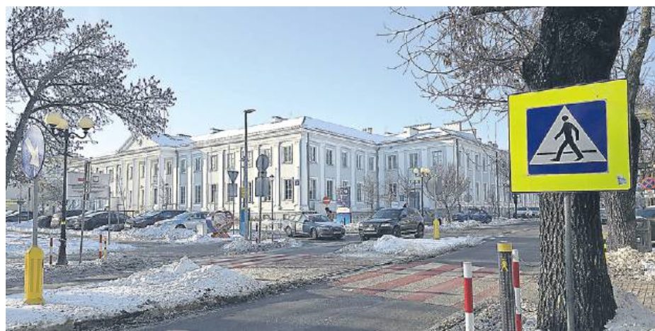
Miasto zyska m.in. Safe Pass, jak ten na ul. Piłsudskiego.