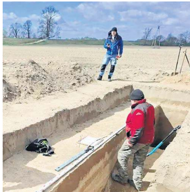
Archeologom z Uniwersytetu Mikołaja Kopernika udało się jak dotąd zlokalizować fragment umocnień otaczających pierwszą krzyżacką osadę na ziemi chełmińskiej