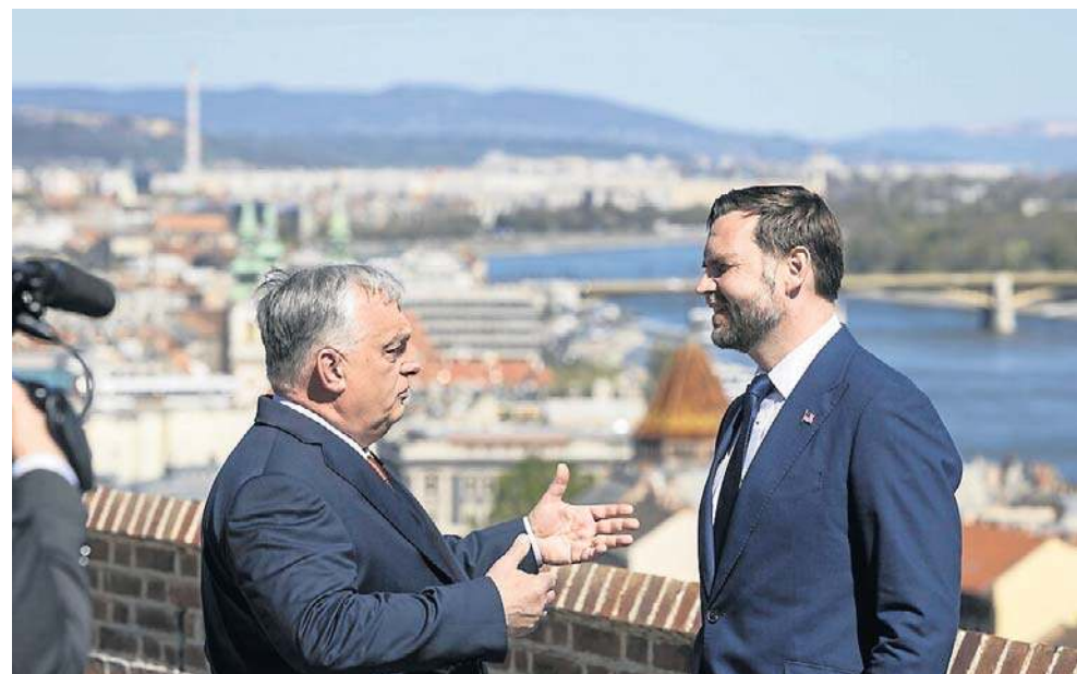
Premier Węgier Viktor Orbán wita wiceprezydenta USA J.D. Vance'a przed swoim biurem, byłym klasztorem karmelitów w Budapeszcie

- Myślę, że premier Orbán jest najbardziej wpływowym przywódcą Europy w kwestiach bezpieczeństwa energetycznego i niezależności. To