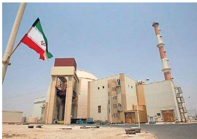
Buszehr to kluczowa irańska elektrownia jądrowa. Została uszkodzona po ataku rakietowym

Położenie na wybrzeżu Zatoki Perskiej oznacza, że zanieczyszczenia mogłyby przedostać się do wody morskiej, zwiększając ryzyko oddziaływania na ekosystemy morskie, a co ważniejsze, na zakłady odsalania wody, od których wiele państw Zatoki Perskiej jest zależnych w zakresie zaopatrzenia w wodę pitną.