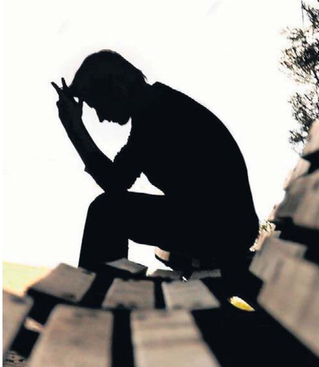
Rada Kobiet często spotyka się z nieleczoną depresją wśród rolników i członków ich rodzin

Zdaniem Rady konieczne jest stworzenie specjalnego programu wsparcia psychologicznego dla rolników, polegającego przede wszystkim na ułatwionym dostępie do specjalistów w wiejskich ośrodkach zdrowia.