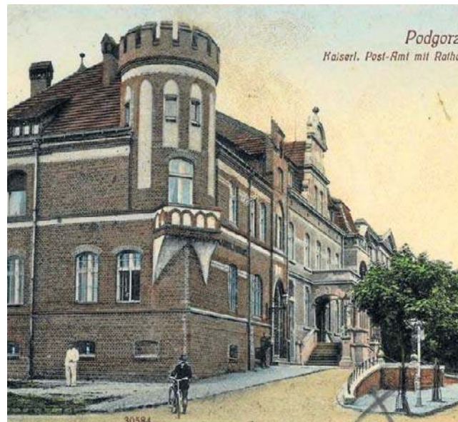
Podgórz zdecydował o budowie nowego ratusza