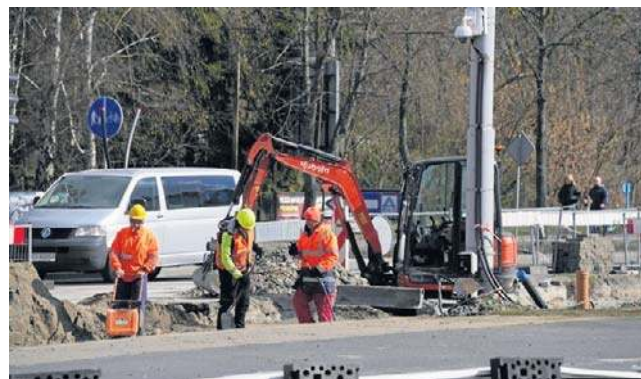
Nocne prace przy stawianiu słupów sieci trakcyjnej potrwają do 10 kwietnia

Na ul. Kościuszki modernizowany jest odcinek torowiska i sieci trakcyjnej od wysokości