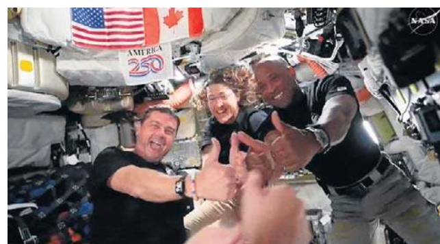
Astronauci misji kosmicznej Artemis II

Podczas przelotu nad niewidoczną stroną Srebrnego Globu, w trakcie którego łączność z NASA była całkowicie niemożliwa, załoga była świadkiem zjawiska wschodu i zachodu Ziemi.