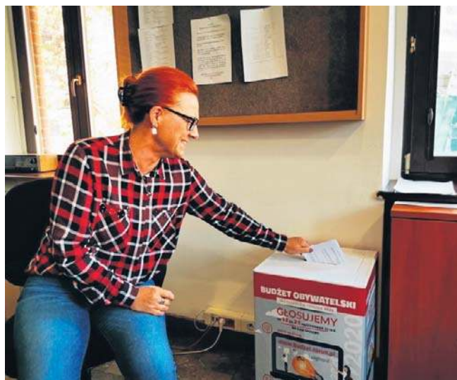
W Galeria Copernicus odbędzie się spotkanie poświęcone Budżetowi Obywatelskiemu na 2027 rok