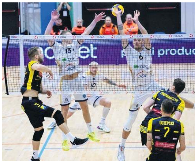
W rundzie zasadniczej CUK Anioły dwa razy pokonały Avię. U siebie 3:0, a na wyjeździe 3:1. Jak będzie teraz?

Pozostałe pary 1/4 finału: GKS Katowice - KPS Siedlce 3:0 (25:23, 25:16, 25:23), Stal Nysa - BBT5 Bielsko-Biała (godz. 18), Mickiewicz Kłuczbork - MKS Będzin (godz. 18). ©©