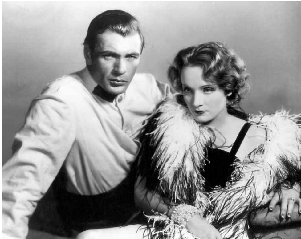
Nie wiadomo, czy William Harrison Hays widział w kinie film „Maroko” von Sternberga, choć zapewne doskonale znał jego treść

Osoba Chrystusa musiała być w filmie traktowana z szacunkiem i nie mogła być tema-