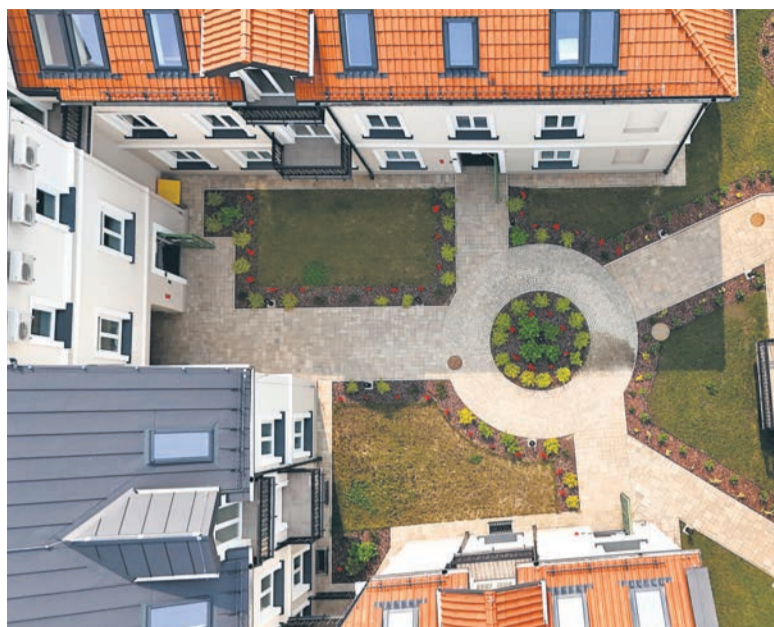
Dziedziniec rezydencji przy ulicy Kwiatka 55

Mieszkania odpowiadają na potrzeby najbardziej wymagających klientów zarówno pod względem metrażowym, jak i układu wnętrza. Stylistyka holu wejściowego, klatek schodowych i półpięter nawiązuje do elegancji przedwojennych kamienic. Tu również zastosowano wysokiej jakości materiały, m.in. postarzane lustra i indywidualnie projektowaną stolarce drzwiową.