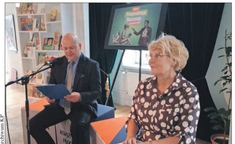
Prezydent Andrzej Nowakowski czytał w Książnicy Płockiej ulubioną lekturę

2 czerwca o 11.00 Książnica Płocka i Biblioteka dla dzieci zapraszają na Stary Rynek na wspólne czytanie „Rzepki” Juliana Tuwima w ramach XXV Ogólnopolskiego Tygodnia Czytania Dzieciom. Za oryginalną rozgrzewkę odpowiada aktor Przemysław Jarzyński z Teatru Form Wielu. Na koniec - tradycyjna pamiątkowa fotografia CzyTa Fotka. (l.)