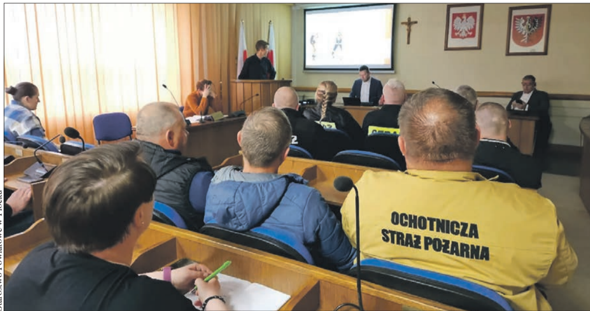
Strażacy szkolili się z programu „ORLEN na straży”