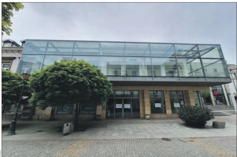
Budynek Galerii Tumskiej, czyli dawnego Hortexu