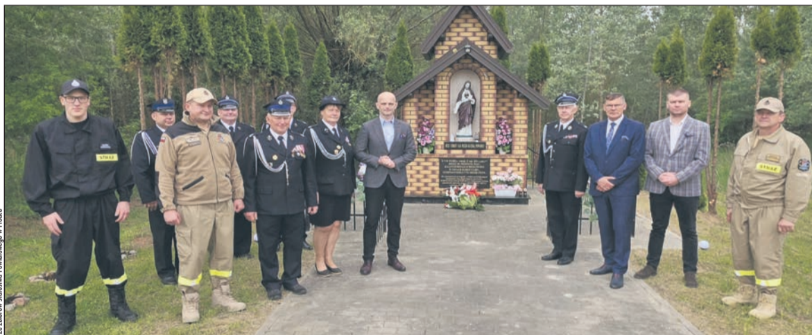
Przedstawiciele służb i samorządu Powiatu Płockiego przy kapliczce upamiętniającej przerwanie wału w Świnarach

23 maja minęło 16 lat od przerwania wału przeciwpowodziowego w Świnarach, które w 2010 roku doprowadziło do zalania 14 miejscowości w gminach Gąbin i Słubice. W wyniku tego zdarzenia około 4 tys. mieszkańców straciło swoje domy i dobytek, a część z nich musiała opuścić swoje miejscowości.