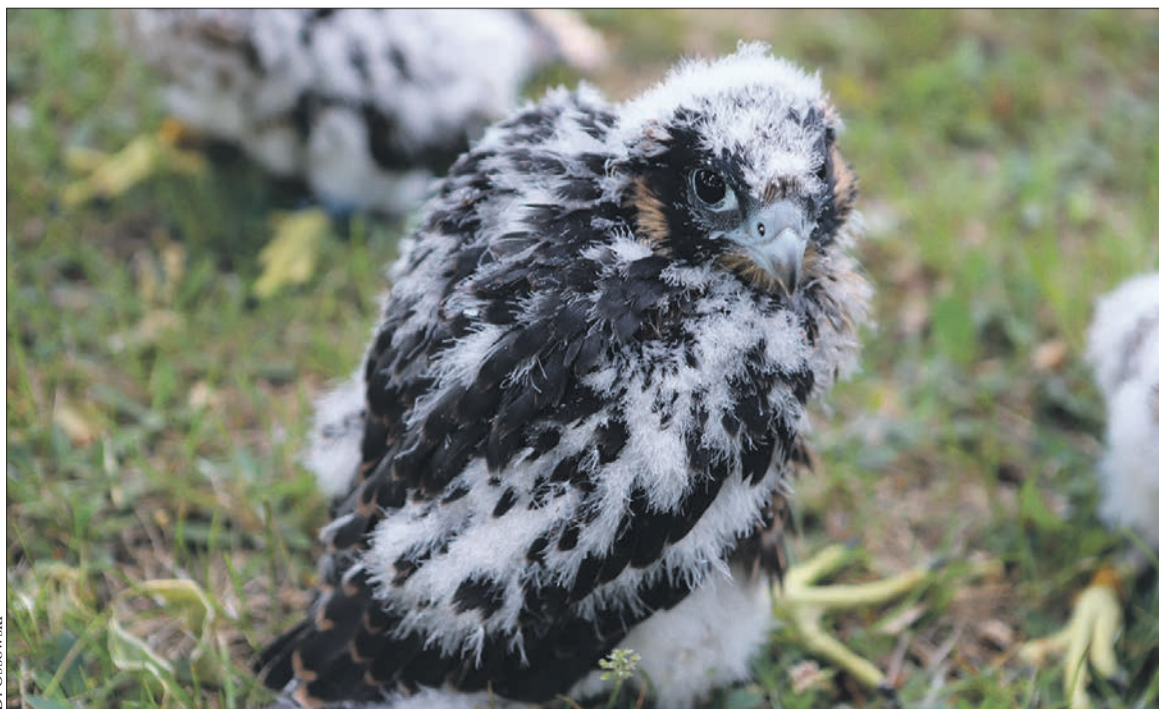
Sesja zdjęciowa pisklaków sokoła wędrownego