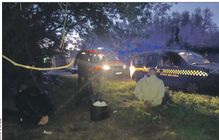
Nocna interwencja municypalnych

Strażnicy z patrolu chcieli sprawdzić stan kobiety. Wtedy z pobliskich zarośli wybiegło dwóch mężczyzn trzymających butelki z piwem. Używając wulgarnego słownictwa, zaczęli krzyczeć do strażników, aby odjechali i nie wtrącali się w ich spr-