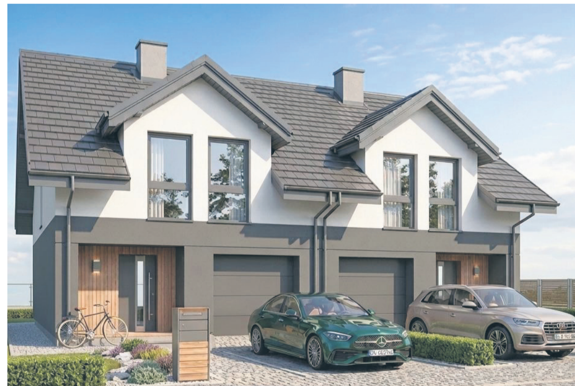
Interesującą propozycją INVEST BUDU jest segment przy ul. Rucianej 13 w Nowym Gulczewie