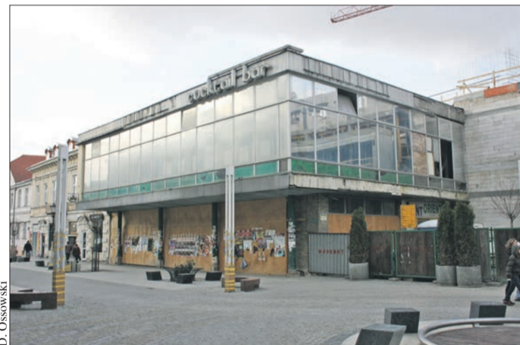
Tak wyglądał budynek Hortexu w roku 2008