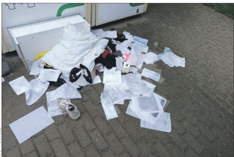
SM w Płocku

spektakl „O smoku znad Wisły” - Teatr Form Wielu.