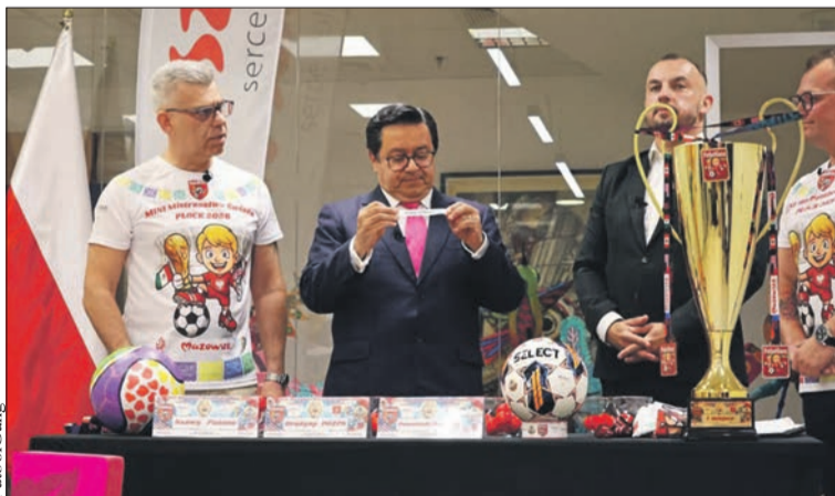
Ambasador Meksyku w obecności przedstawicieli Stowarzyszenia FutbolGang przeprowadza losowanie drużyn Mini Mistrzostw Świata