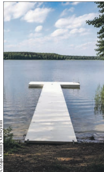
Nad Jeziorem Przytomne powstanie pływający pomost