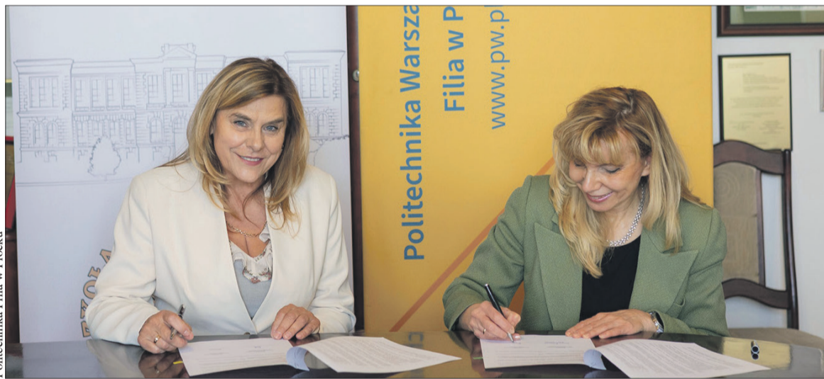
Podpisanie umowy między szkołą a uczelnią

To także szansa na promocję nauki w lokalnym środowisku. Uczelnia chce być bliżej młodych ludzi i pokazywać, że nowoczesna wiedza nie jest odległym światem dostępnym tylko dla wybranych. A.K