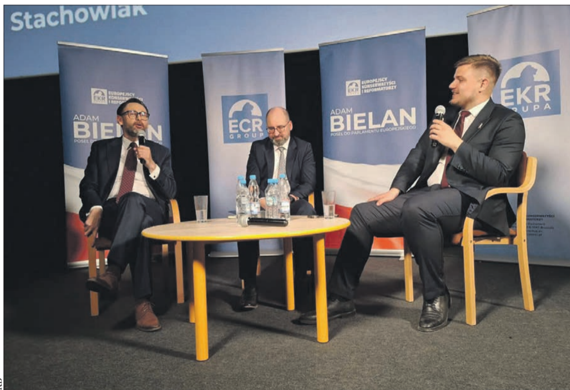
Spotkanie z europośłami Adamem Bielaniem i Danielem Obajtkiem w Płocku

wę jako zadanie społeczne, ponieważ ta firma tu funkcjonuje i mimo wszystko mieszkańcom utrudnia życia. W tym roku była podwyżka Czy mieszkańcy są zadowoleni, czy prezydent zareagował? Za moich czasów ORLEN został tytularnym sponsorem stadionu. Uważałem, że robię to dla Płocczan, a nie dla jednego czy drugiego prezydenta.