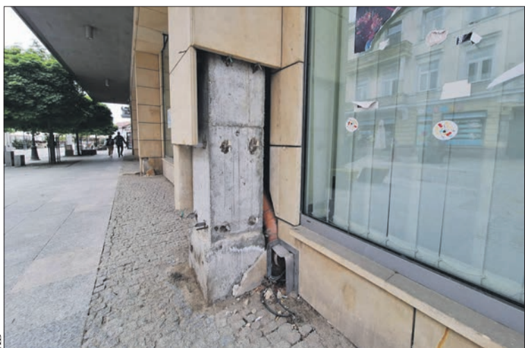
Czas robi swoje...