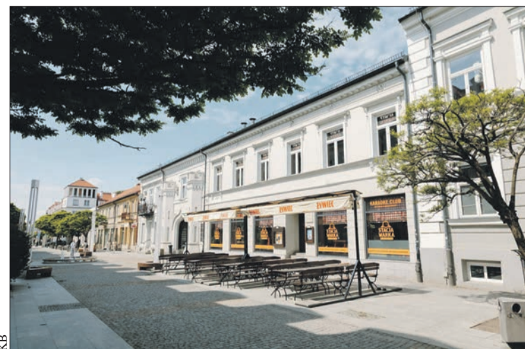
Dawny Hotel Angielski przy ul. Tumskiej