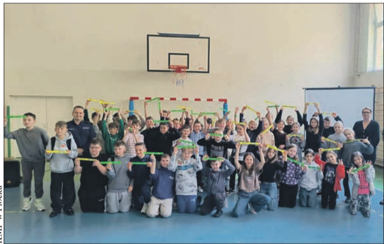
Najmłodsi mieszkańcy Słupna wiedzą już, jak używać odblasków