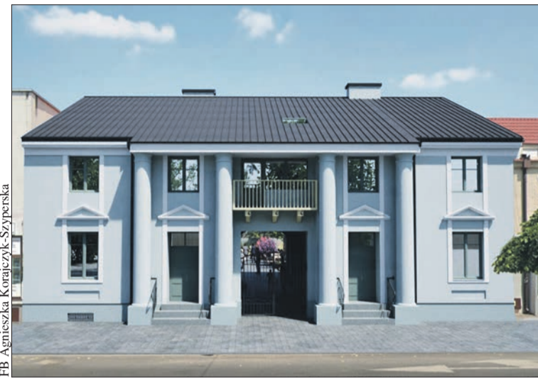
3 mln zł dofinansowania na remont zabytkowej kamienicy przy Rynku 16

- To kolejny krok w kierunku odnowy przestrzeni miejskiej i zachowania lokalnego dziedzictwa. Rewitalizacja pozwoli nadać temu miejscu nową jakość, przy jednoczesnym zachowaniu jego historycznego charakteru – poinformował urząd. Radosław Cichocki