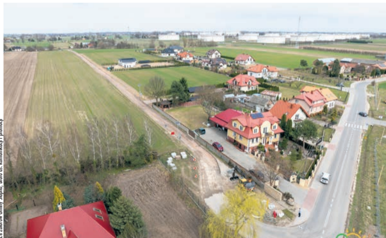
Przebudowa ulicy Mazowieckiej w Cekanowie na odcinku blisko 600 metrów

W gminie rozwija się także infrastruktura pieszo-rowerowa. Coraz bliżej realizacji znajduje się budowa ścieżki pieszo-rowerowej Słupno – Miszewko Strzałkowskie. Inwestycja powstanie w formule „zaprojektuj i wybuduj”. Nowa trasa ma mieć