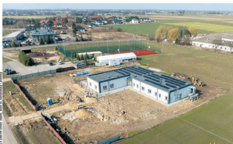
Budowa Centrum Opiekuńczo-Mieszkalnego w Starym Gulczewie

600 metrów. Zakres prac dotyczy jezdni, zjazdów i poboczy. Na tę inwestycję gmina przeznaczyła 760 tys. zł. W Cekanowie trwa również inwestycja pn.: „Budowa ulicy Rumiankowej, ulicy Stokrotki, ulicy Konwaliowej, ulicy Letniej, ulicy Jagodowej oraz ulicy Orzechowej w Cekanowie”. W ramach I etapu przebudowane zostaną: ul. Letnia, ul. Konwaliowa, ul. Orzechowa, część ul. Jagodowej. Projekt obejmuje również wykonanie kanalizacji deszczowej i odwodnienia.