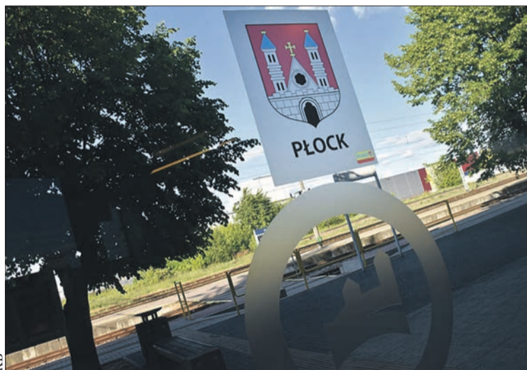
Widok na peron kolejowy w Płocku

Sprawę przejęła Prokuratura Okręgowa z Płocka