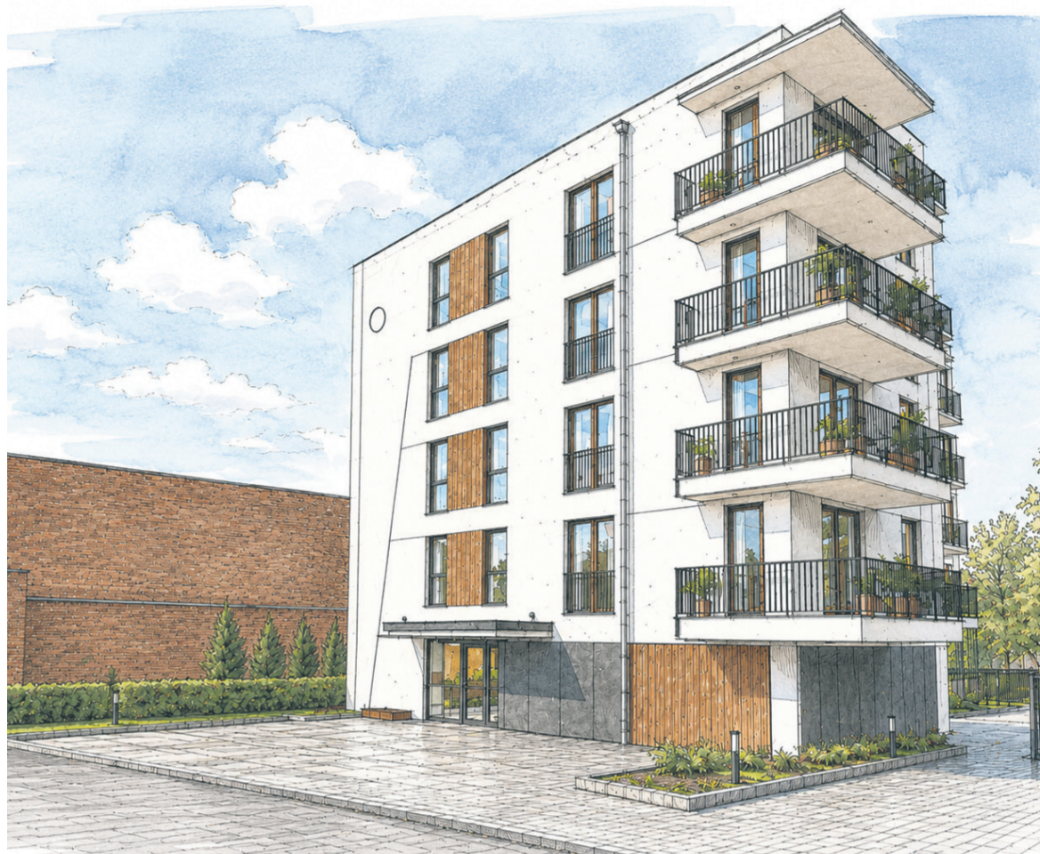
Inwestycja przy Królewieckiej 24 oferuje mniejsze i większe mieszkania o metrażu od 37,54 mkw. (dwa pokoje) do 62,65 mkw. (trzy pokoje)

Lokalizacja, obecność windy i wideodomofonu, podwyższony standard wykończenia i dostęp do miejsc postojowych to niewątpliwe atuty