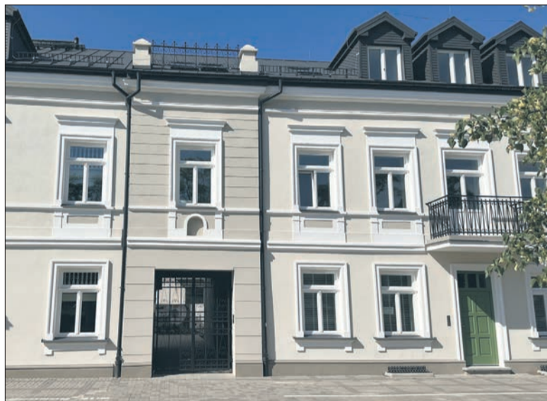
ENKRA Sp. z o.o. Sp.k. działa od 2010 roku. W ofercie ma apartamenty i lokale użytkowe. Lokalizacja w samym sercu starego miasta i wysoki standard to rezydencja przy ulicy Kwiatka 55 w Płocku

czoność. Płock to miasto średniej wielkości, dobrze skomunikowane, pod wieloma względami atrakcyj-