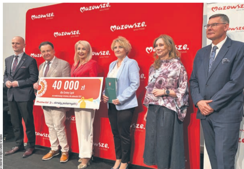
40 tys. zł. dofinansowania trafiło do OSP Korzeń

Dzięki pozyskanemu dofinansowaniu jednostka OSP Korzeń otrzyma wsparcie finansowe, które przeznaczą na bieżące funkcjonowanie oraz wyposażenie, co ma przełożyć się na lepsze przygotowanie strażaków do działań ratowniczo-gaśniczych.