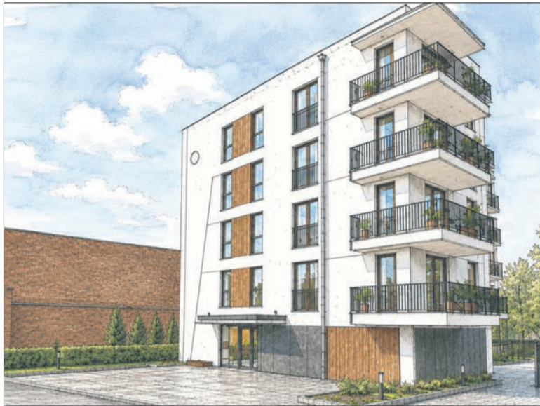
INVEST BUD proponuje mieszkania w centrum – w kameralnym budynku przy Królewieckiej 24

Na płockim rynku nieruchomości znajdziemy sporo mieszkań gotowych do zakupu. Ciągłe powstają nowe osiedla i bloki, które – w zależności od lokalizacji – oferują różni deweloperzy. Jeżeli nie znamy dewelopera odpowiedzialnego za interesujący nas projekt – znajdziemy taki, który już został ukończony. Porozmawiamy z właścicielami mieszkań i dowiedzmy się, czy są zadowoleni.