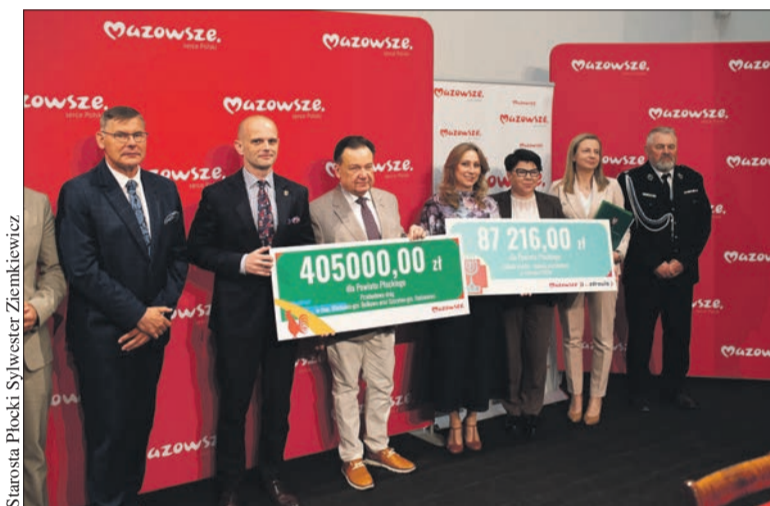
Powiat Płocki pozyskał blisko 500 000 zł wsparcia

Uczniowie z Nowych Łubek poruszyli ważny problem