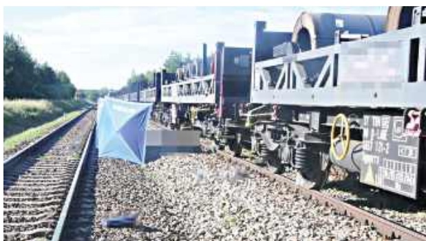
Mężczyzna leżał na międzytorzu prostopadle do torów

- Policjanci wstępnie ustalili, że maszynista pociągu towarowego z podczepionymi wagonami w ilości ponad 40 sztuk jechał od Zamościa do Stalowej Woli. W pewnej chw-