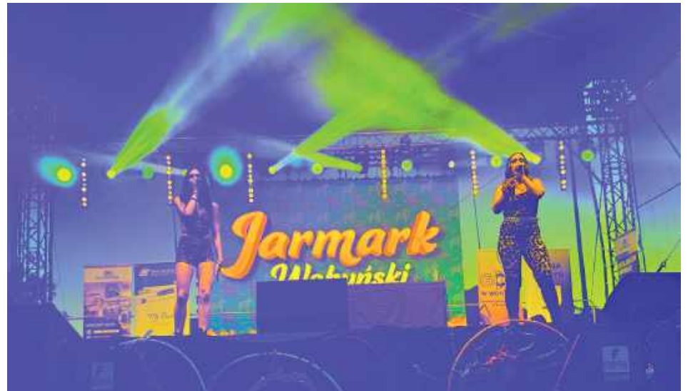
Dobre oświetlenie i ogień wybuchający obok sceny robiły wrażenie

Koncerty gwiazd muzyki rozrywkowej, występy zespołów ludowych, warsztaty, stoiska rzemieślnicze i widowiskowy teatr ognia – tak w skrócie można podsumować tegoroczny Jarmark Wohyński. Dwudniowe święto gminy, które odbyło się 20 i 21 czerwca, przyciągnęło mieszkańców oraz gości z całego regionu.