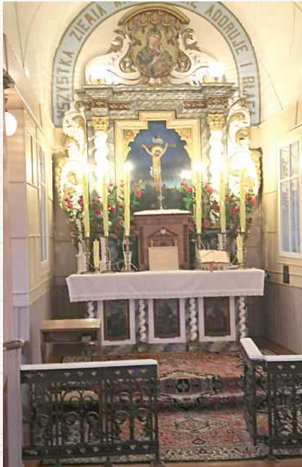
Wnętrze kościoła świętych Piotra i Pawła w Goździe. Ponieważ mariawici odeszli z Kościoła Katolickiego na początku XX wieku, zachowali liturgię zbliżoną do takiej, jaką wtedy odprawiali rzymscy katolicy. Nie ma tzw. ołtarza soborowego, kapłan odprawia „tyłem do ludu” ale w języku polskim