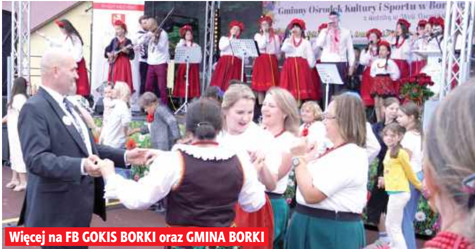
Więcej na FB GOKiS BORKI oraz GMINA BORKI

Prawdziwą gwiazdą wieczoru i muzycznym prezentem dla wszystkich uczestników jubileuszu był koncert zespołu Guzowianki. Żywiłowy występ artystek porwał publiczność do wspólnej zabawy, śpiewu i tańca