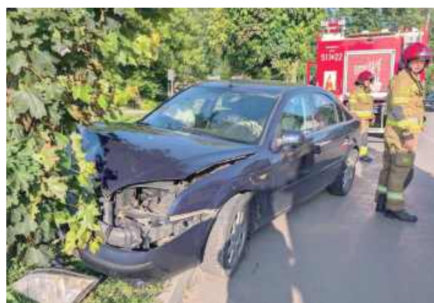
Badanie alkometem nie pozostawiło żadnych wątpliwości. Urządzenie wykazało w organizmie 52-latka ponad 2 promile alkoholu

Zgłoszenie o zdarzeniu drogowym wpłynęło do dyżurnego KPP w Radzynie 16 czerwca tuż po godzinie 18. Na miejsce skierowano patrol, który potwierdził informację o rozbitym samochodzie marki Ford Mondeo. Ze wstępnych ustaleń wynika, że kierujący