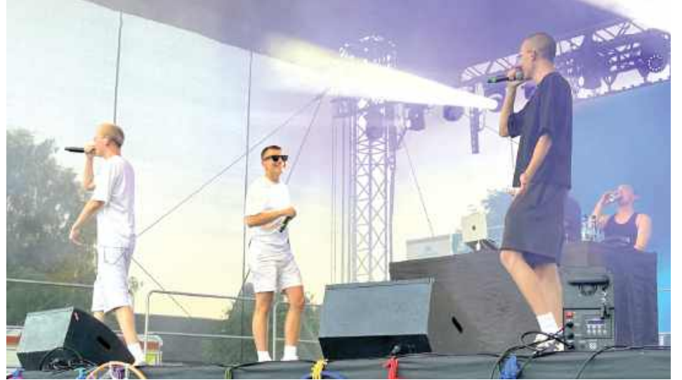
Na scenie wystąpili Brokies, których utwory w internecie generują w ostatnim czasie miliony odsłon