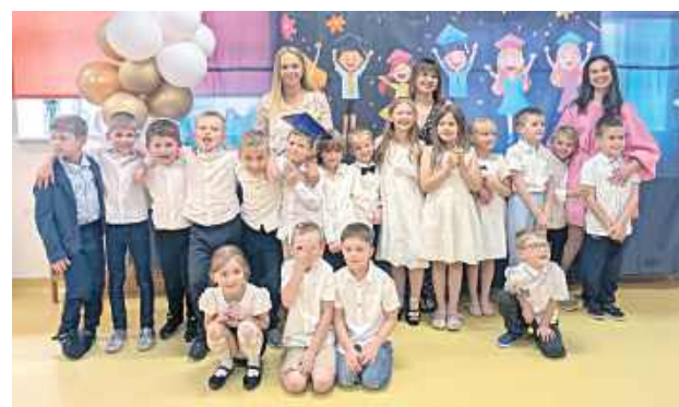
Podczas uroczystości nie brakowało uśmiechów, wspomnień i podziękowań. Był to szczególny moment zarówno dla dzieci, jak i rodziców oraz nauczycieli, którzy przez lata towarzyszyli przedszkolakom w codziennych sukcesach, zabawach i nauce

To był wyjątkowy i pełen emocji dzień w Przedszkolu Miejskim nr 3 w Radzynie Podlaskim. Najstarsza grupa „Sówki” oficjalnie pożegnała przedszkole, kończąc ważny etap swojej edukacyjnej przygody.