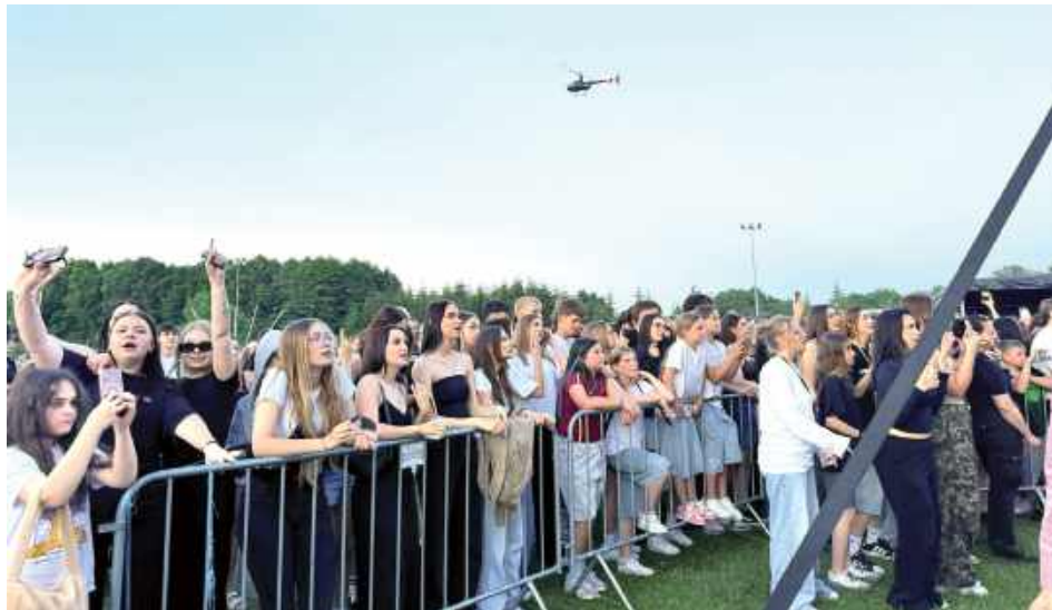
Nad Wohyniem latał tego dnia helikopter - dodatkowa atrakcja wydarzenia!