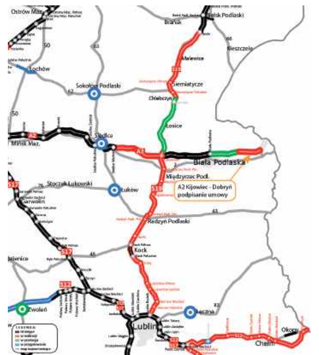
Rusza budowa przedostatniego odcinka A2

Budowa odcinka Kijowiec – Dobryń jest częścią większego przedsięwzięcia, którego celem jest dokończenie autostrady A2 w województwie lubelskim. Pod koniec 2025 roku do ruchu oddano 10 kilometrów trasy między węzłami Siedlce Południe i Siedlce Wschód. W kwietniu 2026 roku kierowcy otrzymali do dyspozycji kolejne 27 kilometrów pomiędzy Łukowiskiem a Białą Podlaską. Na odcinku Siedlce – Łukowisko prace dobiegają końca, a jego udostępnienie planowane jest do końca czerwca.