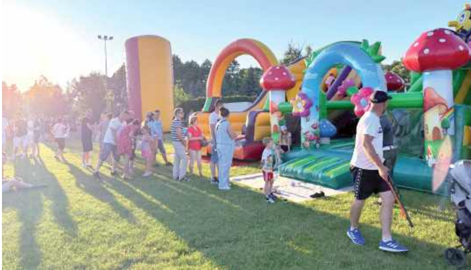
Organizatorzy przygotowali też wiele atrakcji dla najmłodszych