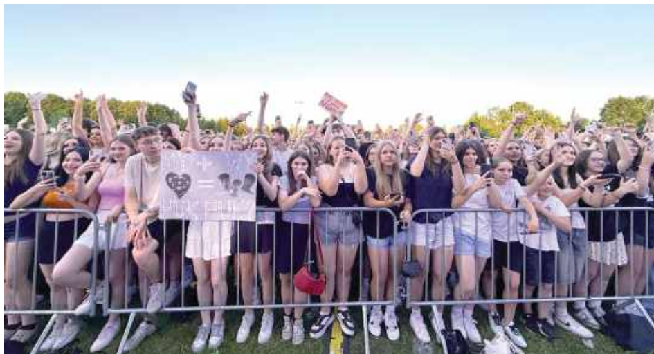
Fani przygotowali nawet specjalne transparenty