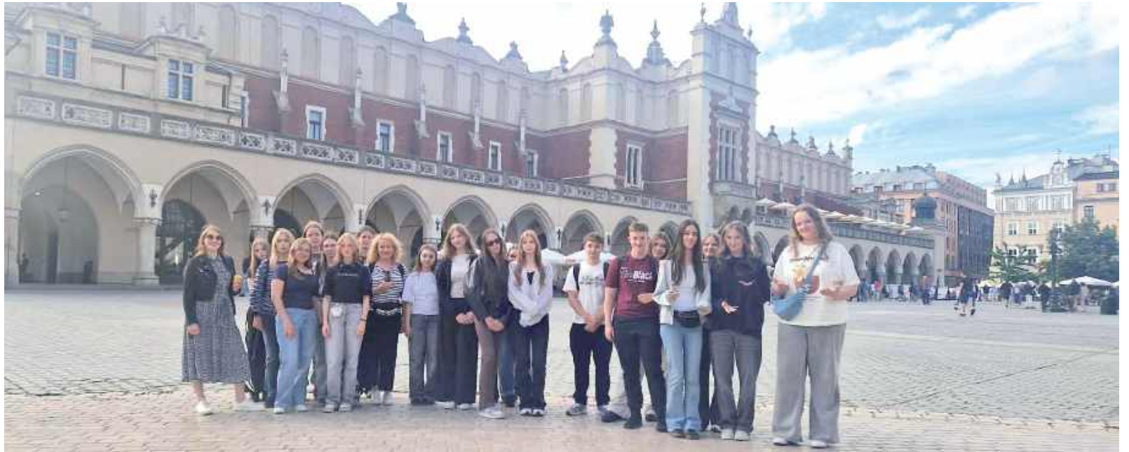
Dzień w Krakowie był wyjątkowy - odkrywaliśmy najciekawsze zakątki miasta, podziwiając jego wyjątkową architekturę, zabytki oraz niepowtarzalną atmosferę

Drugiego dnia, po śniadaniu, wyruszyliśmy do Krakowa. Zwiedzanie rozpoczęliśmy od Wawelu – jednego z najwaz-