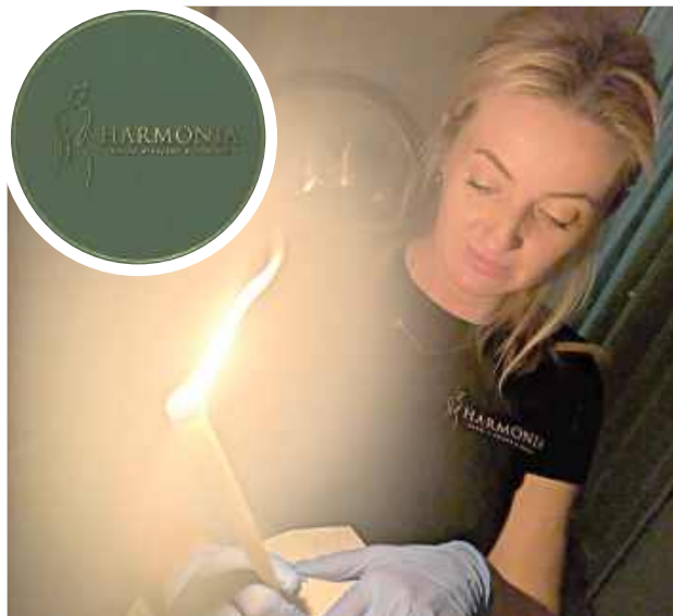
Dodatkowym udogodnieniem jest elastyczny system rezerwacji. Nie obowiązują tu sztywne godziny pracy – terminy ustalane są indywidualnie, zgodnie z potrzebami klientów

Dodatkowym udogodnieniem jest elastyczny system rezerwacji. Nie obowiązują tu sztywne godziny pracy – terminy usta-