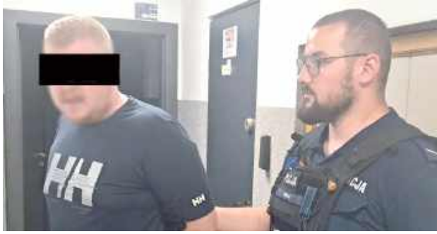
Zatrzymanym okazał się 28-letni mieszkaniec Poniatowej. Badanie wykazało, że miał w organizmie blisko 2 promile alkoholu