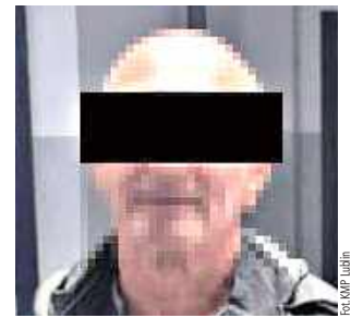
Mężczyźnie grozi do 10 lat więzienia

- Z ustaleń policjantów wynika, że sprawca przy użyciu wytrychów pokonał zabezpieczenia drzwi i dostał się do jednego z mieszkań. Jego celem była kradzież znajdujących się wewnątrz przedmiotów. Mężczyzna nie zdołał jednak zrealizować swojego planu. Gdy zauważył w mieszkaniu kamerę, uciekł z miejsca zdarzenia - informuje