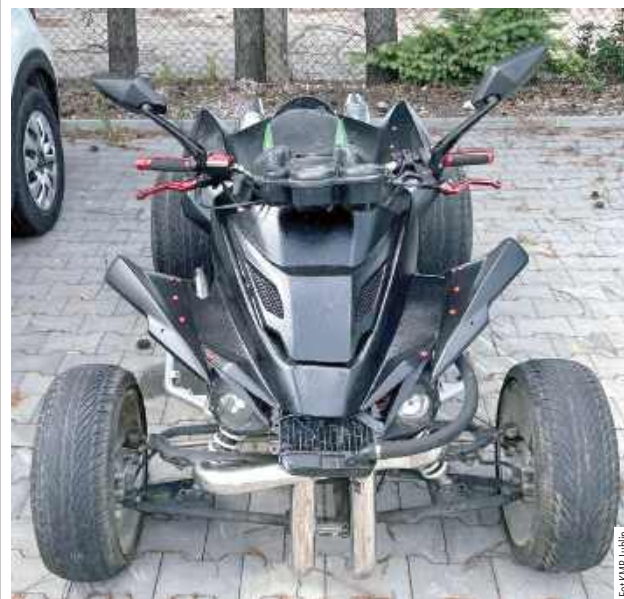
Takim pojazdem obcokrajowiec szarżował po centrum Lublina. Okazało się, że ma zakaz prowadzenia wszelkich pojazdów

Lublin: Zatrzymany został obywatel Gruzji, który uciekając quadem przed policjantami, w centrum stwarzał poważne zagrożenie dla bezpieczeństwa innych osób. Zmuszał pieszych do ucieczki z toru jazdy, jechał chodnikiem, wjeżdżał w miejsca objęte zakazem ruchu oraz doprowadzał do niebezpiecznych sytuacji na drodze.