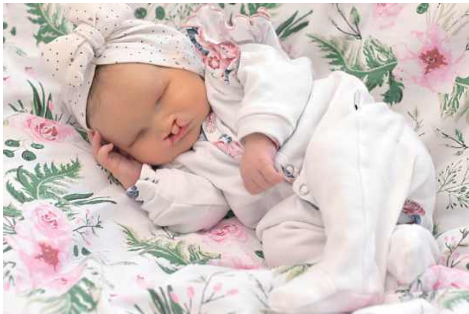
Mała Lilianka od pierwszych dni życia zmagają się z licznymi ciężkimi wadami wrodzonymi. Przed dziewczynką długa droga leczenia, rehabilitacji oraz specjalistycznych operacji, w tym kosztownego leczenia za granicą