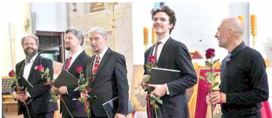
Na scenie wystąpił Męski Zespół Muzyki Cerkiewnej IKOS

14 czerwca w kościele pw. bł. Honorata Koźmińskiego w Białej Podlaskiej zabrzmiały ostatnie akordy tegorocznej, siódmej już edycji Festiwalu Muzyki Organowej i Kameralnej. Uroczysty koncert finałowy dostarczył zgromadzonej publiczności wielu niezapomnianych muzycznych i duchowych wzruszeń.