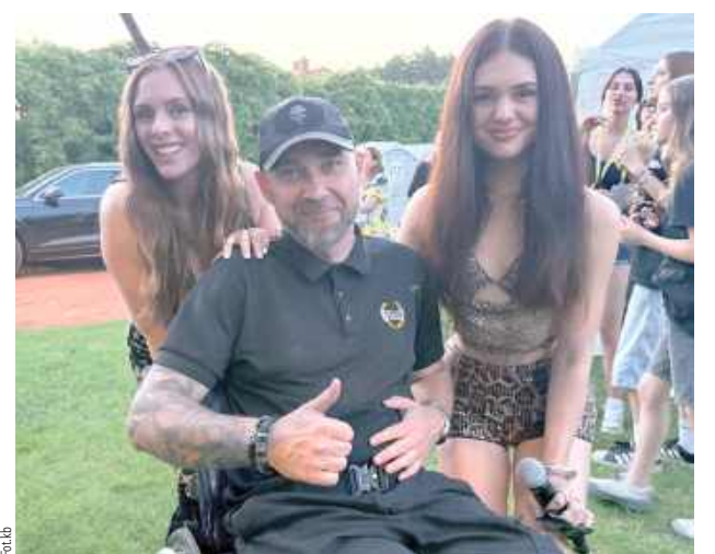
Jedną z gwiazd wieczoru był znany fanom muzyki disco polo zespół Top Girls

Przez dwa dni nie brakowało także atrakcji dla najmłodszych. Organizatorzy przygotowali warsztaty rękodzielnicze, zajęcia plastyczne, malowanie twarzy oraz zagrodę ze zwierzętami. Wszystko to sprawiło, że Jarmark Wohyński po raz kolejny stał się miejscem integracji mieszkańców i promocji naszej kultury.