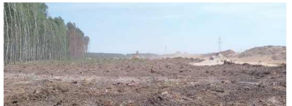
W okolicach Dobrynia trwa już przygotowanie terenu

Nowa trasa będzie miała dwie jezdnie po dwa pasy ruchu, z pozostawioną rezerwą pod budowę trzeciego pasa w przyszłości. W ramach inwestycji powstanie m.in. ponad kilometrowy most nad doliną rzeki Krzny, pięć wiaduktów, przejścia dla zwierząt i płazów, para miejsc obsługi podróżnych (MOP) Kijowiec oraz węzeł Dobryń.