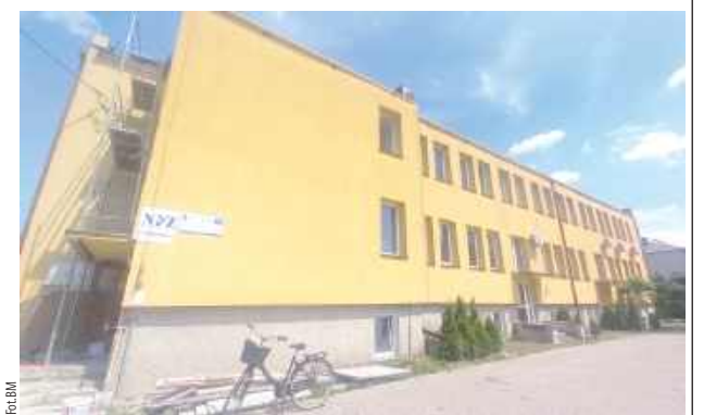
Przy Wojska Polskiego niedługo ruszy żłobek. Trwa adaptacja pomieszczeń. Zapisy już trwają