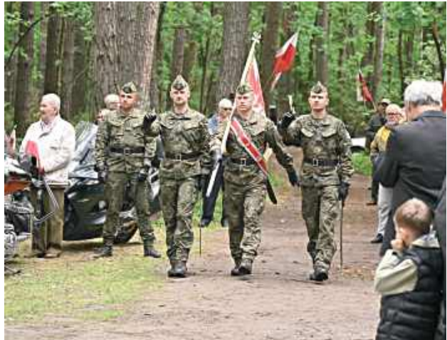
Tegoroczne wydarzenie odbyło się pod honorowym patronatem prezydenta RP Karola Nawrockiego

Modlitwa, wojskowy ceremoniał i hołd oddany ofiarom komunistycznych represji. W niedzielę, 14 czerwca na Uroczysku Baran w Kąkolewnicy odbyły się doroczne uroczystości patriotyczno-religijne upamiętniające żołnierzy polskiego podziemia niepodległościowego zamordowanych po II wojnie światowej. Tegoroczne wydarzenie odbyło się pod honorowym patronatem prezydenta RP Karola Nawrockiego.