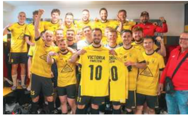
Czy Victoria zagra w IV lidze?

W pierwszym półfinale miały zmierzyć się drużyny z okręgów chełmskiego i lubelskiego. Ostatecznie prawo gry w barażach uzyskały Astra Leśniowice i KS Cisowianka Drzewce. W drugim półfinale Graf Chodwańce miał udać się do Parczewa na spotkanie z Victorią, która już wcześniej zapewniła sobie drugie miejsce w tabeli.