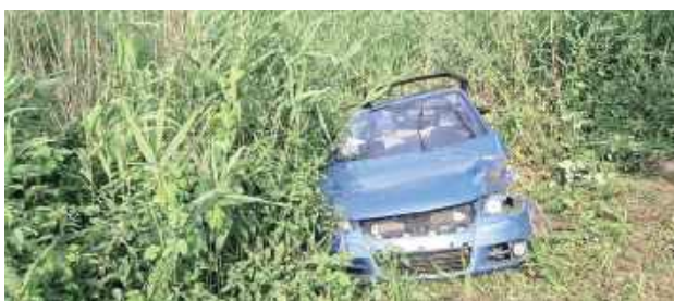
Mężczyzna posiadał wymagane uprawnienia do kierowania pojazdami

W piątek (19 czerwca) na ul. Lubelskiej w Rykach, w ciągu drogi wojewódzkiej nr 839 samochód osobowy wjechał w szuwaru stawu położonego przy drodze.