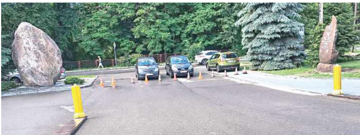
„Pamiętajmy, że źle zaparkowany samochód to nie tylko wykroczenie. To potencjalna przeszkoda dla służb ratunkowych niosących pomoc”

LUBLIN: Zaparkowane pod remizą auta blokowały wyjazd pojazdów ratowniczo-gaśniczych z OSP KSRG Garbów. Strażacy apelują o rozważę.