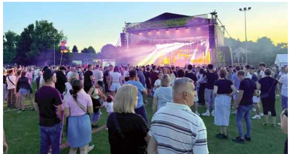
Liczba uczestników była ogromna. Warto zauważyć, że to w większości młodzi ludzie