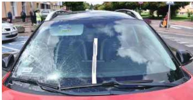
Tak tuż po wypadku wyglądała przednia szyba auta prowadzonego przez sędzię. Niestety, pokrzywdzony 83-letni pieszy zmarł w szpitalu w wyniku obrażeń

Okazało się, że za kierownicą auta, które potrąciło mężczyznę, siedziała sędzia Sądu Rejonowego Lublin-Wschód w Lublinie z siedzi-