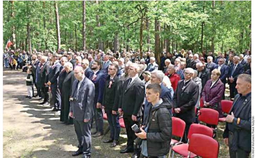
Obchody zgromadziły przedstawicieli władz państwowych, samorządowych, organizacji kombatanckich, środowisk patriotycznych oraz mieszkańców regionu, dla których pamięć o ofiarach „Małego Katynia” pozostaje ważnym elementem naszej lokalnej i narodowej tożsamości

W uroczystościach uczestniczyli parlamentarzyści, przedstawiciele administracji rządowej i samorządowej, duchowieństwo, organizacje społeczne oraz środowiska kombatanckie. W obchodach uczestniczyła również młodzież szkolna z Kąkolewnicy, Brzozowicy Dużej, Polskowioli, Turowa i Żakowoli Poprzecznej.