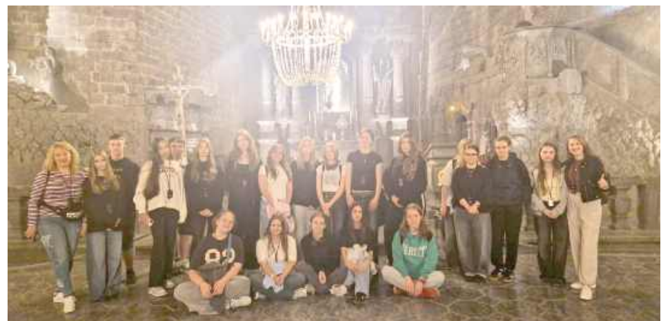
Wizyta w kopalni soli w Wieliczce była doskonałym zwieńczeniem całego wyjazdu

Wizyta w kopalni była doskonałym zwieńczeniem całego wyjazdu. Po zakończeniu zwiedzania wyruszyliśmy w drogę powrotną do domu,