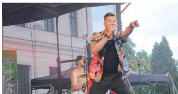
Koncert zaczął Power Play