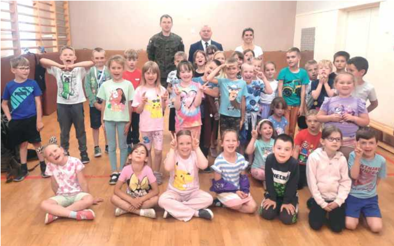
Organizatorzy spotkań z dziećmi z przedszkola w Nasutowie

Przedstawiciele Wojskowego Centrum Rekrutacji w Lublinie uczestniczyli w spotkaniach z przedszkolakami z placówek gminy Niemce. Celem ich odwiedzin było zaprezentowanie „maluchom” elementów ubioru żołnierza i opowiedzeniu o służbie.