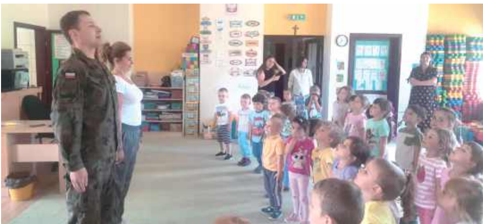
Postawa na baczność w wykonaniu przedszkolaków z Nasutowa