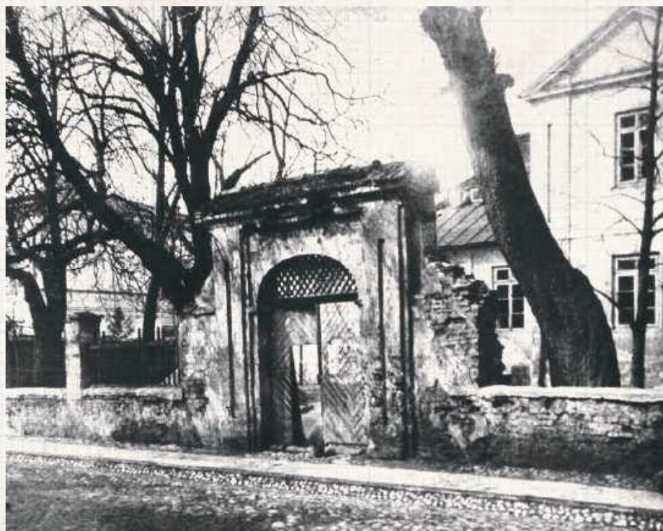
Dawne, nieistniejące już wejście bramne do konwikt Szaniawskich. Obecnie w budynku mieści się Muzeum Regionalne