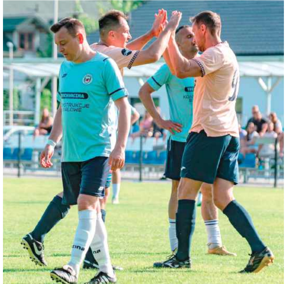
Zespół Błękitu zakończył rozgrywki na trzeciej lokacie, mimo że ambicje były większe