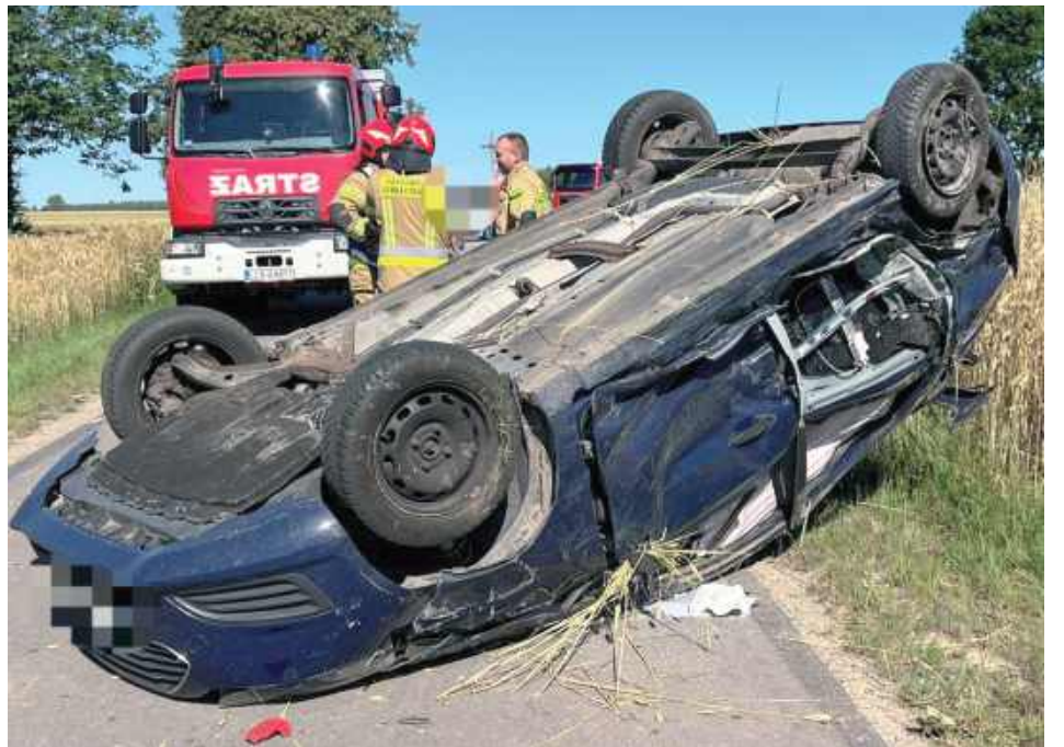
31-letni kierowca samochodem marki Opel nie ustąpił pierwszeństwa przejazdu prawidłowo poruszającemu się Fordowi

Do zdarzenia doszło 1 lipca około godz. 7.27.