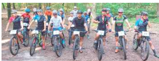
Będzie się działo. Pierwsze zmagania już 19 lipca

Organizatorem wydarzenia jest Puławskie Towarzystwo Krzewienia Kultury Fizycznej,