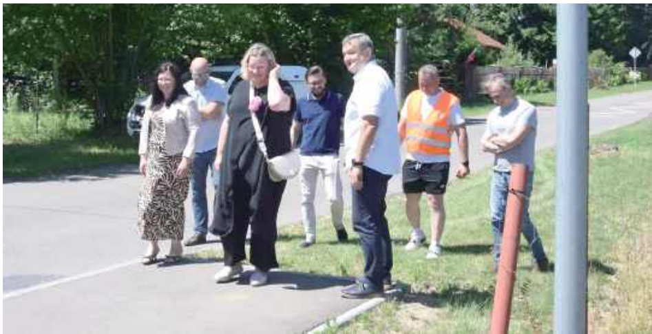
Władze powiatu przekazują plac budowy do kontynuacji chodnika z Woli Niemieckiej do Dysa

Mieszkańcy Woli Niemieckiej i Dysa oraz wszyscy, którzy mieszkają przy drodze łączącej obie miejscowości, doczekali się drugiego etapu budowy chodnika. Władze powiatu niedawno przekazały plac budowy.