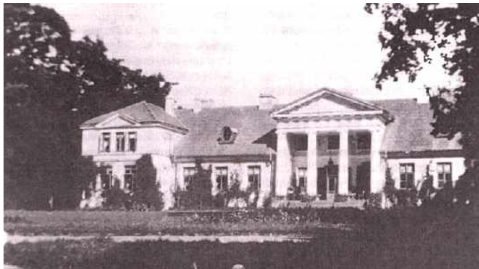
Dwór w Samokłęskach powstał ponad 200 lat temu

- Obecnie odbywają się negocjacje ze spadkobiercami, musimy to załatwić ugodowo,