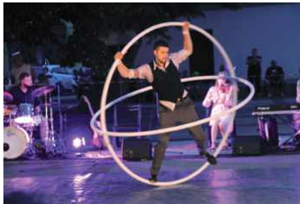
Tak wyglądało przedstawienie rok temu

Film muzyczny – dokumentalny. Krakowska dzielnica - Kazimierz. Mordechaj Gebirtig, z zamówienia poeta i kompozytor,