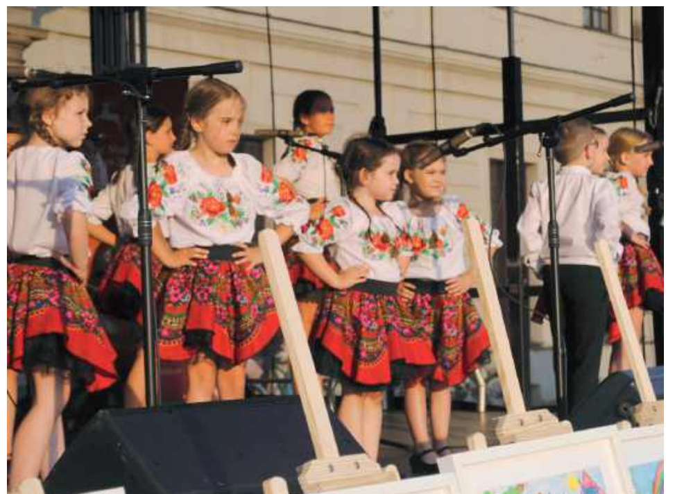
Mała Rokiczka na scenie