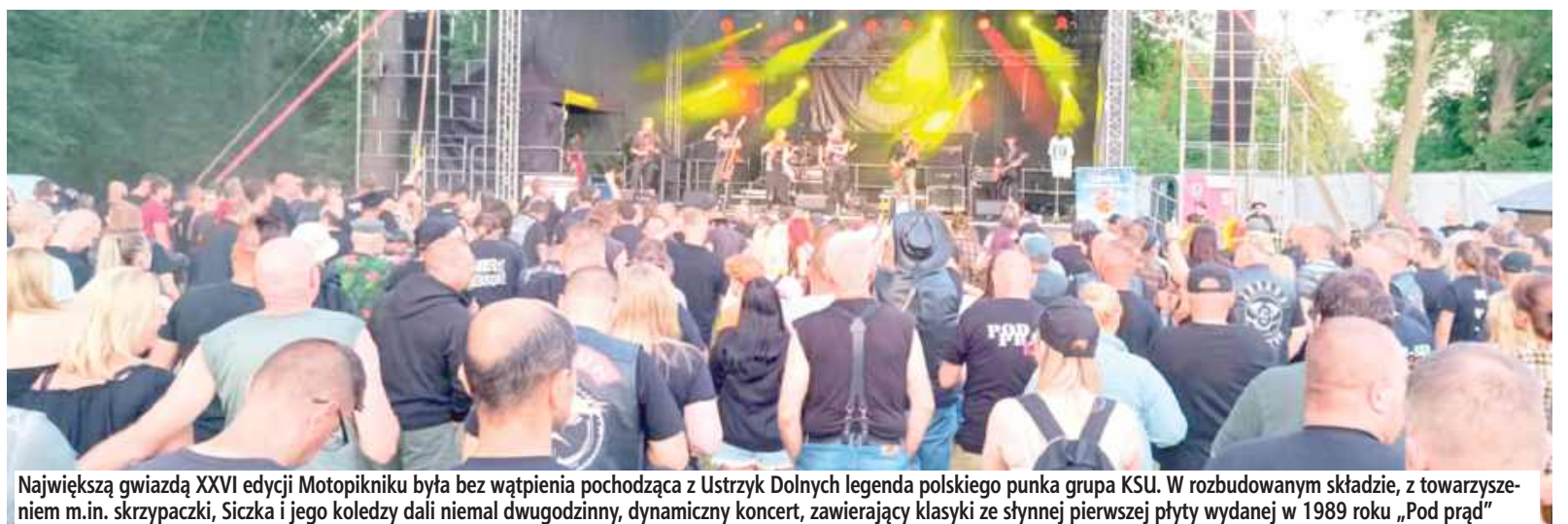
Największą gwiazdą XXVI edycji Motopikniku była bez wątpienia pochodząca z Ustrzyk Dolnych legenda polskiego punka grupa KSU. W rozbudowanym składzie, z towarzyszeniem m.in. skrzypaczki, Siczka i jego koledzy dali niemal dwugodzinny, dynamiczny koncert, zawierający klasyki ze słynnej pierwszej płyty wydanej w 1989 roku „Pod prąd”