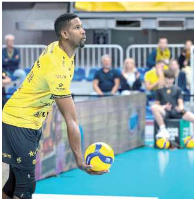
Wilfredo Leon - gwiazda Bogdanki LUK Lublin

Mistrzowie Polski rywalizować będą w siatkarskiej Lidze Mistrzów, a priorytetem będzie oczywiście obrona tytułu na boiskach PlusLigi. Ta rozpocznie się 21 października, bo wówczas ruszy nowy sezon polskiej ligi. Szczegółowego terminarza jeszcze nie ma, ale do tego czasu lublinianie mają czas na przygotowania.