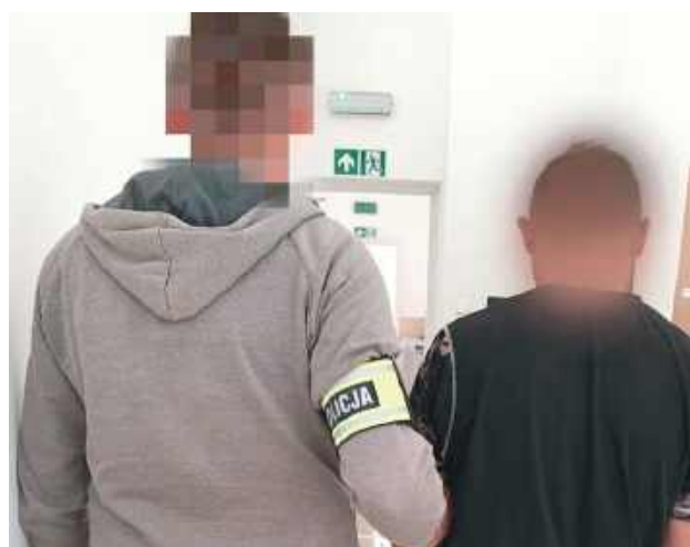
Za popełnione przestępstwa grozi mu kara do ośmiu lat pozbawienia wolności

- Na miejscu okazało się, że 40-letni mężczyzna pod wpływem alkoholu wszczął awanturę, podczas której wyzywał swoją partnerkę, szarpał ją i uderzył. Podczas interwencji był agresywny. Jak się okazało, miał ponad 2,5 promila alkoholu w organizmie. Funkcjonariusze zatrzymali agresora i przewieźli do policyjnej celi. Podczas prowadzonego postępowania okazało się, że mężczyzna od kilku lat znęcał się fizycznie i psychicznie nad ko-