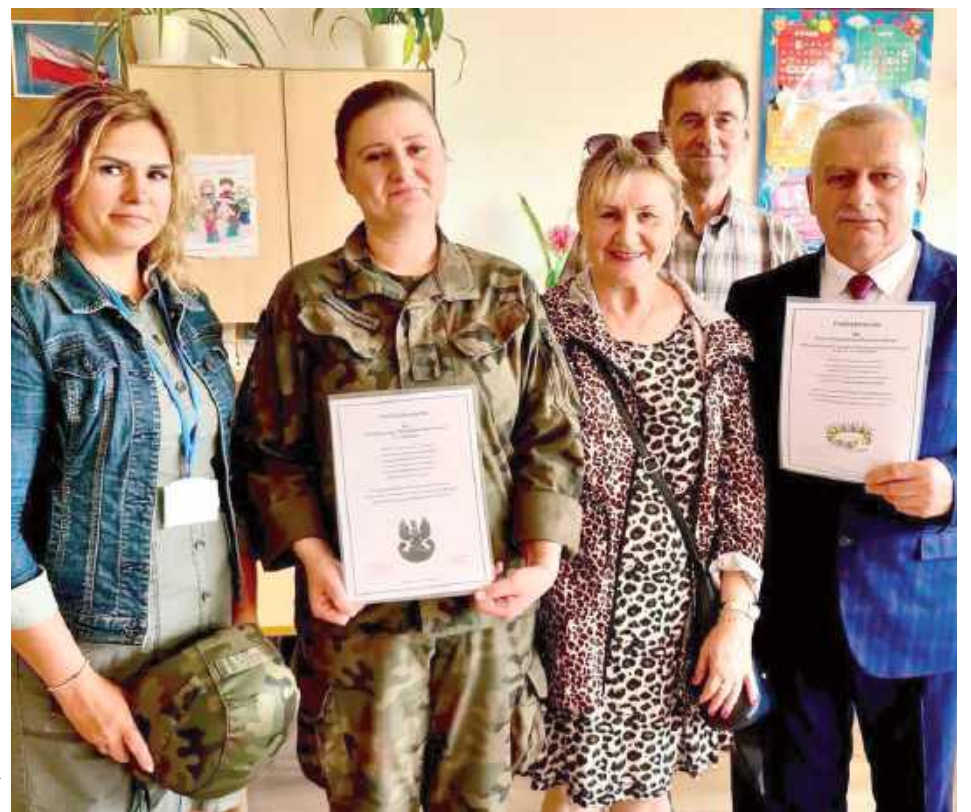
Organizatorzy z pamiątkowymi dyplomami