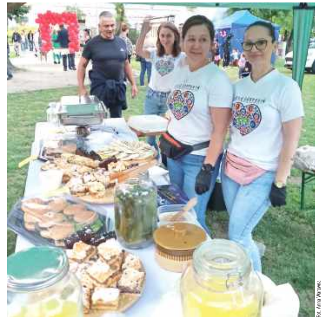
Panie z KGW w Niemcach zadbały o kulinarne rarytasy będące smacznym uzupełnieniem odpustowej potańcówki