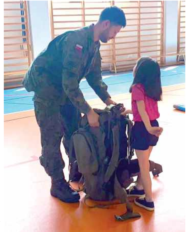
Co jest w wojskowym plecaku? Ciekawość zaspokoili przedszkolaki z Jakubowic Konińskich