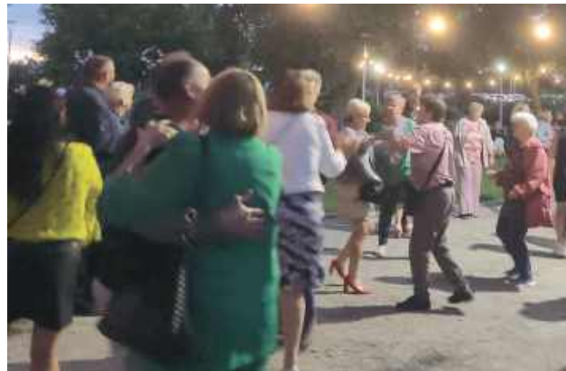
Zabawa była przednia. Następną... za rok

– Chciałyśmy wrócić do tego, co kiedyś było tak naturalne – do wspólnego spędzania czasu, rozmów, śmiechu i tańca – powiedziała jedna z organizatorek. – Takie odpustowe potańcówki odbywały się regularnie, nasze babcie i prababcie właśnie tak świętowały. Dziś, w tym szybkim świecie, warto zatrzymać się