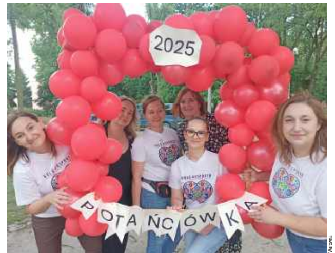
Panie z KGW w Niemcach serdecznie zapraszają