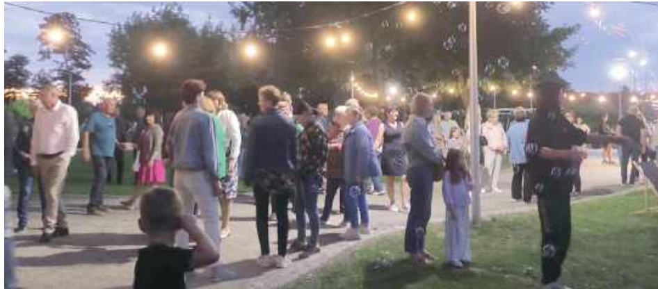
Park w Niemcach wypełnił się mieszkańcami i gośćmi, którzy chętnie uczestniczyli w potańcówce

Na uczestników czekała muzyka na żywo, a energiczne dźwięki orkiestry sprawiły, że nogi same rwały się do tańca. Już od pierwszych taktów parkowe alejki wypełniły się parami, a radosna atmosfera