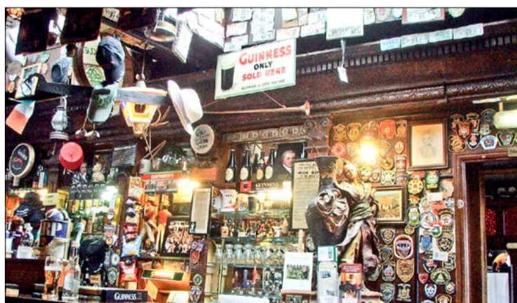
To tu Guinness smakuje najlepiej.