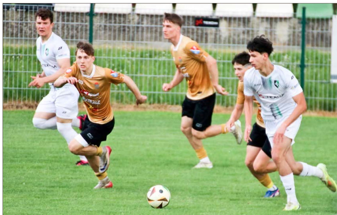
Porażką w Błazowej Igloopol (złote koszulki) zamknął sobie drogę do gry w barażach o III ligę.