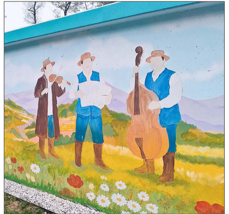
Mural poświęcony Igloopolanom jest jeszcze w trakcie tworzenia.