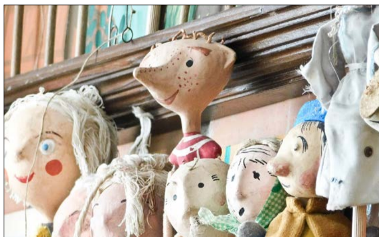
Powrót do dzieciństwa.