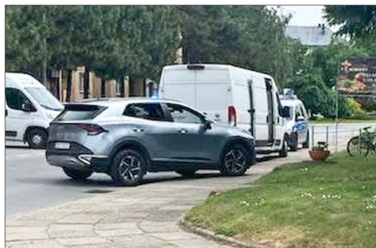
Policjanci zabezpieczyli ślady.