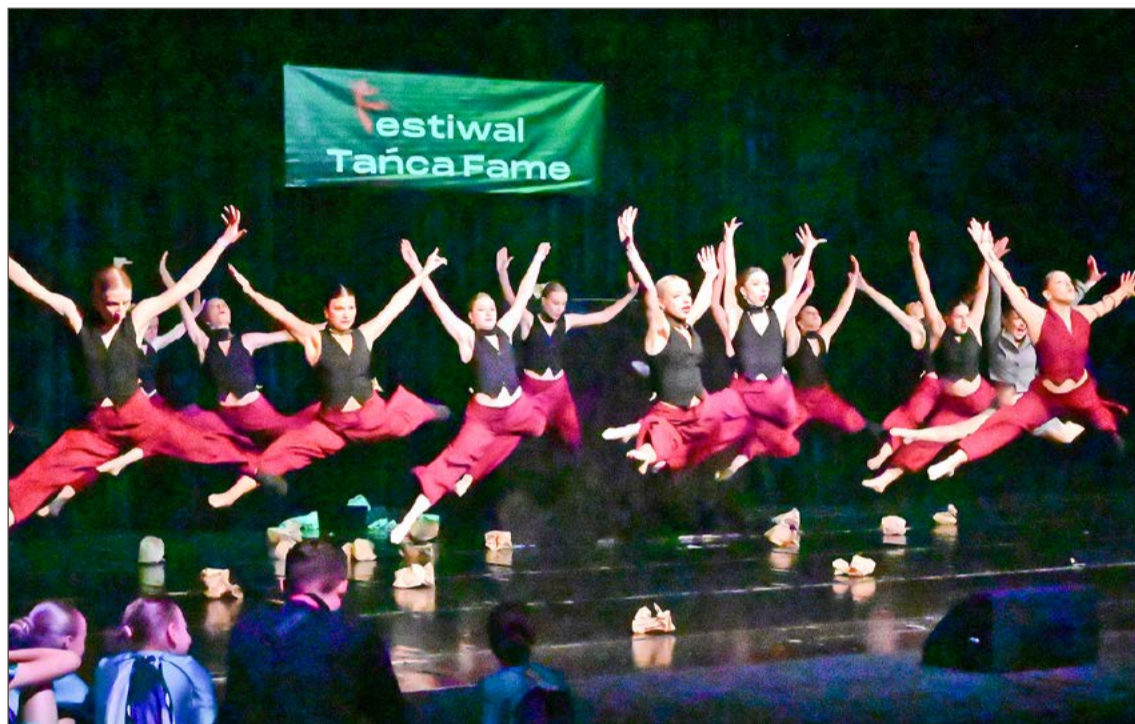
Podczas festiwalu przez cały dzień na scenie Domu Kultury Mors wiele się działo.

Tym bardziej więc Fame Festiwal ma szansę z roku na rok cieszyć się coraz większym powodze-