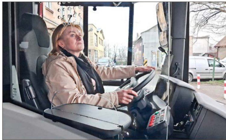
Prezes MKS zapowiada, że jak tylko będą programy, to nadal i spółka, i miasto będą starać się o pieniądze na kolejne nowe autobusy.

kilkanaście miesięcy na dostawę, dlatego sądzę, że nowe autobusy pojawią się w Dębicy za około dwa lata - podkreśla Agnieszka Zajac.