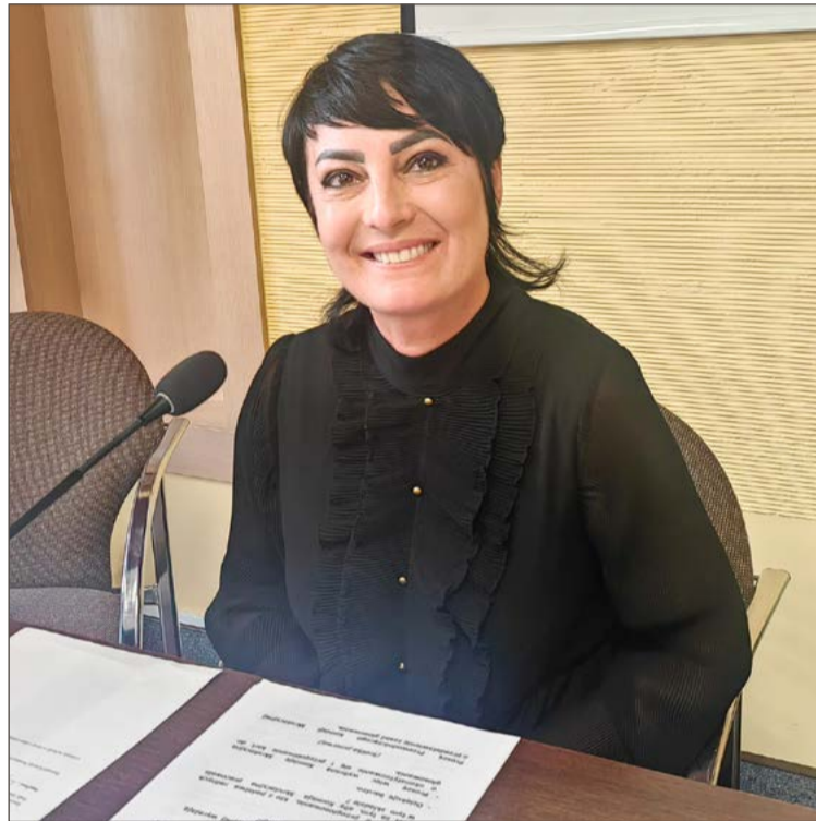
Przewodnicząca rady gminy uznała, że się myliła.

nienawiści. Ale już kilka dni później nie kryła swoich wątpliwości, czy publiczny lincz na radnym to dobra forma dialogu.