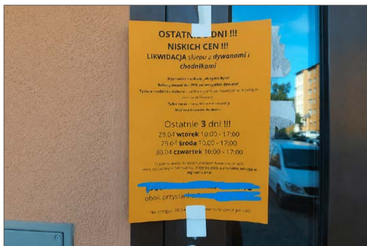
Takie ogłoszenia nader często widywane są na drzwiach klatek.

Zastrzega, że tak on, jak i jego pracownicy starają się rozmawiać z firmami, które mimo tego umieszczają swoje materiały na drzwiach prowadzących do klatek. Zazwyczaj przynosi to skutek. Jeśli nie, to spółdzielnia sięga po ostrzejsze środki i zgłasza sprawę na poli-