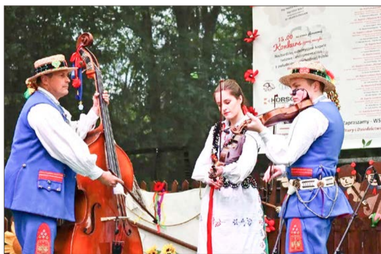
Kapela Iskierczanie podczas występu na festiwalu w Kolbuszowej.

Zdobyli ją podczas 13. edycji Festiwalu Muzyki na Strun Dwanaście i trzy Smyki.