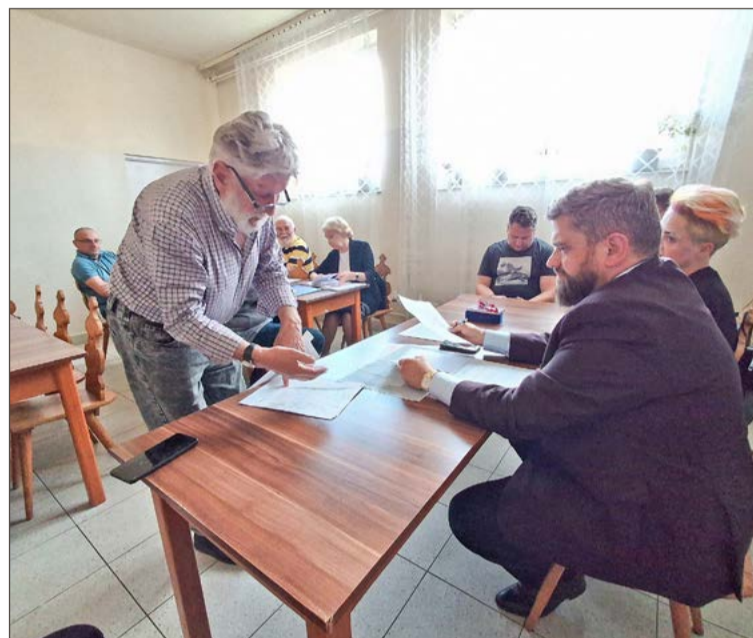
Mieszkańcy mieli okazję zgłosić problemy bezpośrednio burmistrzowi.