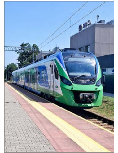
Z Dębicy pojedziemy na jedno z największych lotnisk w Europie.

Dla Dębicy uruchomienie nowego połączenia oznacza kolejny krok w kierunku poprawy dostępności komunikacyjnej miasta. Bezpośredni dostęp do Frankfurtu i jednego z największych portów lotniczych w Europie może okazać się szczególnie atrakcyjny dla osób