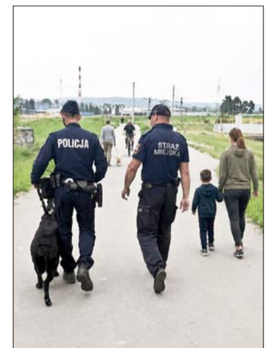
Patrole będzie można zobaczyć na ulicach miasta.

nariuszom - mówi zastępca szefa prewencji.