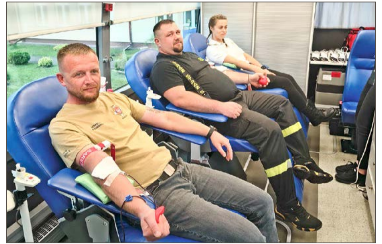
Chętnych do oddania krwi nie brakowało.