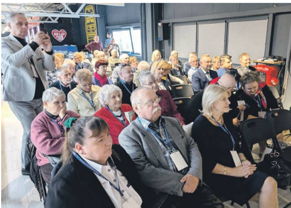
Uczestnicy jubileuszowego spotkania mieli okazję wysłuchać kilku prelekcji na temat cukrzycy