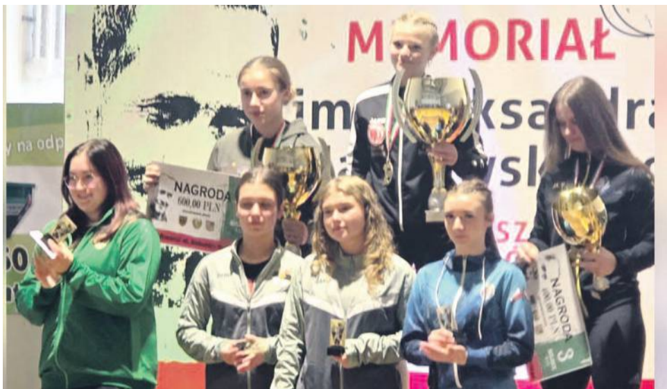
Podium dziewcząt do lat 17