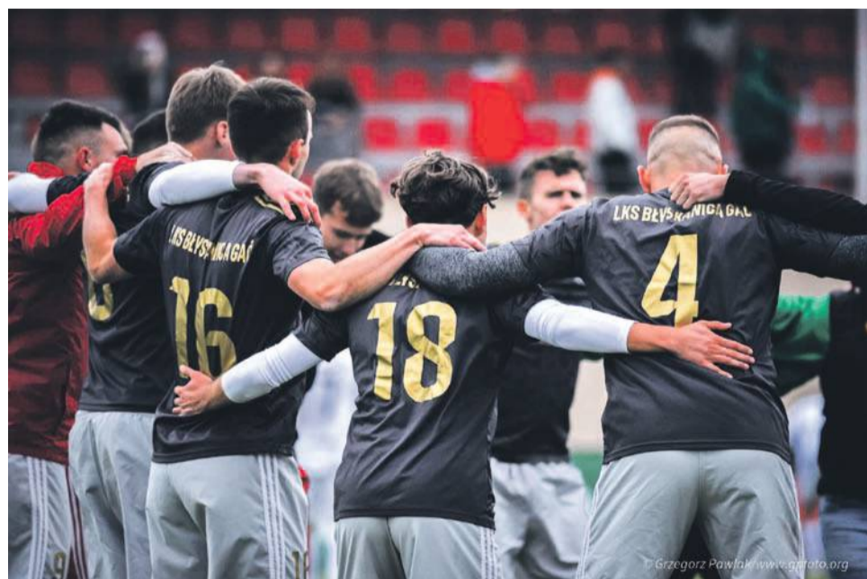
„Błyskawica” pewnie wygrała z Wałbrzychem