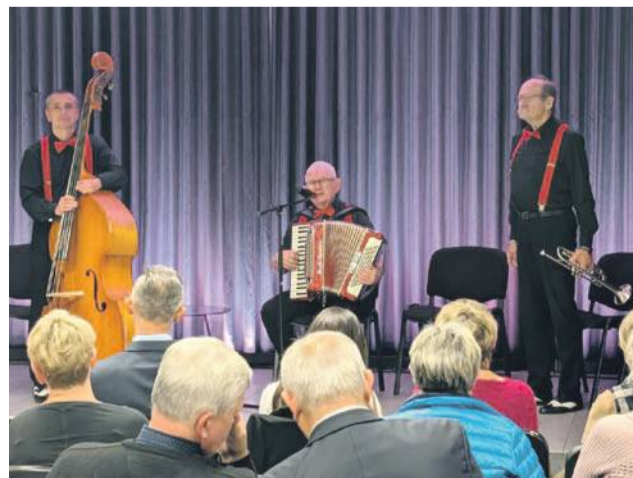
Nie brakowało ciekawych historii, wzruszeń, a spotkanie zwińczył koncert zespołu „Takie Ostatnie Trio”