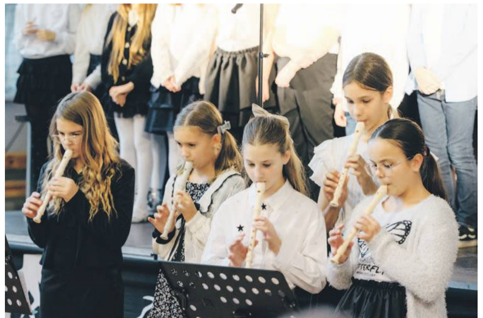
Podczas jubileuszu występowali uczniowie

z całym przekonaniem potwierdzić, że to miejsce z duszą, wyróżniające się jakimś szczególnym, pozytywnym klimatem i energią. Poczuję to już na początku mojej pracy zawodowej nauczyciela polonisty i od września 1991 roku to przekonanie wciąż mi towarzyszy, wciąż do mnie wraca. To, jak szkoła jest postrzegana, zależy zawsze od ludzi, od ich autentyczności, odpowiedzialności, pasji, zaangażowania, sposobu nawiązywania relacji. A w naszej „Trójce u Prusa” jest takich ludzi bardzo wielu! Uwielbiam pracować z nimi, gdy się rozkręcą, bo chcą, by w szkole coś się działo. Wiem, że jako dyrektor mogę liczyć na nich w chwilach próby. I stwierdzić trzeba, że zawsze w chwilach wyzwań, przy realizacji planów i pomysłów znajdowaliśmy wsparcie w rodzicach i lokalnym środowisku. Jak powiedział nasz patron Bolesław Prus: „Kto pragnie dobra, ten zawsze znajdzie sposób, aby je czynić.” Jesteśmy szkołą szczególną poprzez funkcjonowanie od początku lat 90. w dwóch budynkach, w dwóch różnych częściach miasta - na Prusa i na Hirszfelda. Dawniej zajęcia odbywały się także w budynku przy ul. Kukułczej,