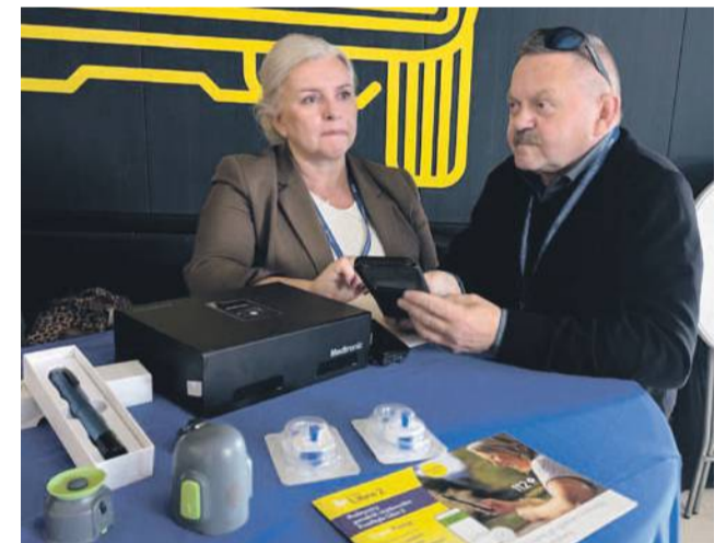
Jubileusz był też okazją, aby się zbadać i poznać najnowszy sprzęt przydatny diabetykom