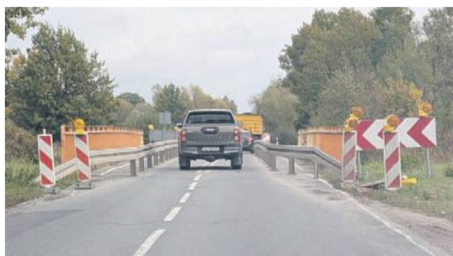
Cała inwestycja, czyli około 4 kilometrów drogi, wraz z pięcioma mostkami, ma być zrealizowana do połowy 2027 roku