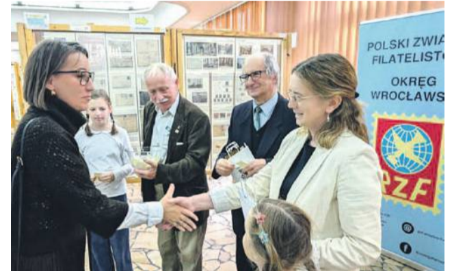
W tym roku było wiele nagród dla publiczności

Z ogromnym smutkiem i bólem przyjeliśmy wiadomość o śmierci naszego wieloletniego pracownika