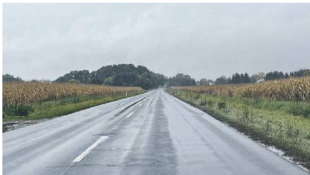
Chodzi o odcinek ponad 6 km