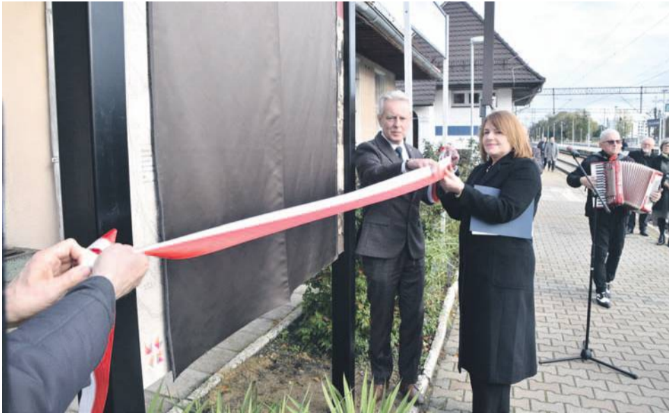
Moment odsłonięcia tablicy