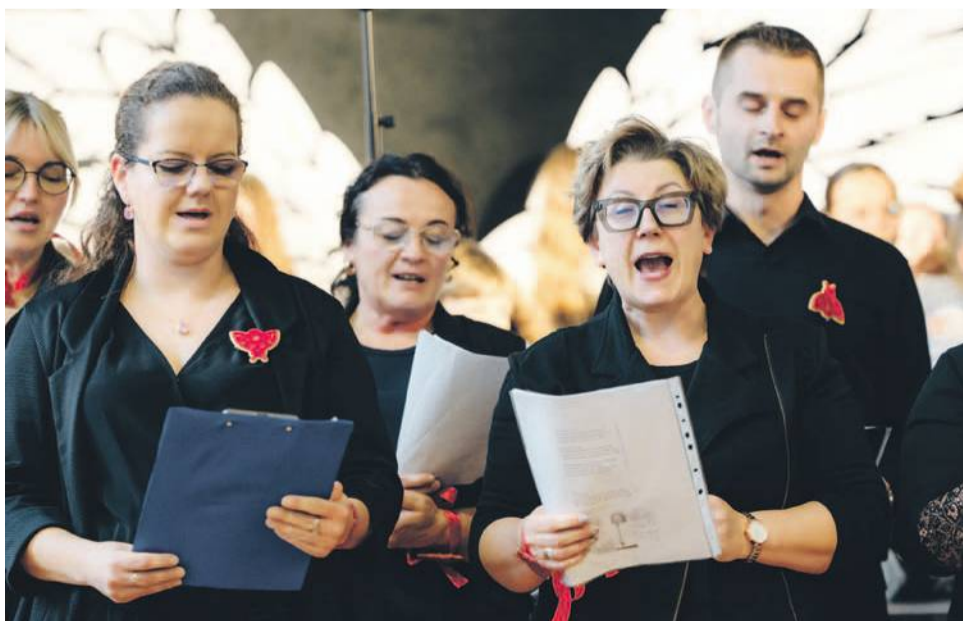
Odbył się także występ chóru, stworzonego przez rodziców i absolwentów szkoły

TEKST I FOT.: KAMIL TYSA ktysa@gazeta.olawa.pl