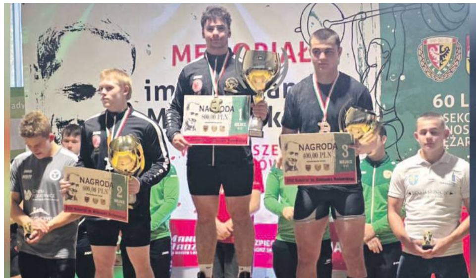
Podium chłopców do lat 17