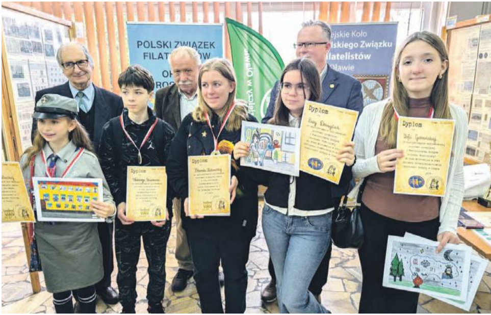
Dyplomy dla najmłodszych są najcenniejsze