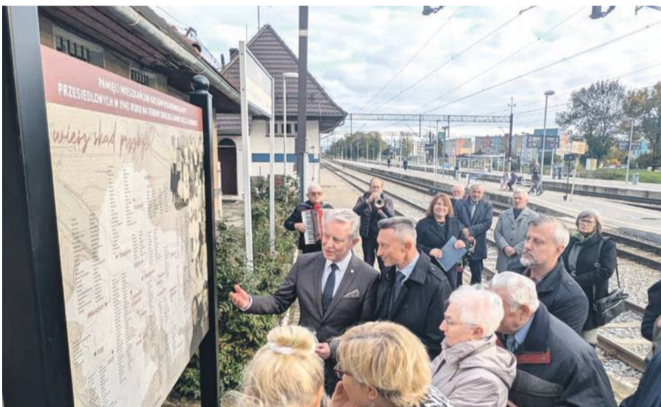
Teraz każdy może sprawdzić, z jakich miejscowości na Kresach przybyli na te ziemie jego przodkowie