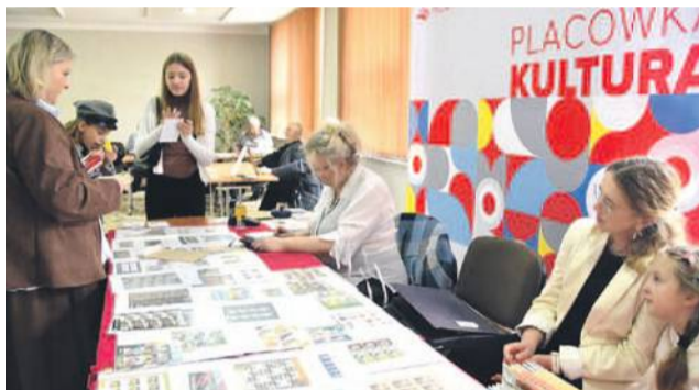
Stoisko Poczty Polskiej

Odbwała się ona w dniach 16-18 w Centrum Sztuki w Oławie - Ośrodku Kultury przy ul. 11 Listopada 27, jako wystawa specjalistyczna III stopnia o zasięgu krajowym z udziałem wystawców zagranicznych