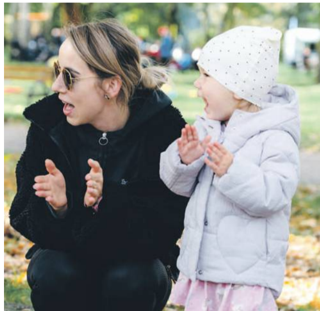
Biegających wspierali kibice

TEKST I FOT.: KAMIL TYSA ktyasa@gazeta.olawa.pl