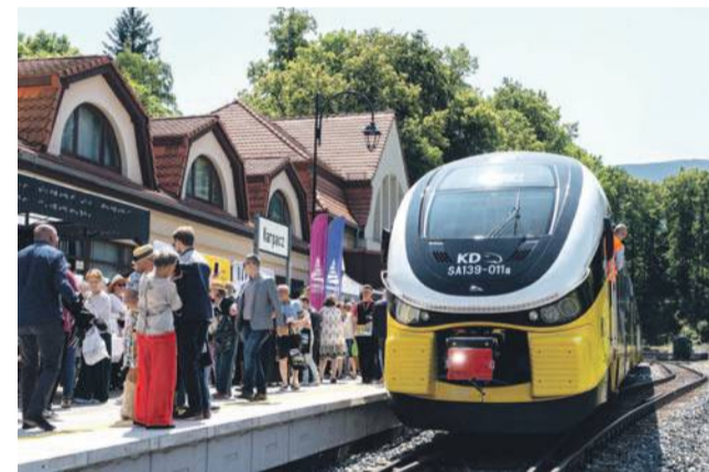
Program rewitalizacji linii kolejowych prowadzony przez Urząd Marszałkowski Województwa Dolnośląskiego jest najbardziej kompleksowym przedsięwzięciem kolejowym w historii polskich samorządów.

Niektóre miejscowości już dziś korzystają z zastępczych połączeń KD, ale pełna rewitalizacja linii kolejowych jeszcze bardziej otworzy Ziemię Kłodzką na ruch turystyczny