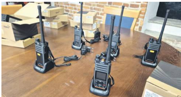
- Za około 60 000 złotych zakupiliśmy sprzęt, który będzie wspierał bezpieczeństwo naszych mieszkańców - informuje Urząd Miejski w Oławie