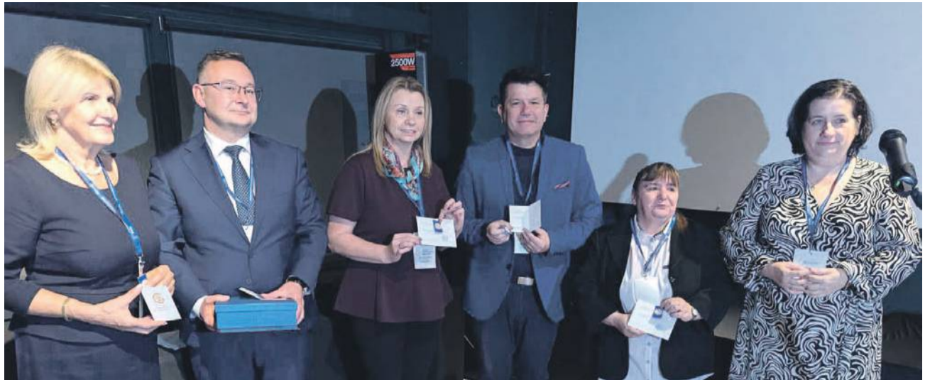
Podczas uroczystości wręczano złote i srebrne Medale za Zwycięstwo nad Cukrzycą oraz odznaczenia dla osób wspierających diabetyków