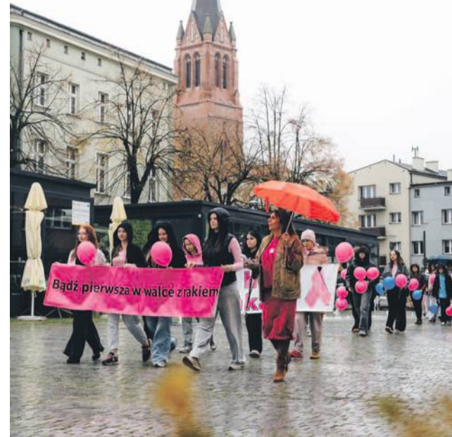
Deszczowa aura nie pokrzyżowała planów - przez Oławę przeszedł „Marsz różowej wstążki”

W programie znalazło się mnóstwo atrakcji dla całych rodzin. Uczestnicy mogli skorzystać z bezpłatnych badań słuchu w słuchobusie, odwiedzić stoisko z fantami, gdzie każdy los wygrał, a także obejrzeć pokaz dronów i symulatorów przygotowany przez MEVA Grupę Poszukiwawczo-Ratowniczą, która zaprezentowała również pokaz pierwszej pomocy.