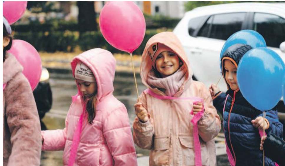
Maszerowali przypominając o profilaktyce nowotworowej