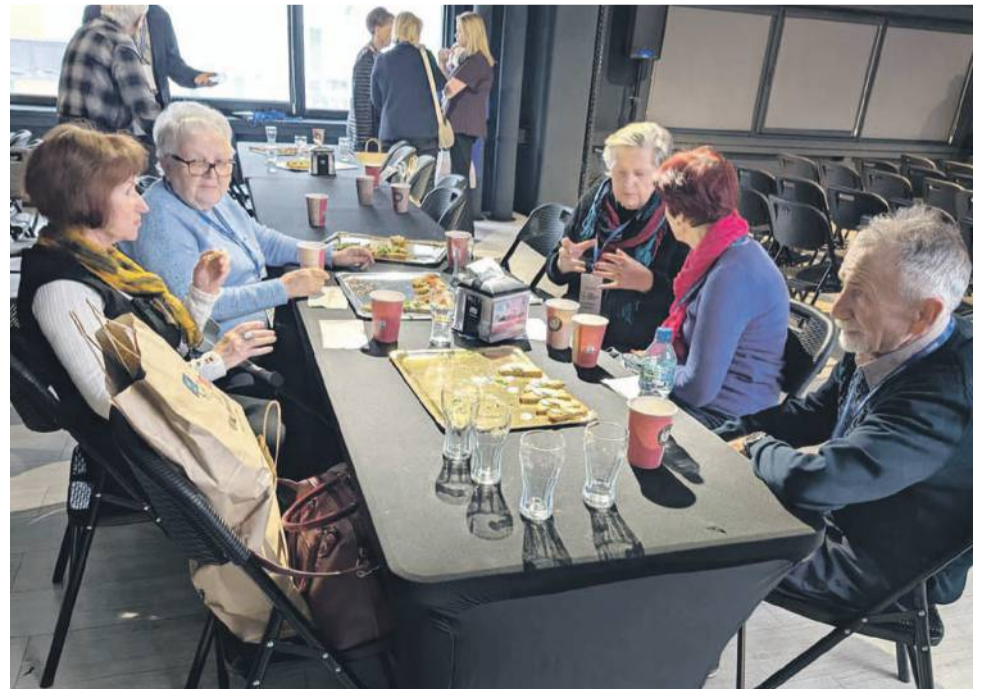
Spotkanie w Wenie było też okazją do wymiany doświadczeń