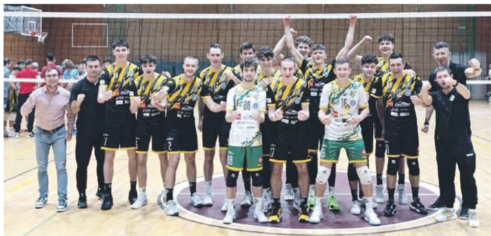
Zespół jest w świetnej formie