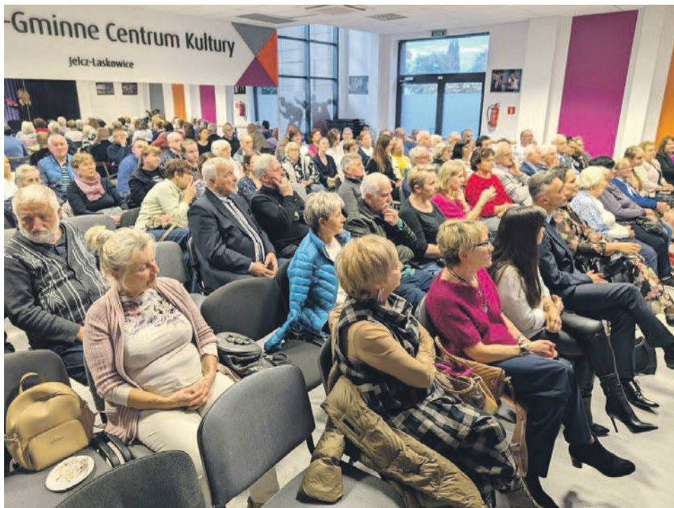
Przy pełnej sali w Miejsko-Gminnym Centrum Kultury w Jelczu-Laskowicach zaprezentowano 17 października publikację „Kresowe opowieści”