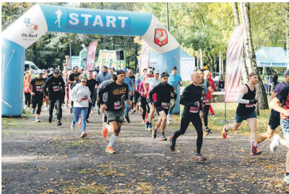
W niedzielę biegano w parku miejskim