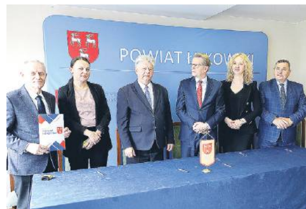
Fundusze zostaną przeznaczone na zakup sprzętu ratowniczo-gaśniczego

Po 15 tys. zł otrzymają odpowiednio strażacy z OSP w Woli Gułowskiej (gmina Adamów), Gołych Łazach (gmina Krzywda), Serokomla i w Staninie. Wszystkie cztery jednostki