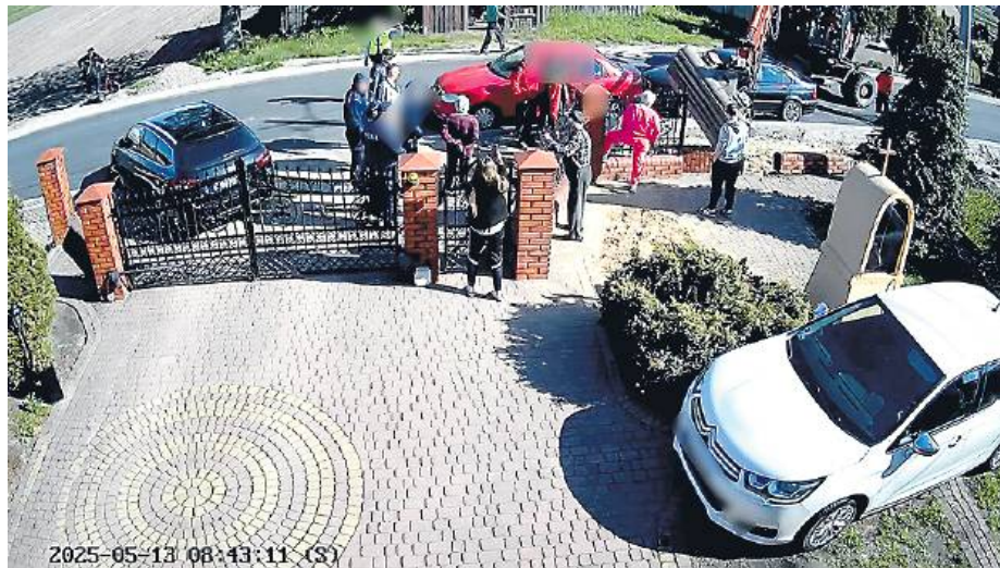
Screen z nagrania monitoringu.

Rodzina nie kryje rozczalenia. – Przez dziesiątki lat gmina nie miała z tym problemu. Droga była, ogrodzenie było. Nagle ktoś postanowił wszystko zniszczyć. I to z taką siłą, przy