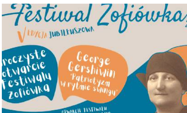
Jubileuszowa edycja Festiwalu Zofiówka - wydarzenia kulturalnego.

8 czerwca — Koncert Finałowy z muzyką filmową, utworami Moniuszki oraz wykonaniem „Carmina Burana” Carla Orffa. Tegoroczna edycja festiwalu została dofinansowana ze środków Ministra Kultury i Dziedzictwa Narodowego, pochodzących z Funduszu Promocji Kultury — państwowego funduszu celowego. ID