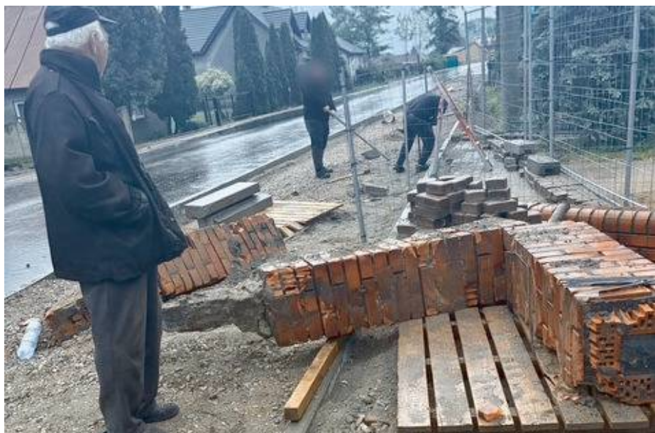
Rodzina Wierzbickich zapowiada, że będzie walczyć o sprawiedliwość.