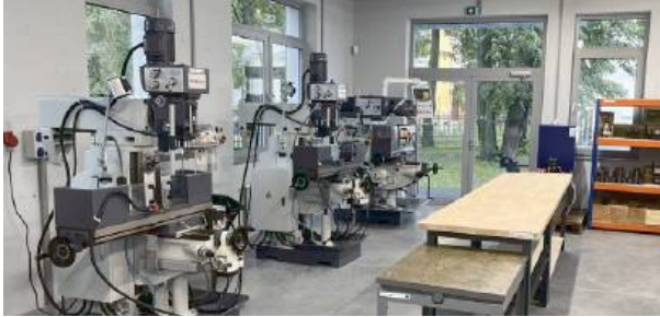
W centrum już w czerwcu ruszą pierwsze kursy.

Jeszcze pachnie świeżą farbą, jeszcze słychać echa przemówień, a już za kilka tygodni wypełni się dźwiękiem zajęć praktycznych i wykładów.