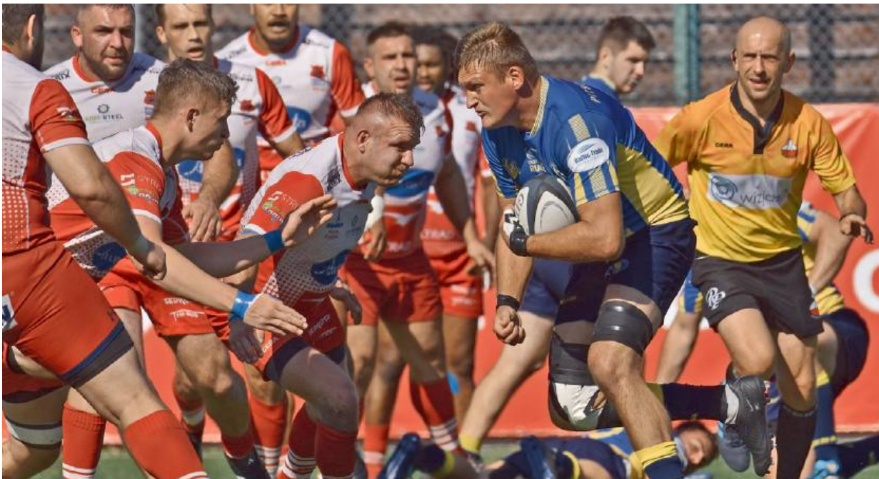
Pogon pokonała Arkę Gdynię 52:5.