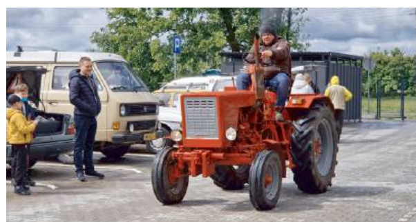
IV ROZRUCH 2025 - klasyczna motoryzacja ma się doskonale.

Jedną z największych atrakcji imprezy był konkurs na postać zlotu. Pomysłów nie brakowało — uczestnicy wykazali się nie tylko kreatywnością, ale też hu-