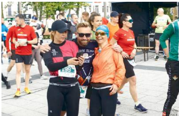
W tegorocznym biegu wystartowało aż 268 zawodników.

Atmosfera? Pełna radości, wzruszeń i pozytywnej adrenaliny. Pogoda dopisała, a doping kibiców niósł zawodników do mety jak na skrzydłach. Nad wszystkim czuwali organizatorzy, partnerzy i wolontariusze, dzięki którym wydarzenie prze-