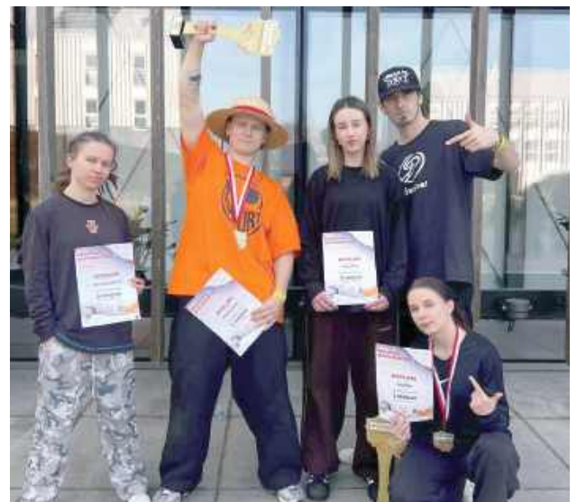
Mistrzostwa odbyły się w Łochowie