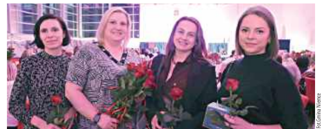
Dzień Kobiet w gminie Niemce