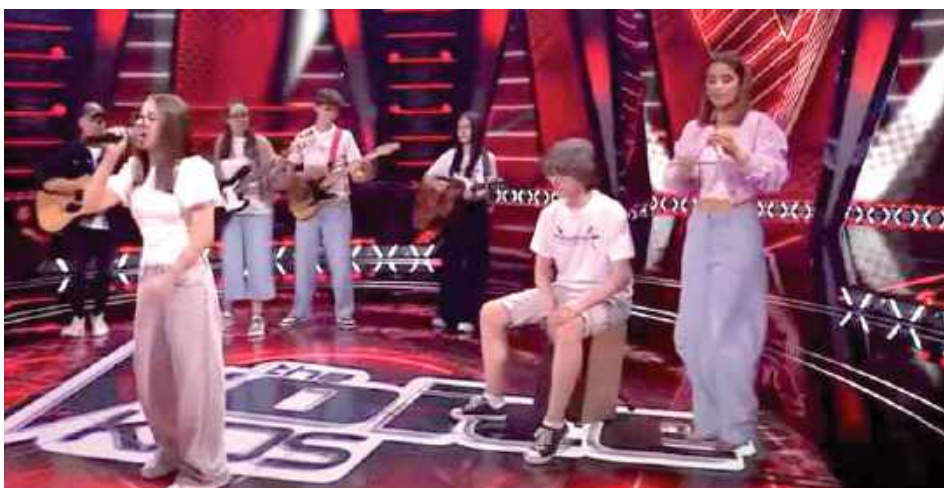
Maja wystąpiła z zespołem, który przyjechał z nią do studia

- Mi się podobał twój występ. Były momenty, kiedy miałam