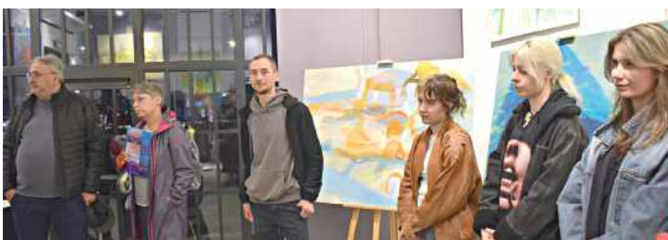
Publiczność na wystawie w PMDK