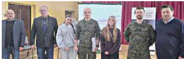
Organizatorzy jednego ze spotkań wojska z młodzieżą gminy Niemce