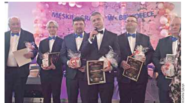
W Zawieprzycach Męskie Granie dla Pań