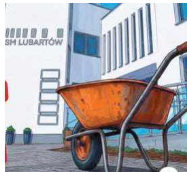
Grafika z czołówki Akademii Pomp Ciepła. Przekaz jest dość jasny...

„Teraz powinni wyciągnąć mieszkańcy czerwoną”