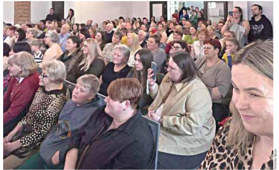
W Zawieprzycach Męskie Granie dla Pań

Program artystyczny obfitował w różnorodne formy wyrazu. Publiczność zgromadzona w Zawieprzycach miała okazję wysłuchać znanych i lubianych