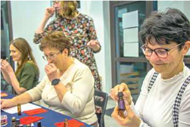
Głównym punktem programu były profesjonalne warsztaty perfumiar- skie oparte na naturalnych perfumach botanicznych

Gminny Ośrodek Kultury w Milejowie stał się miejscem wyjątkowego spotkania, które pozwoliło mieszkankom obudzić w sobie długo oczekiwaną wiosnę.