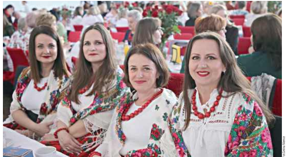
Dzień Kobiet w gminie Niemce