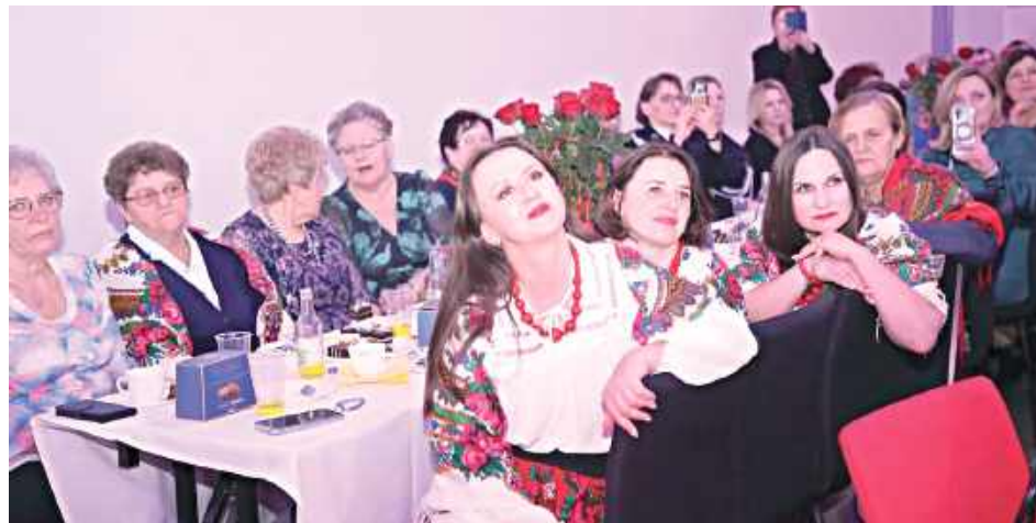
Dzień Kobiet w gminie Niemce