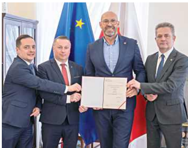
W środę, 11 marca w Warszawie sfinalizowano formalności, które pozwolą na rozpoczęcie prac budowlanych. Umowę o dofinansowanie podpisał Minister Sportu i Turystyki Jakub Rutnicki. Obecni byli również poseł Krzysztof Bojarski, burmistrz Łęcznej Leszek Włodarski oraz jego zastępca Bartłomiej Zwolakiewicz

Łączna jako jedyny samorząd w województwie lubelskim otrzymała wsparcie finansowe na budowę nowoczesnego, stałego odkrytego rolnowisko-lodowiska. Inwestycja, która powstanie przy Szkole Podstawowej nr 2, dzięki aktywnemu udziałowi mieszkańców w konsultacjach społecznych zyska charakter całoroczny.