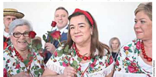
Dzień Kobiet w gminie Niemce