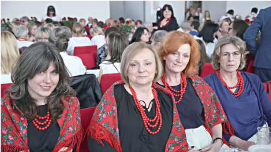
Ach, te czerwone korale

Biblioteka Publiczna w Niemcach jest miejscem wielu ważnych wydarzeń i gości wiele znakomitych osób. Tym razem okazją do spotkania była wyjątkowa – Międzynarodowy Dzień Kobiet.