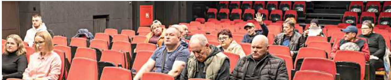
Niska frekwencja podczas drugiego spotkania konsultacyjnego w sprawie nadania praw miejskich miejscowości Milejów

29 stycznia Rada Gminy Milejów podjęła uchwałę uruchamiającą konsultacje społeczne w sprawie nadania miejscowości praw miejskich. Wbrew pojawiającym się w przestrzeni publicznej opiniom, nie była to decyzja o przekształceniu Milejowa w miasto, lecz dopiero pierwszy formalny krok w całej procedu-