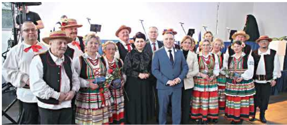
Wesoło i trochę na ludowo