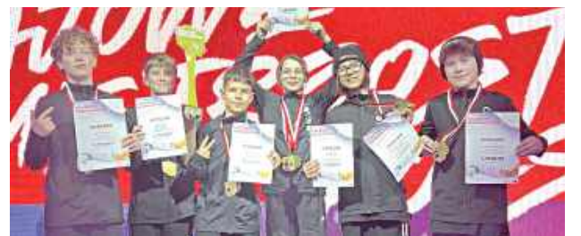
Dobry wynik zdolnej młodzieży!

W weekend 6 - 8 marca w Łochowie (w województwie mazowieckim) odbyły się Krajowe Mistrzostwa Polskiego Związku Tańca Hip Hop. Wydarzenie przyciągnęło uczestników z całej Polski, rywalizujących w takich stylach jak Hip Hop Battle, Popping, Breaking, Disco Dance czy Street Dance Show. To także czas triumfu dla młodych talentów LKS Breaking Dotsport z Jaszczowa.