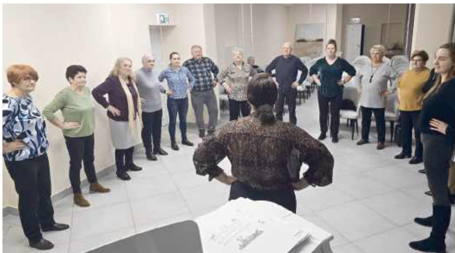
Pierwsze spotkanie chóru przyciągnęło wielu chętnych