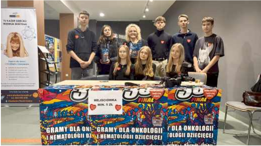
WOŚP w tym roku wspiera onkologię i hematologię dziecięcą.