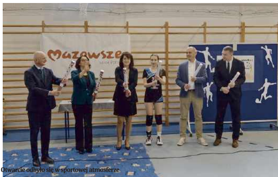
Otwarcie odbyło się w sportowej atmosferze