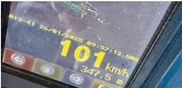
26-latek stracił prawo jazdy.

Pędził 101 km/h w terenie zabudowanym. 26-latek stracił prawo jazdy