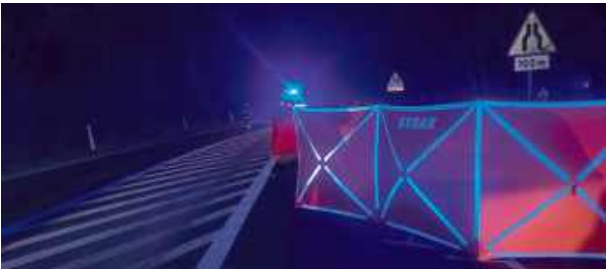
Śmiertelne potrącenie pieszego.