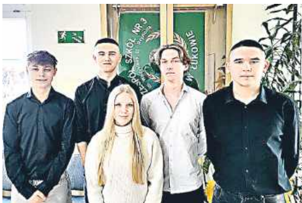
Finałowe zmagania konkursu „Europa z naszej ulicy” odbędą się w Warszawie