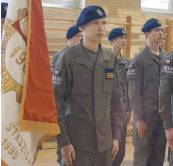
Kadecom życzymy determinacji w realizacji obranych celów.

23 stycznia w siedleckim „Elektryku” odbyło się uroczyste ślubowanie kadetów pierwszej klasy wojskowej Oddziałów Przygotowania Wojskowego III Liceum Ogólnokształcącego. Był to moment pełen emocji, podniosłej atmosfery i dumy, zarówno dla młodych adeptów wojskowości, jak i ich bliskich.