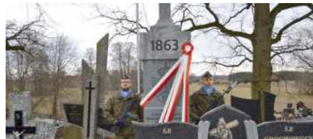
Wyraz szacunku i pamięci dla bohaterów Powstania Styczniowego.

Uroczystość rozpoczęła się Mszą Świętą w Kościele Rzymskokatolickim św. Jana Chrzcicie-