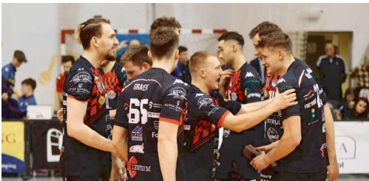
ID Zgrany zespół to klucz do sukcesu! KPS Siedlce idzie jak burza!

Drużyna z Siedlec cieszy się rosnącym zainteresowaniem wśród kibiców, którzy gromadzą się na wyjazdowych spotkaniach.