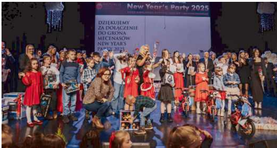
Gala połączyła sztukę z chęcią niesienia pomocy.

Jednym z wyjątkowych punktów wieczoru była licytacja