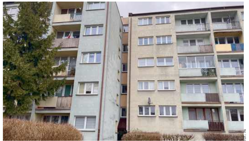
Do tragedii doszło w jednym z mieszkań przy ul. Sobieskiego.

28 stycznia Sąd Rejonowy w Siedlcach podjął decyzję, że Adam Cz. spędzi najbliższe trzy miesiące w areszcie tymczasowo-