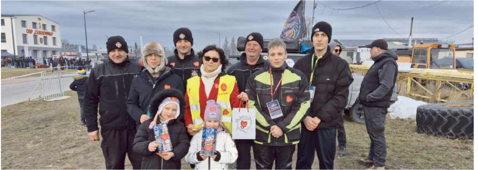
Zebrane środki trafiły na konto Wielkiej Orkiestry Świątecznej Pomocy

26 stycznia w Zespole Szkół Nr 1 im. Krzysztofa Kamila Baczyńskiego w Sokołowie Podlaskim odbył się 33 powiatowy finał Wielkiej Orkiestry Świątecznej Pomocy.