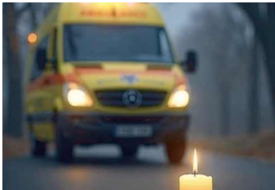
Tragedia wstrząsnęła całym środowiskiem medycznym.