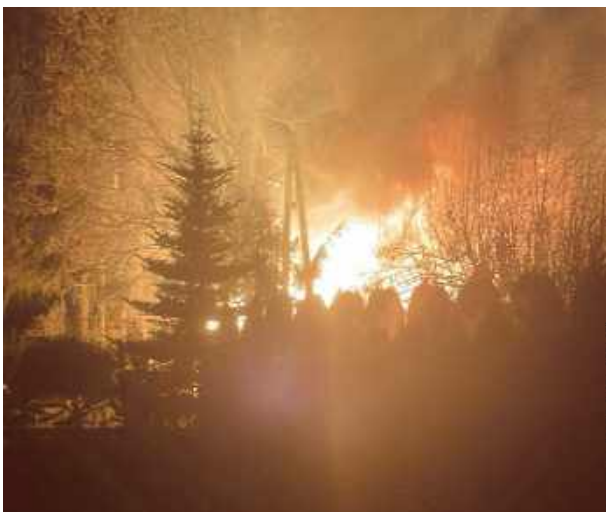
Właściciel wycenił straty na około 100 tys. zł.

Zdarzenie miało miejsce na niezamieszkałej posesji, gdzie w wyniku pożaru doszczętnie spłonął budynek gospodarczy. Okoliczności zdarzenia wyjaśniają funkcjonariusze policji. RED