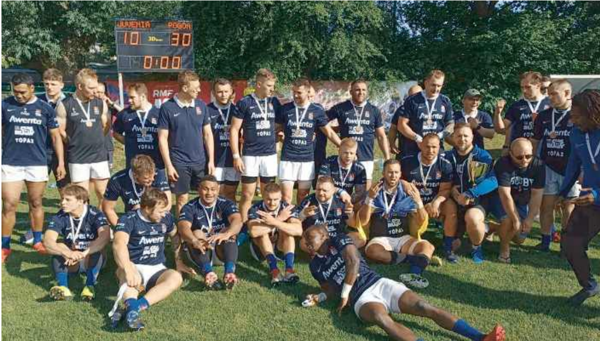
Pogon Siedlce z brązowymi medalami Mistrzostw Polski

Rok 2024 był dla siedleckich rugbistów udany. Seniorzy Pogoni wywalczyli brązowe medale Ekstraligi Rugby, a po rundzie jesiennej zajmują pierwsze miejsce w tabeli. Weterani WFS Siedlce zdobyli srebrne medale podczas rozgrywanych w Siedlcach XIV Mistrzostw Polski Weteranów. Miejski Klub Rugby został brązowym medalistą Mistrzostw Polski Dzieci i Młodzieży, a mini żacy tego klubu zdobyli Mistrzostwo Polski.