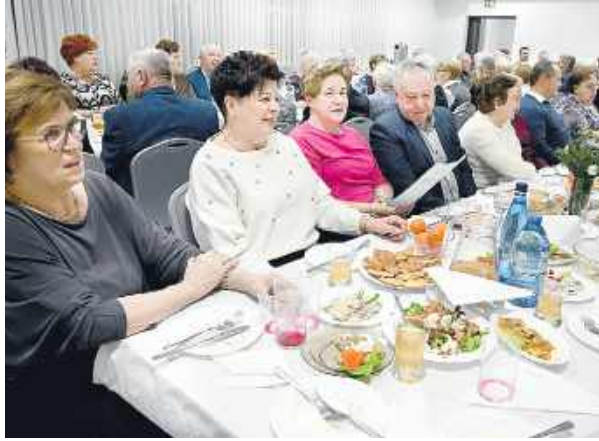
Dzięki "trzecim miejscom" mieszkańcy mogą być ze sobą.