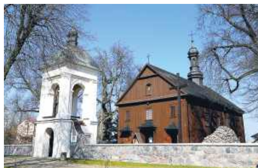
Kościół Świętych Apostołów Piotra i Pawła w Wodyniach.