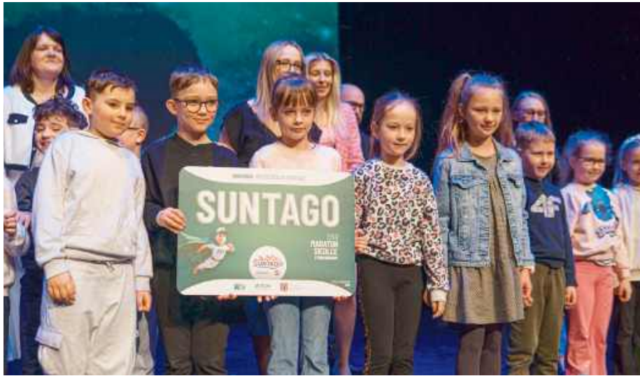
Zwienieczeniem wydarzenia było rozstrzygnięcie konkursu „Dzień z życia Segregiusza”.

26 marca w Centrum Kultury i Sztuki im. A. Meżeryckiego – Scenie Teatralnej Miasta Siedlce już po raz trzeci odbyło się spotkanie profilaktyczne pod hasłem „Spotkajmy się w teatrze – Jesteśmy sobie wzajemnie potrzebni”. Wydarzenie zostało zorganizowane przez Zespół Szkół Publicznych im. Henryka