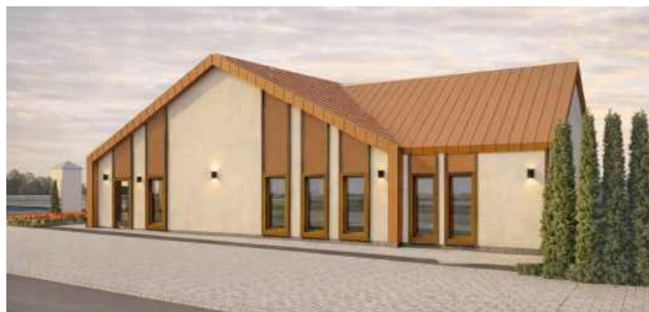
Tak będzie wyglądać nowa placówka.

Projekt wpisuje się również w szerszy program „Aktywny Maluch 2022–2029”. Dzięki wartyj umowie z Wojewodą Ma-