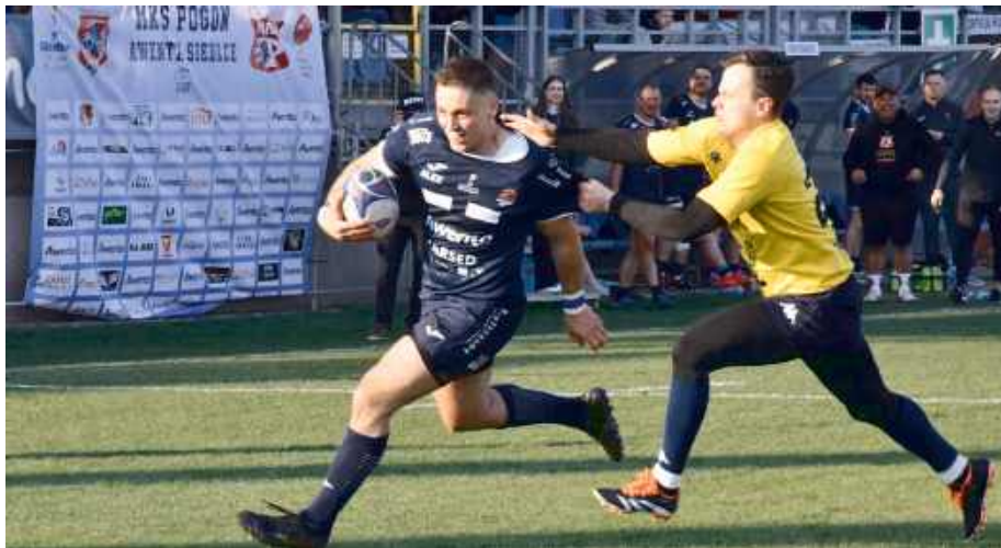
Już od pierwszych minut gospodarze narzucili swoje warunki gry.

Na podstawie przebiegu pierwszej części spotkania wynika, że była to jednostronna