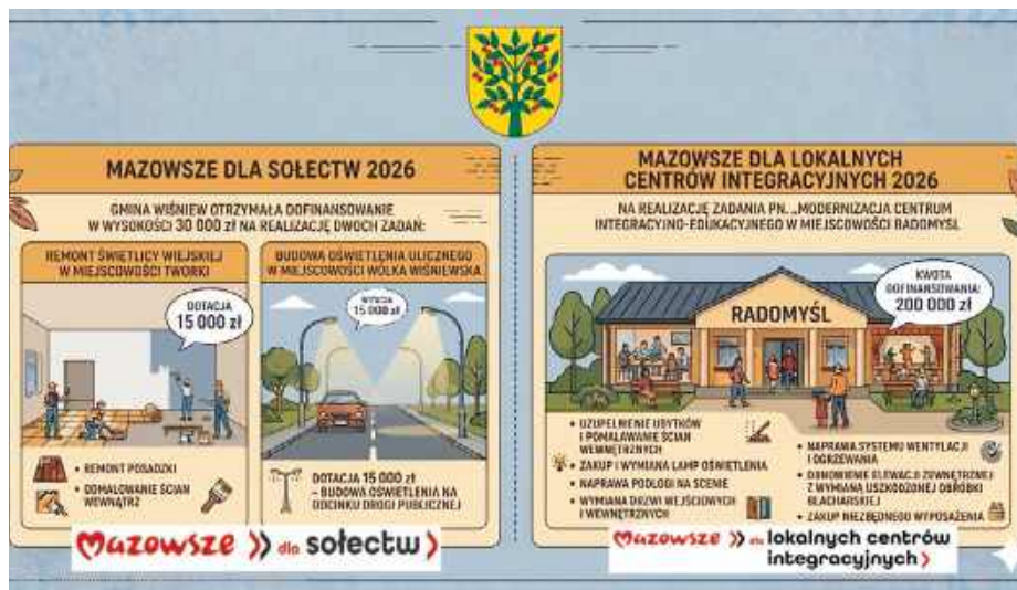
Łączna kwota pozyskanego dofinansowania to 230 tys. zł.

Gmina Wiśniew znalazła się w gronie samorządów, które z powodzeniem sięgnęły po zewnętrzne finansowanie, udowadniając, że nawet w mniej-