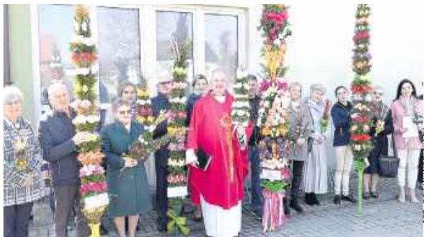
Pomimo upływu lat piękno tradycji wciąż przyciąga i jednoczy.