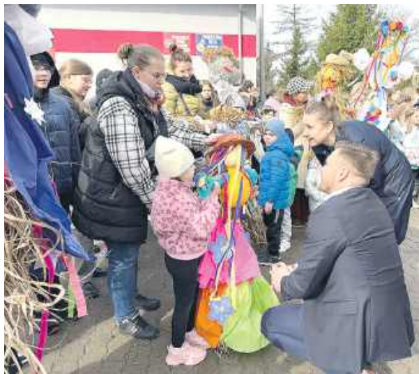
Konkurs na najpiękniejszą Marzannę wywołał żywy odzew.

W niedzielę, 26 marca, miasto Mordy wybuchło kolorami, a szałoch wczesnowiosennych ulic ustąpiła miejsca setkom barwnych palm, które stały się symbolem jedności i radosnego oczekiwania. Uroczystości rozpoczęły się przed miejscowym kościołem parafialnym, gdzie zgromadziły się tłumy mieszkańców trzymających w dłoniach misternie wykonane rękodzieła – od niewielkich palm po kilkumetrowe, bogato zdobione konstrukcje. Niesamowicie