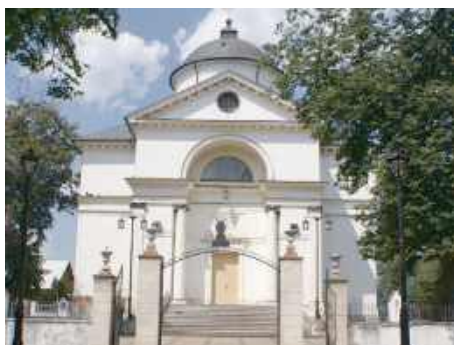
Kościół św. Jadwigi w Mokobodach

Wraz ze zbliżającymi się Świętami Wielkanocnymi oczy i serca mieszkańców Powiatu Siedleckiego kierują się ku parafialnym świątyniom. To właśnie tam - w murach, które od pokoleń są świadkami modlitwy, nadziei i wspólnoty - rozbrzmiewa radosne „Alleluja”. Wielkanoc staje się nie tylko czasem liturgii, lecz także okazją do odkrywania duchowego i historycznego dziedzictwa regionu. Wyruszamy więc w symboliczną podróż po trzech wyjątkowych kościołach, które pozostają