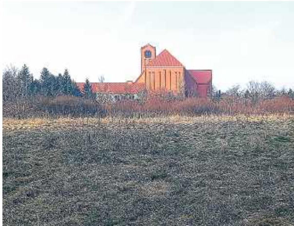
To tu mają stanąć bloki.

Mieszkańcy bloków przy ul. Bieszczadzkiej w Siedlcach mówią, że żyją w pięknej okolicy o własnym mikroklimacie, gdzie nie jest trudno zobaczyć jeże. – Kiedy w 2009 r. kupowaliśmy z mężem mieszkanie, w spółdzielni mieszkaniowej usłyszeliśmy, że teren bezpośrednio przed naszym blokiem jest rekreacyjny. Było tam boisko do koszykówki, piłki nożnej i stół pingpongowy. Jak nam mówiono, jeśli kiedyś zostaną wybudowane jakieś budynki, to domy za tym terenem rekreacyjnym. Minęły 3 lata, a za naszymi plecami powstał plan, o którym w ogóle nie widzieliśmy – opowiada jedna z kobiet. – A w międzyczasie tereny rekreacyjne zostały sprzedane przez SSM. Potem, kiedy trwała pandemia, deweloper wszedł