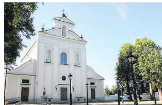
Sanktuarium Krzyża Świętego w Skórcu.

żywą kroniką wiary lokalnej społeczności.