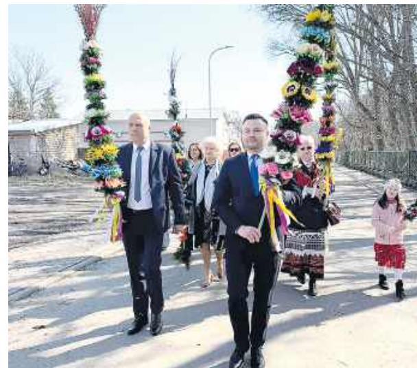
W Niedzielę Palmową burmistrz maszerował z mieszkańcami.

W uroczystym korowodzie, ramię w ramię z włodarzami i mieszkańcami miasta, maszerowały delegacje prężnie działających kół gospodyń z okolicznych miejscowości, które uświetniły procesję swoimi pięknymi palmami. Wśród uczestników dumnie prezentowały się reprezentantki KGW: