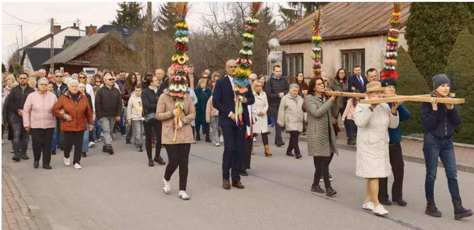
Dopełnieniem uroczystości była Droga Krzyżowa.