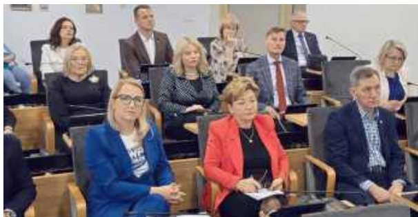
Zdania radnych w tej sprawie były podzielone.

Jak podczas dyskusji przypomniała radna, obecnie miasto zapewnia bezdomnym zwierzętom miejsce w schronisku we wsi Małe Boże w powiecie białobrzeskim na Mazowszu (ponad 120 km od Siedlec). Ratusz pod-