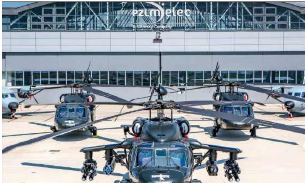
Firma przedstawiała swoje stanowisko.

Polskie Zakłady Lotnicze w Mielcu nie otrzymały zlecenia z programu SAFE. Sprawa ta stała się przyczyną poważnej dyskusji, lęku o miejsca pracy oraz podejrzeń o polityczne przyczyny takiego obrotu sprawy. Wiele osób, także związanych ze środowiskiem firmy sugeruje, że trudne relacje między rządem a Stanami Zjednoczonymi mogą być przyczyną pominięcia mieleckich zakładów w planach zbrojeniowych