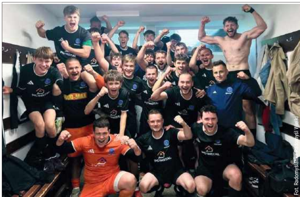
Druga drużyna Radomyślanki wywalczyła awans do A-klasy.