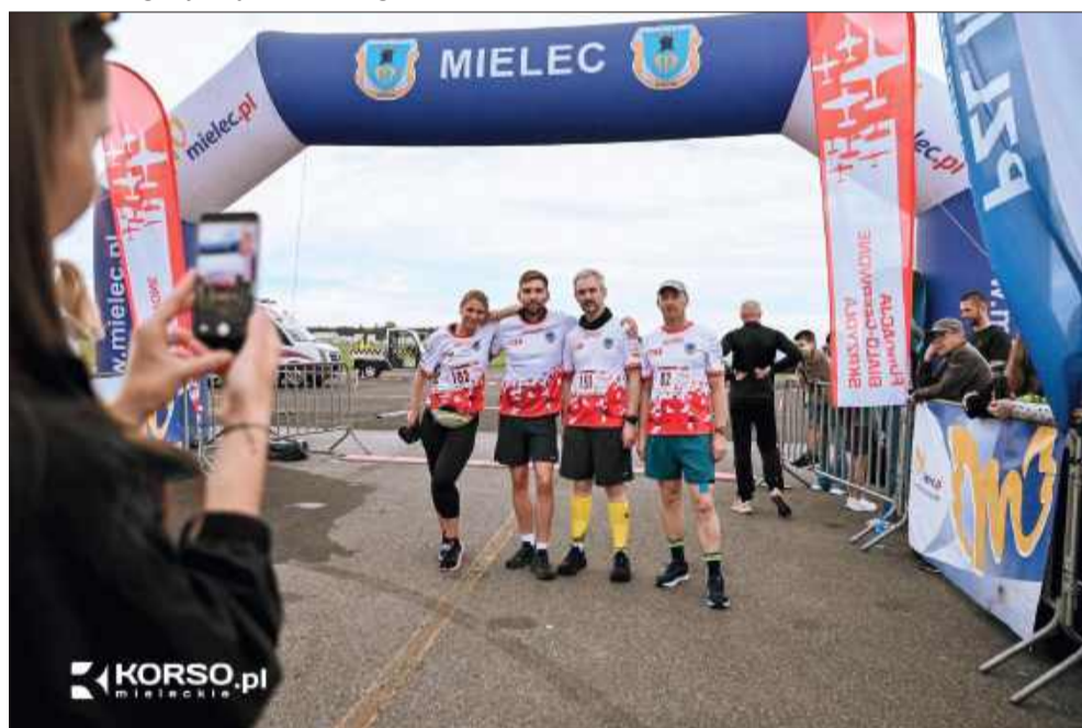
Pamiątkowe zdjęcia muszą być.