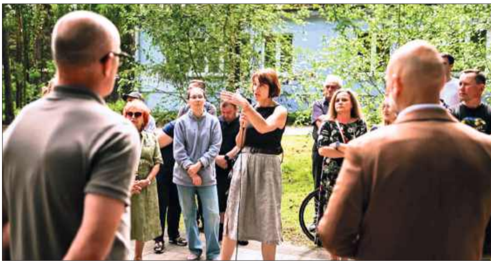
Władze Mielca nie kryją zadowolenia z dotychczasowego zaangażowania lokalnej społeczności

Park Kazimierza Wielkiego od lat zajmuje ważne miejsce na mapie Mielca, będąc przestrzenią rekreacji. Niestety, w ostatnich latach jego unikalny charakter został brutalnie zweryfikowany przez naturę. Gwałtowne nawałnice i wichury, które przeszły przez miasto najpierw w 2024, a następnie w 2025 roku, dokonały ogromnych zniszczeń w tamtejszym drzewostanie. W obliczu konieczności odnowienia tego terenu władze Mielca podjęły decyzję: to sami mieszkańcy wskażą, jak ma wyglądać odmieniony park.