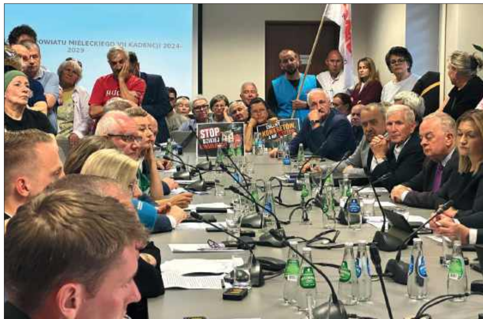
Na sali znaleźli się nie tylko radni, ale też mieszkańcy protestujący przeciw konsolidacji szpitala.