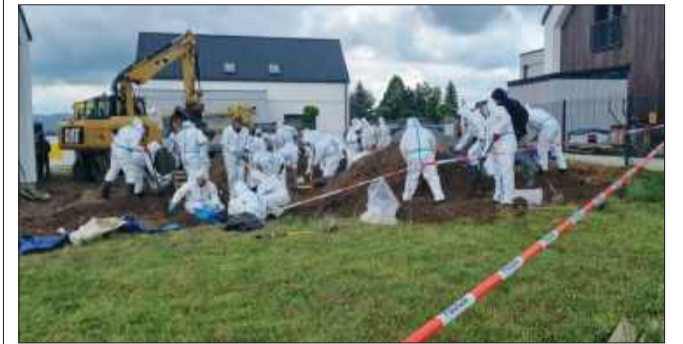
Na miejscu pracowało wielu specjalistów.

Rzeszowscy policjanci zakończyli trwające od ubiegłego tygodnia czynności procesowe na terenie prywatnej posesji w Lutoryżu. Przez cztery dni kilkuset funkcjonariuszy skrupulatnie przeszukiwało i zabezpieczało miejsce, w którym zakopane były ludzkie płody oraz odpady medyczne.