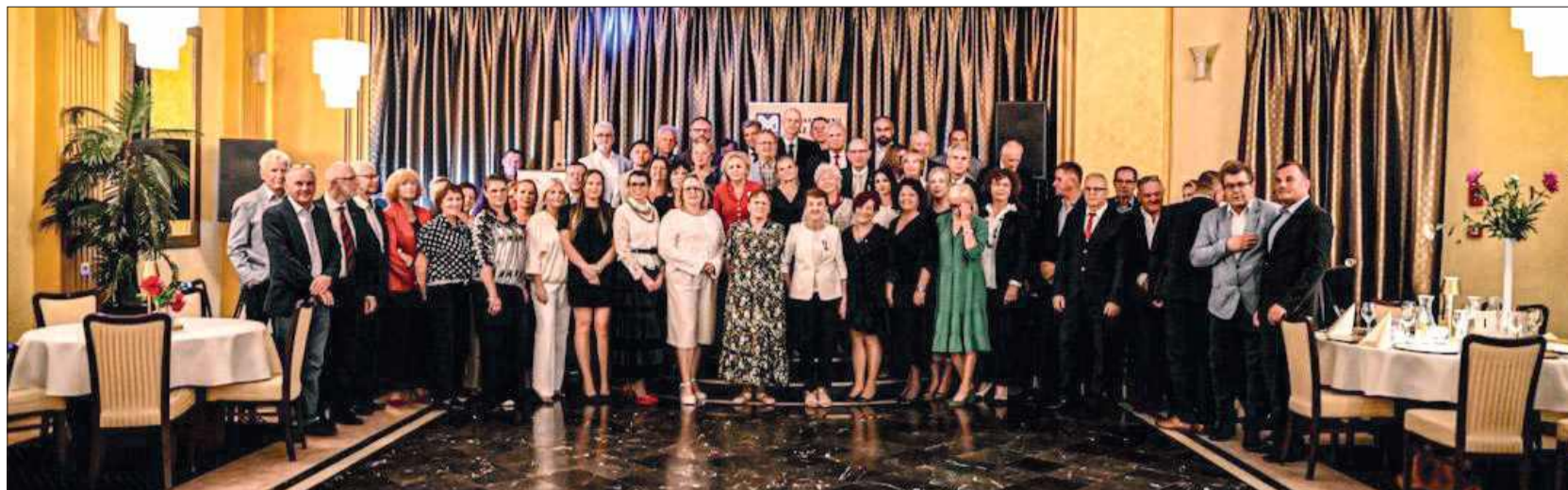
Członkowie stowarzyszenia „Nasz Mielec” i zaproszeni goście.