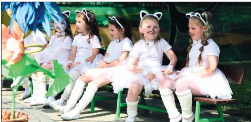
Małe „kotki” w przedszkola nr 2.