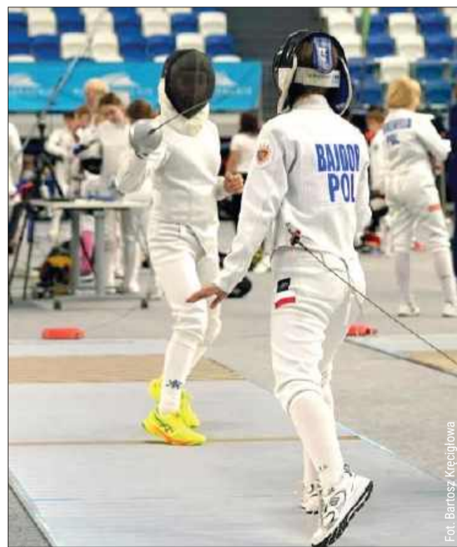
W Mielcu odbyły się Mistrzostwa Polski w szpadzie

Środowisko szermierki nie kryje, że mieleckie mistrzostwa to ważna pozycja w kalendarzu sezonu. Trenerzy doceniają zarówno organizację, jak i rangę samego wydarzenia. bk