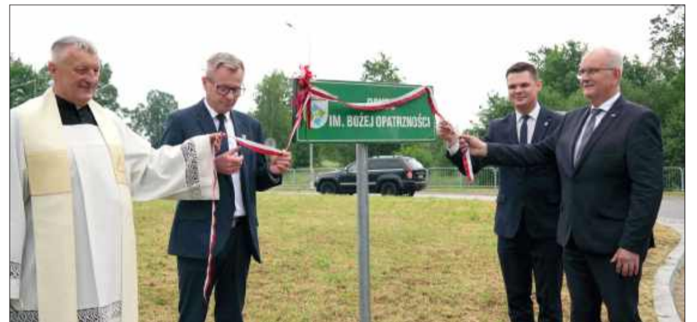
Rondo już z imieniem Bożej Opatrzności.