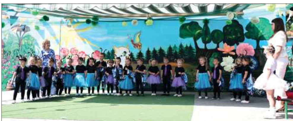
Przedszkole zyskało też nowy mural przedstawiający koty z bajki: Filemona i Bonifacego.