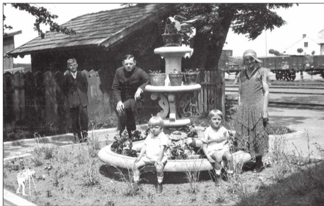
Ten kwiatnik przetrwał przez dziesięciolecia.

Mielecki dworzec kolejowy przejdzie całkowitą rewolucję – spółka PKP S.A. rozstrzygnęła wart ponad 9 milionów złotych przetarg na budowę nowego, dwukondygnacyjnego obiektu. Zanim jednak stary gmach zrównają z ziemią buldożery, mieszkańcy apelują o ocalenie stuletniego, zabytkowego kwiatnika. To jedyny element dawnego otoczenia stacji, który przetrwał próbę czasu i przypomina o przedwojennej historii miasta.