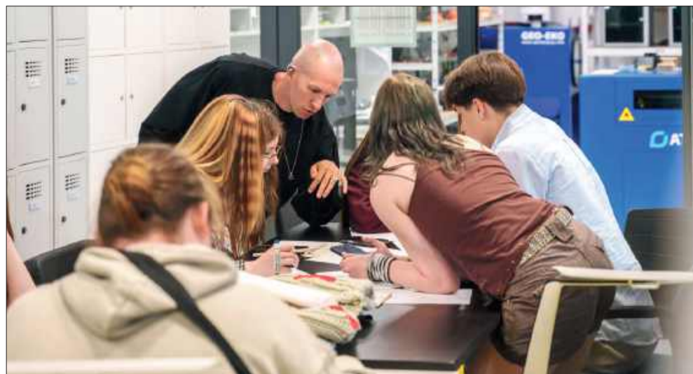
Projektant udziela wskazówek.

Efekty wielomiesięcznej pracy zostaną zaprezentowane podczas Podkarpackiego Festiwalu Nauki i Innowacji, który odbędzie się w dniach 7-8 października 2026 roku w centrum Zen.com Expo w Jasionce. Wystawa w Strefie Nowej Sztuki będzie okazją do zaprezentowania szerokiej publiczności projektów łączących modę, sztukę i nowoczesne technologie.