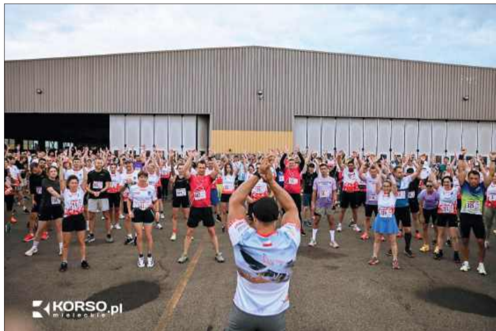
Ponad 500 biegaczy wzięło udział w biegu.