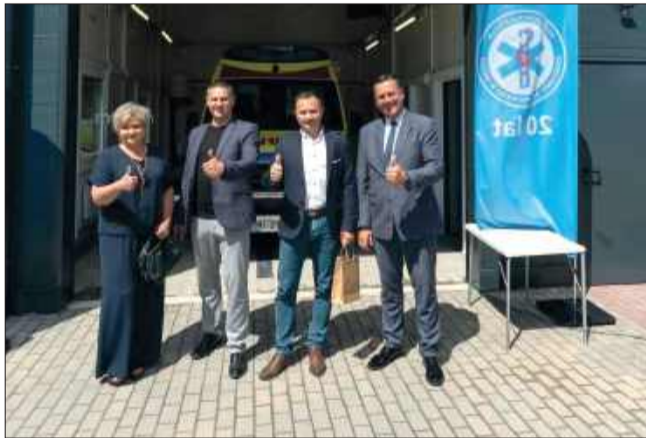
Ratownicy zyskali nowoczesne zaplecze.

W Przecławiu odbyło się uroczyste otwarcie i przekazanie do użytku nowego garażu dla ambulansu Podkarpackiej Stacji Pogotowia Ratunkowego.