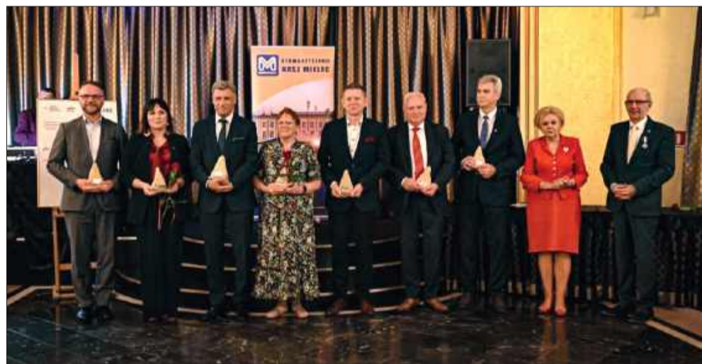
W 1994 roku grupa zaangażowanych mieszkańców założyła Komitet Wyborczy „Nasz Mielec”. Efekty - mamy do dziś.