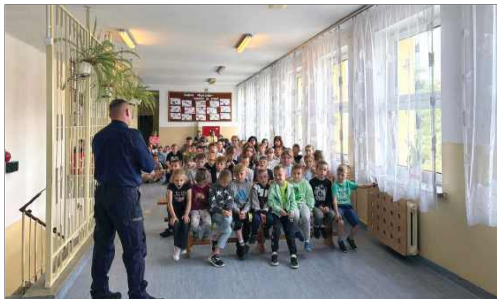
Edukacja najmłodszych na terenie całego powiatu

Mundurowi przypominają, że bezpieczne wakacje w dużej mierze zależą od nas samych. W związku z tym policjanci zwracają się z apelem także do rodziców oraz opiekunów, prosząc ich o wzmoczoną czujność i regularne rozmowy z podopiecznymi o zasadach bezpiecznego spędzania wolnego czasu. MW