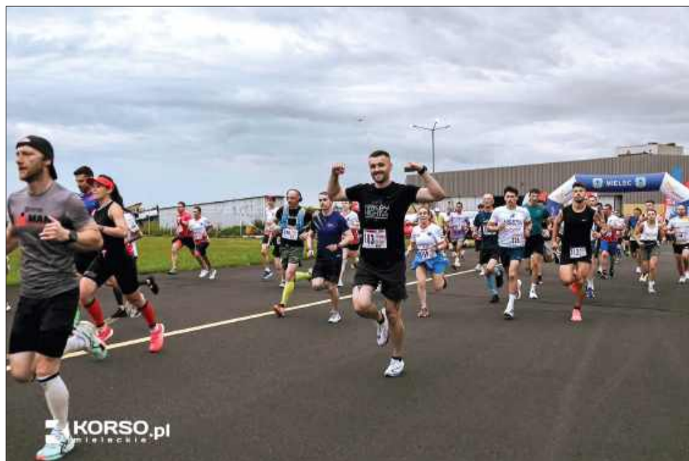
To było świetne doświadczenie.