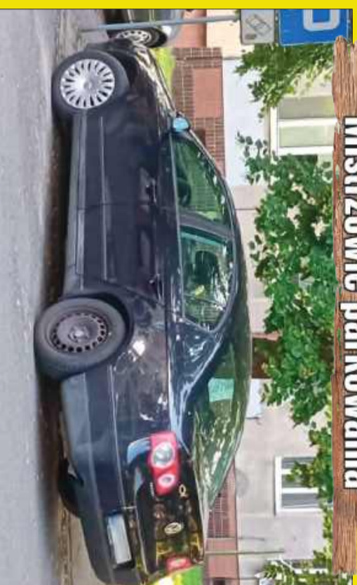
Mistrz parkuje... tuż obok parkingu!