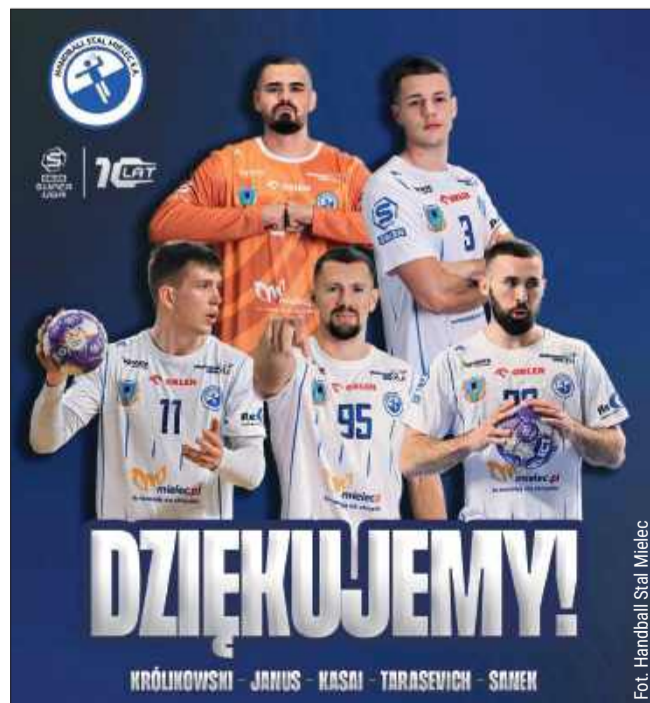
Pięciu szczypiorników pożegnało się z Handball Stalą Mielec.