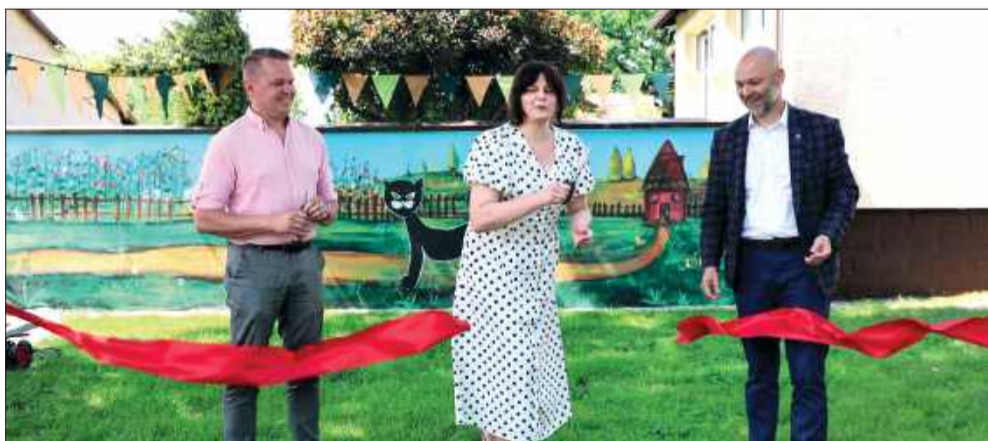
Uroczyste przecięcie wstęgi.