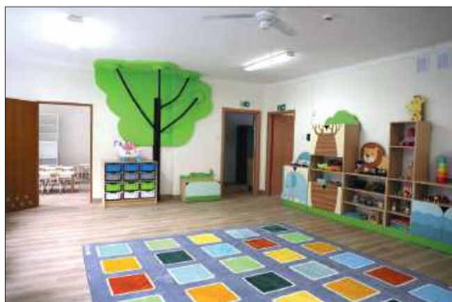
Wygląd sali w żłobku

Modernizacja objęła zarówno rozbudowę części użytkowej, jak i kompleksowe unowocześnienie infrastruktury technicznej. Jedną z najważniejszych zmian było zagospodarowanie dwóch tar-