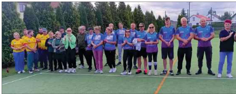
Uczestnicy nie tylko rywalizowali, ale przede wszystkim świetnie się bawili!