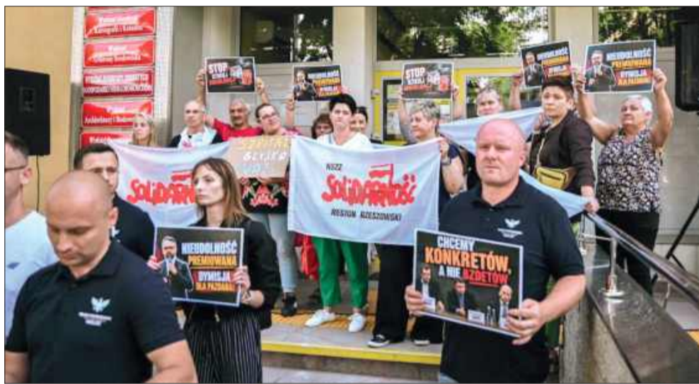
Pikieta pod drzwiami starostwa.