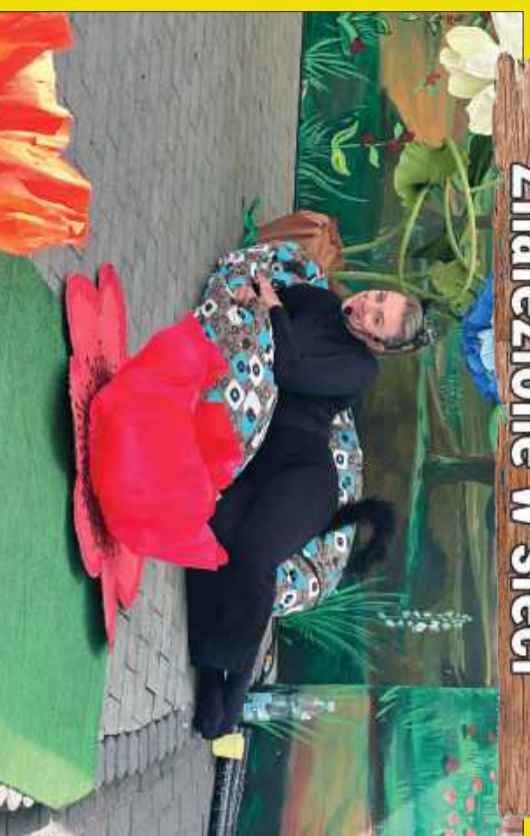
W każdym z nas jest coś z Bonifacego.