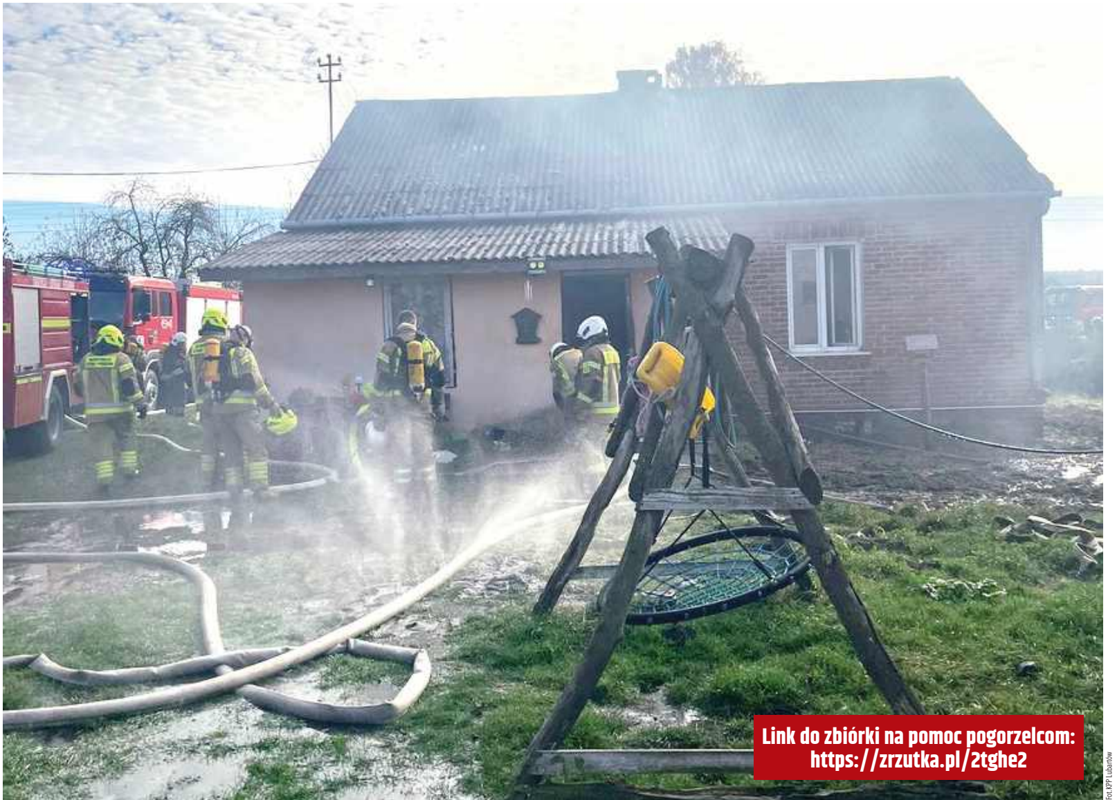
Pożar wybuchł 1 listopada