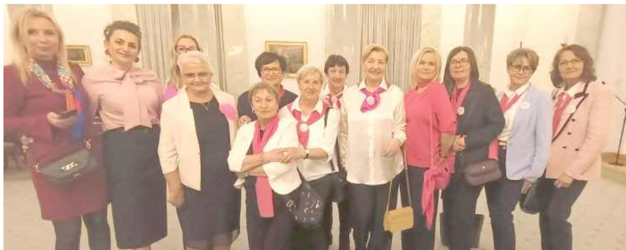
16 października przedstawicielki stowarzyszenia uczestniczyły w spotkaniu w Pałacu Prezydenckim z małżonką prezydenta RP, Martą Nawrocką

POWIAT OPOLSKI: Październik to miesiąc, w którym szczególnie głośno mówi się o profilaktyce raka piersi. To czas, gdy różowy kolor pojawia się w przestrzeni publicznej, przypominając kobietom, jak ważne jest regularne samobadanie i kontrola zdrowia. Ale dla Amazonek z Poniatowej ten temat nie kończy się wraz z końcem miesiąca - one działają przez cały rok, wspierając, edukując i motywując inne kobiety do troski o siebie.