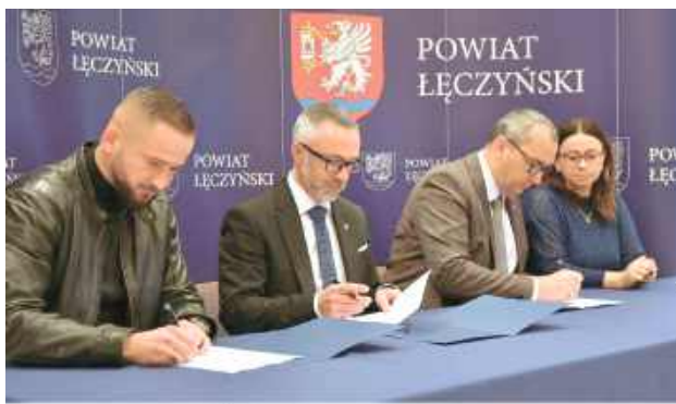
Umowa na Remont magazynów przeznaczonych do ochrony ludności i obrony cywilnej

W Starostwie Powiatowym w Łęcznej podpisano umowę na realizację zadania pod nazwą „Remont magazynów przeznaczonych do ochrony ludności i obrony cywilnej”. Inwestycja o wartości 479 700 zł ma zostać wykonana w ciągu 40 dni i znacząco poprawi warunki techniczne obiektów służących bezpieczeństwu mieszkańców powiatu.