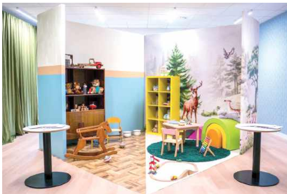
Żłobek z Łęcznej przykładem dla innych samorządów