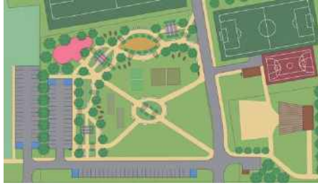
Miało być rekreacyjnie i sportowo, może być komercyjnie

W odpowiedzi na wniosek gminy kierownictwo KOWR odpowiedziało, że „KOWR w każdym przypadku ze zrozumieniem podchodzi do planowanych przez samorządy inwestycji infrastrukturalnych, realizowanych na gruntach Zasobu Własności Rolnej Skarbu