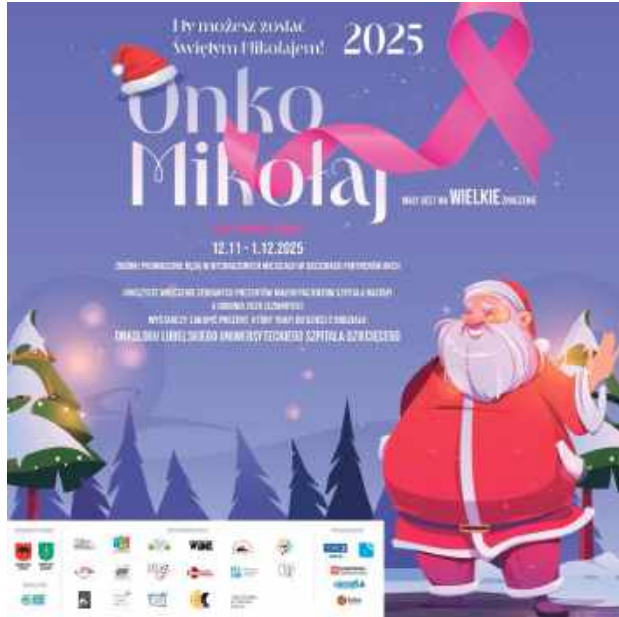
Akcja „Onko Mikołaj”

W tym roku, podobnie jak w poprzednich edycjach, organizatorzy zbierają nowe rzeczy - m.in. zabawki edu-