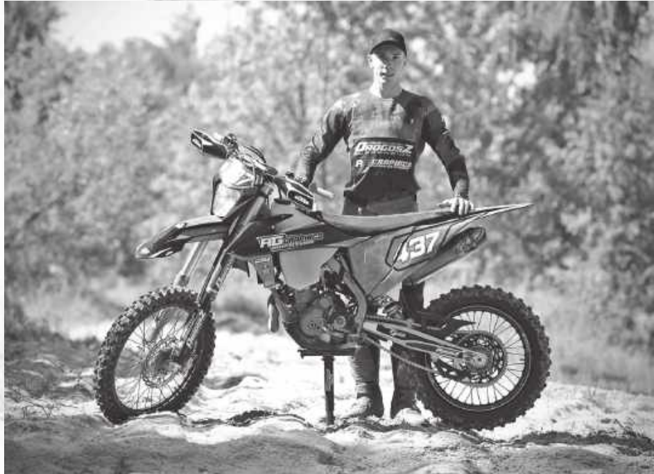
Zanim odkrył swoją pasję do motocykli, grał w piłkę nożną w drużynie Orły Kazimierz. Uczył się w szkołach w Bochojnie i Kazimierzu Dolnym, a jego miłość do sportu przerodziła się z boiska w tor

W barwach AMK Gorce Nowy Targ Piskorek rozwijał się jako zawodnik w trialu, osiągając kolejne sukcesy na krajowych i międzynarodowych torach. Równocześnie próbo-