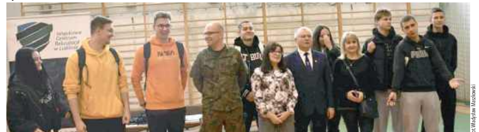
Pomysł utworzenia oddziału spotkał się z ciepłym przyjęciem