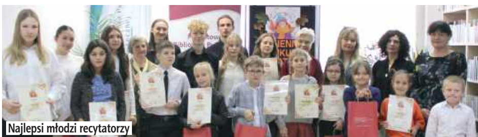
Najlepsi młodzi recytatorzy

Poznaliśmy laureatów 29. Jesiennego Konkursu Recytatorskiego „Wspomnienia – pamiętki duszy” Jury wyłoniło czterech uczestników, którzy będą reprezentować powiat łęczyński na etapie wojewódzkim.