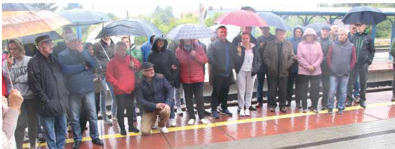
Od tego się zaczęło. Pierwszy protest przeciw lokalizacji zakładu w Annoborze, wrzesień 2022 r.

W końcu w czerwcu wójt wydał decyzję o odmowie wydania decyzji środowiskowej dla Steny. Według uzasadnienia lokalizacja zakładu Steny w planowanym miejscu jest sprzeczna z miejscowym planem zagospodarowania przestrzennego. Dla działek, na których ma powstać zakład firmy Stena Recycling sp. z o.o.,