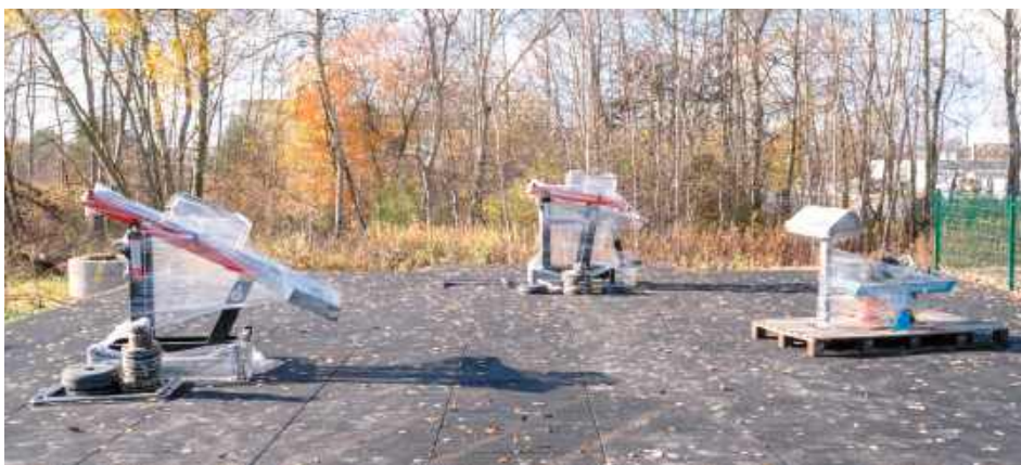
Elementy terenowej siłowni za Orlikiem na osiedlu Bobrowniki

Całkowity koszt przedsięwzięcia przekracza 1 mln zł, z czego połowę środków samo-