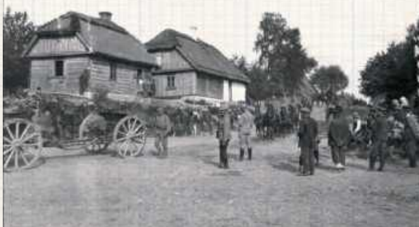
Wojska austro-węgierskie w Dęblinie. W listopadzie 1918 kapitulowały łatwo i chętnie. Krótki opór stawiali Niemcy. Twierdzę austriacki generał poddał bez jednego wystrzału, m.in. także pod wpływem lipnego, zainscenizowanego przez Polaków „telefonu z dowództwa”. Dęblin stał się bazą dalszych operacji na północnej Lubelszczyźnie

bezpośrednio władzom wojskowym, rezydującym w Białej Podlaskiej. O ile w mniejszych, położonych na terenie dawnej Kongresówki ośrodkach wśród Niemców dominowały tendencje kapitulancie, o tyle zaplecze frontowe było gotowe bić się do upadłego.