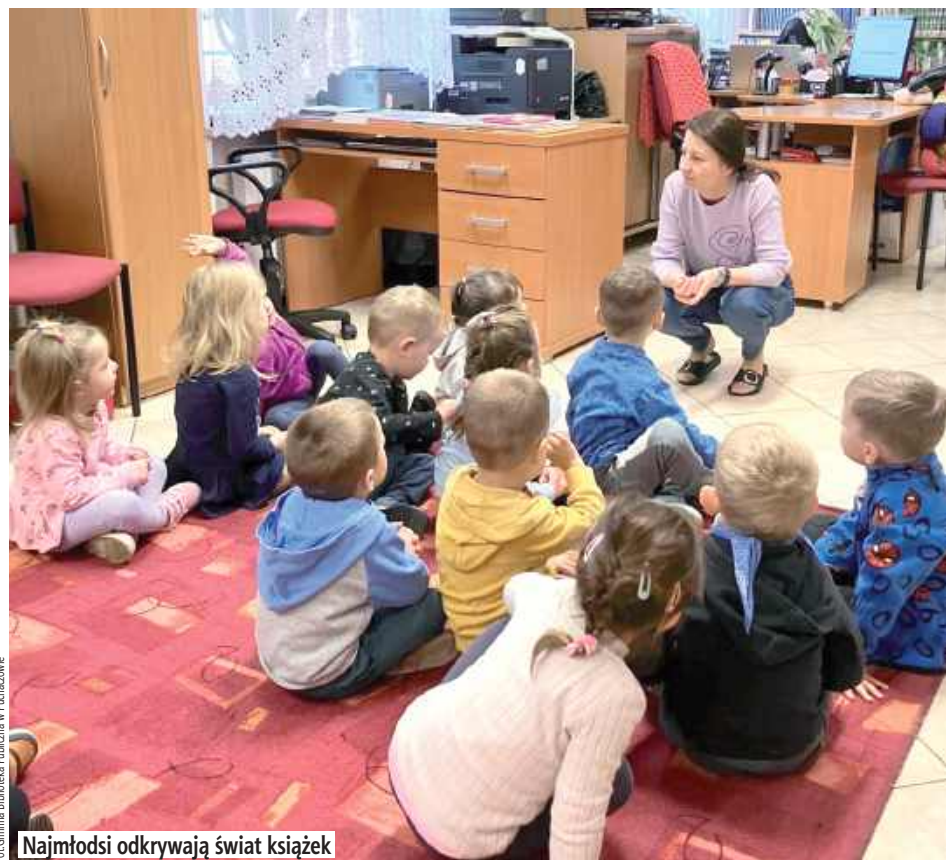
Najmłodsi odkrywają świat książek