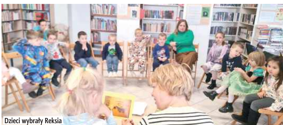
Dzieci wybrały Reksia

W Filii nr 2 Miejsko-Gminnej Biblioteki Publicznej im. Zbigniewa Herberta w Łęcznej odbyły się zajęcia dla dzieci z Przedszkola Publicznego nr 4 z grupy „Sowy”. Spotkanie zorganizowano z okazji Międzynarodowego Dnia Postaci z Bajek, który obchodzony jest 5 listopada.