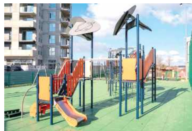
Nowoczesny tor przeszkód na osiedlu Bobrowniki

SP nr 4 zyska zupełnie nowe oblicze. W ramach zadania powstaje profesjonalna siłownia terenowa, a także pierwszy w Łęcznej sprawnościowy plac zabaw z bezpieczną nawierzchnią. Modernizacja obejmuje