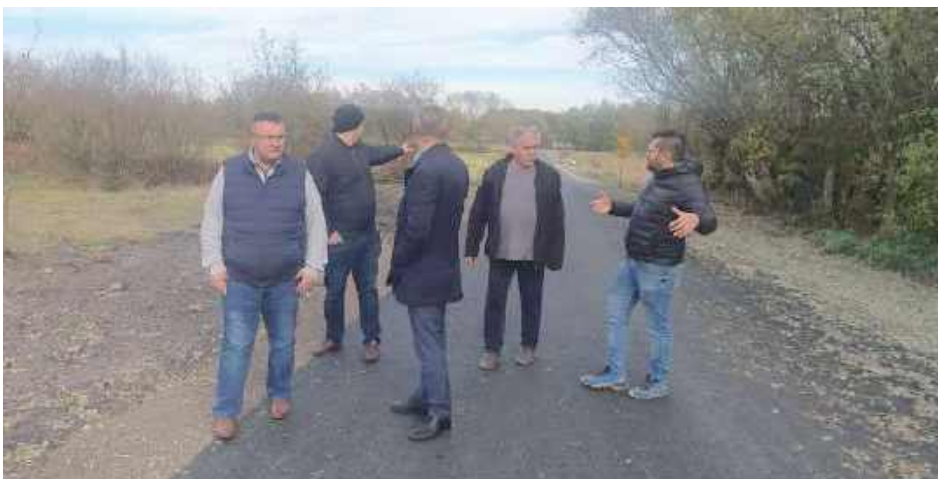
Odbiór dróg w gminie Spiczyn

Samorząd gminy Spiczyn zakończył kolejne ważne zadanie inwestycyjne, które przyczyni się do rozwoju lokalnej infrastruktury i poprawy jakości życia mieszkańców. W ramach projektu wykonano budowę nowej sieci wodociągowej w miejscowości Jawidz oraz przebudowę dróg gminnych nr 105117L i 105119L.