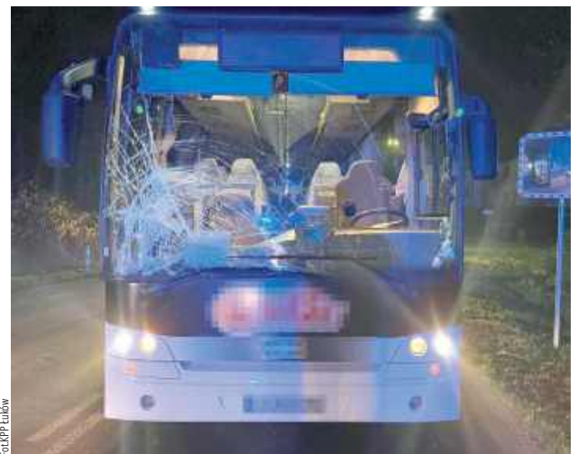
W Stoczku Łukowskim doszło do tragicznego wypadku drogowego, w wyniku którego 56-letni pieszy zginął