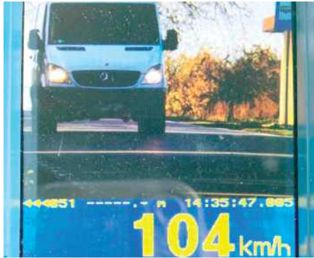
Podczas akcji opolskich policjantów trzech kierowców straciło prawo jazdy