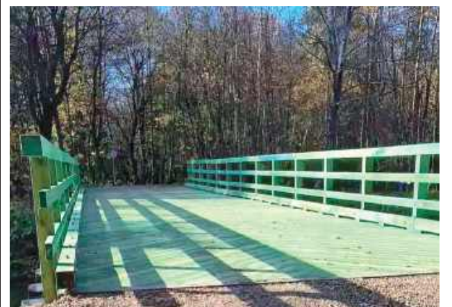
Wyremontowany most na kanale Wieprz-Krzna

W Puchaczowie zakończył się remont mostu na kanale Wieprz-Krzna. Dzięki pracom poprawiły się warunki komunikacyjne i bezpieczeństwo mieszkańców oraz kierowców.