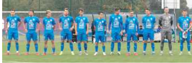
Lewart wygrał po raz siódmy z rzędu

Spotkanie rozpoczęło się w szybkim tempie, z dużą intensywnością po obu stronach. Tur Milejów, beniaminek IV ligi, odważnie ruszył do przodu i w 21. minucie objął prowadzenie po trafieniu Jakuba Prylińskiego. Zespół Lewartu wydawał się przez chwilę zaskoczony, ale tylko przez moment.