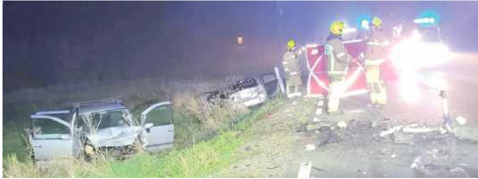
W wyniku zderzenia 72-letni kierowca Forda, mieszkaniec powiatu łukowskiego, mimo podjętej reanimacji zmarł na miejscu wypadku

W piątek, 7 listopada na drodze krajowej nr 76 w pobliżu miejscowości Łopacianka na trasie Łuków - Garwolin, doszło do tragicznego wypadku drogowego. O godzinie 17.29 służby