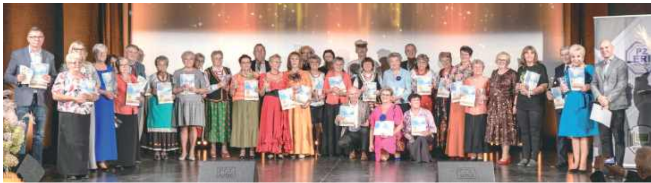
Zespoły z gminy Milejów z sukcesami na „Seniorskiej Jesiennej Balladzie” we Włodawie