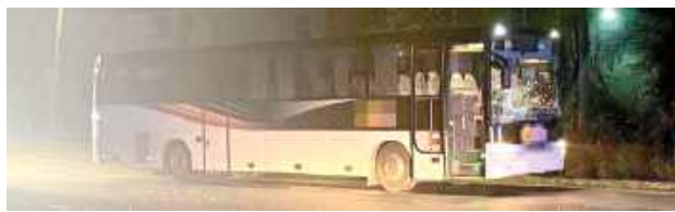
Pomimo szybkiej interwencji służb ratunkowych 56-letni mieszkaniec gminy Stoczek Łukowski, który doznał poważnych obrażeń ciała, zmarł po przewiezieniu do szpitala

Policja pod nadzorem prokuratury prowadzi śledztwo mające na celu wyjaśnienie dokładnych okoliczności wypadku. Funkcjonariusze będą ustalać m.in. pręd-