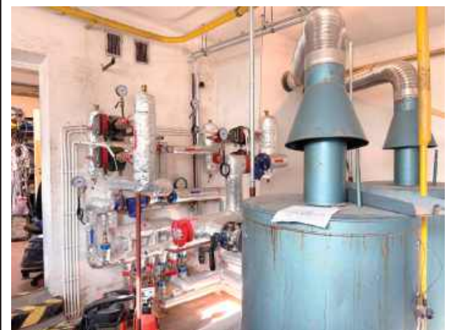
Remont kotłowni szkoły w Januszówce

W Szkole Podstawowej w Januszówce trwają intensywne prace związane z przebudową kotłowni. Najważniejszy etap inwestycji został już zakończony - stary kocioł grzewczy zastąpiono nowoczesnym, energooszczędnym urządzeniem, które od początku sezonu grzewczego zapewni ciepło w całym budynku. Dzięki temu uczniowie i pracownicy szkoły mogą korzystać z komfortowych warunków cieplnych.