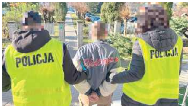
Za popełnione przestępstwo sprawcy grozi kara nawet do 20 lat pozbawienia wolności

Lublin: Policjanci zatrzymali 35-latkę, który podczas kłótni ugodził nożem swojego starszego brata. Pokrzywdzony z obrażeniami realnie zagrażającymi życiu trafił do szpitala.