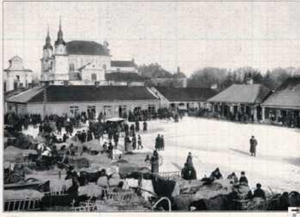
W Lubartowie Węgrom było na tyle dobrze, że się w ogóle nie chcieli wyprowadzać i niektórzy planowali po wojnie tu zamieszkać

Zupełnie inaczej potoczyły się sprawy w Międzyrzeczu Podlaskim. Na pierwszy rzut oka gród nad Krzną wydawał się łatwym kąskiem. Wobec niepowodzeń frontowych i przebiegu rewolucji w Rosji armia niemiecka przejawiała daleko idące objawy demoralizacji. W garnizonach powstawały komunizujące Rady Żołnierskie będące alternatywnymi ośrodkami dowodzenia dla normalnych struktur. Z drugiej strony istotne jest, że obszar Międzyrzecza - w odróżnieniu choćby od Łukowa - w ramach tzw. Etapów Bugu - podlegał