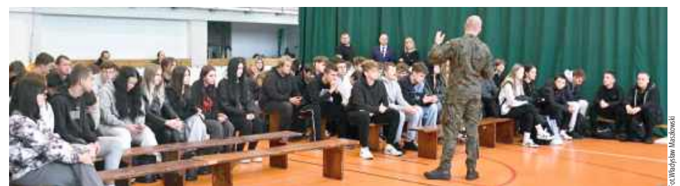
Spotkanie w ZSP w Niemcach