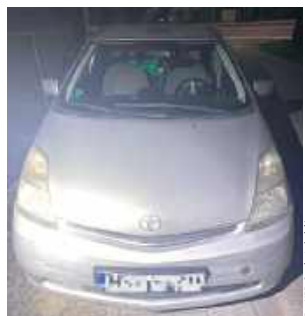
Po wylegitymowaniu i sprawdzeniu stanu trzeźwości okazało się, że za kierownicą Toyoty siedział 29-letni obywatel Ukrainy, który miał w organizmie blisko 1,5 promila alkoholu