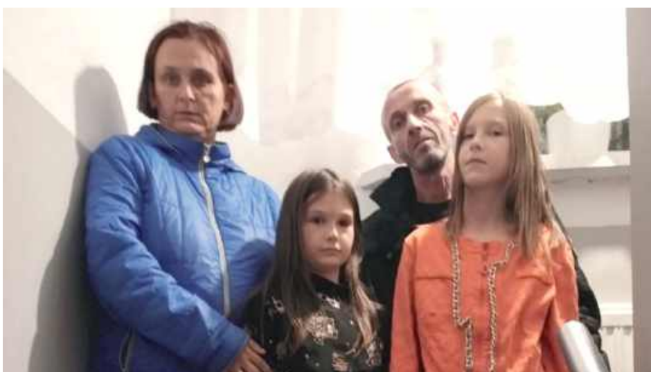
Rodzina Cieniuchów potrzebuje pomocy

Link do zbiórki na pomoc pogorzelncom: https://zrzutka.pl/2tghe2