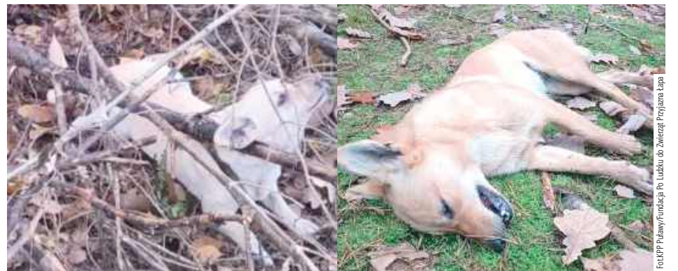
Policja apeluje do osób, które rozpoznają psy, o kontakt z puławską komendą pod numerem 47 81 23 290 lub 601 579 472

Puławska policja wyjaśnia okoliczności zdarzenia, do którego doszło w lesie pod Puławami. Grzybiarze znaleźli dwa psy z pętlami samozaciskowymi na szyi i ze stalowymi linkami zamocowanymi do drzew. Jeden z czworonogów nie przeżył.