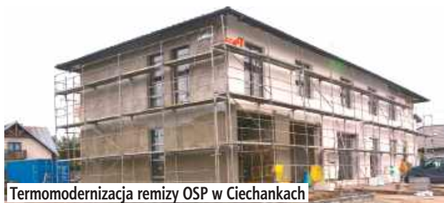
Termomodernizacja remizy OSP w Ciechankach

Zakres prac obejmuje m.in. docieplenie budynku, wymianę stolarki okiennej i drzwi-