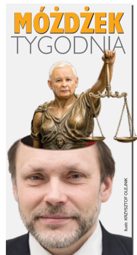
Ilustr. KRZYSZTOF OLEJNIK

Wisłą uwił sobie gniazda kapitał finansowy centrum. W krajach starej Unii to kilka, najwyżej kilkanaście procent udziałów w sektorze bankowym – u nas wciąż około 60 proc. Banki z kapitałem zagranicznym udzielają około 70 proc. kredytów netto. Wśród demoludów tylko Polska oddała kontrolę nad sektorem finansowym kapitałowi zagranicznemu. Od obywateli ważniejsi są teraz inwestorzy, a od opinii publicznej – stopy procentowe.