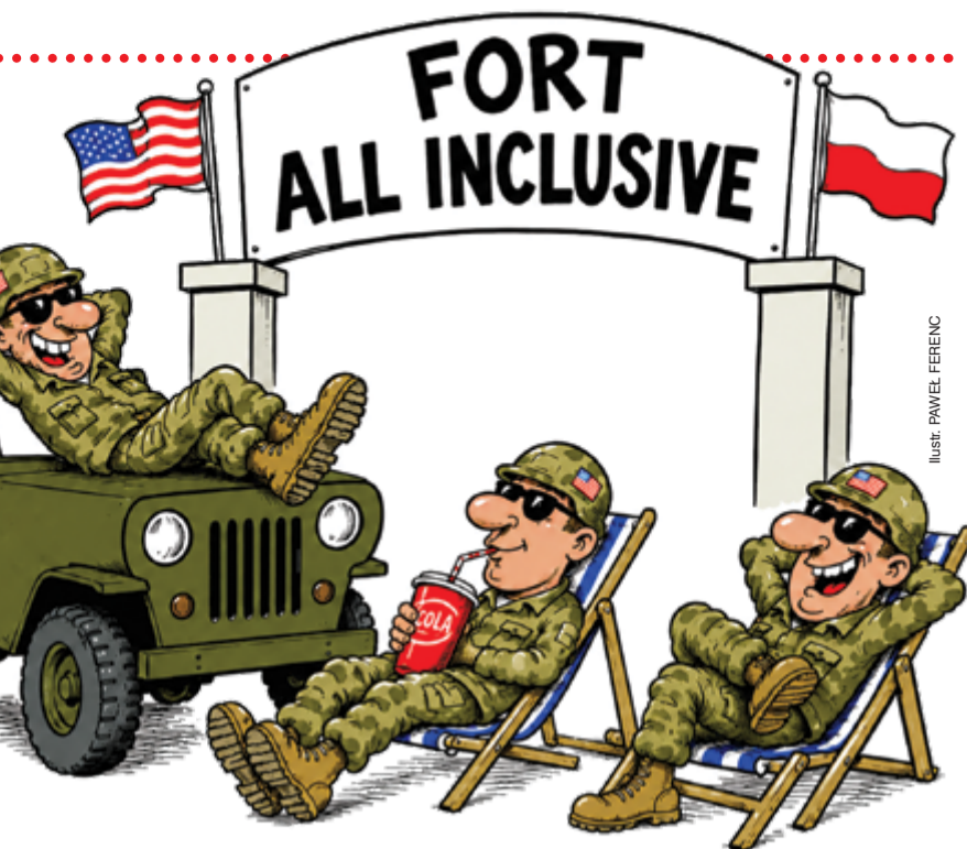
Ilustr. PAWEŁ FERENC

Myślę sobie zatem, iż jeśli wycofanie czterech tysięcy amerykańskich wojsków z Polski rzeczywistość byłoby