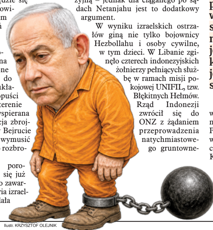
Ilustr. KRZYSZTOF OLEJNIK