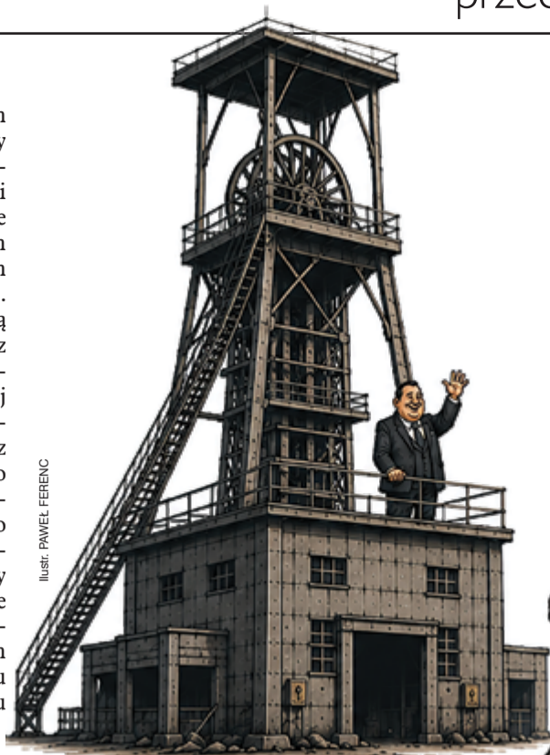
ILLUSTRACJA: PAVEL FERENC