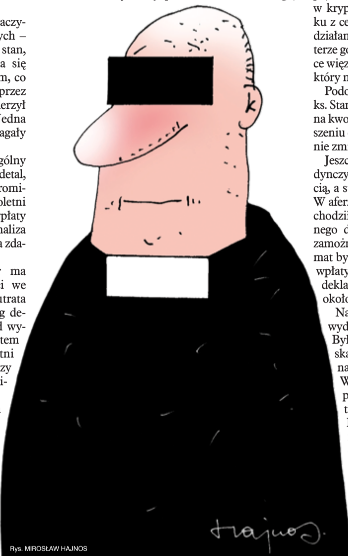
Rys. MIROSLAW HAJNOS