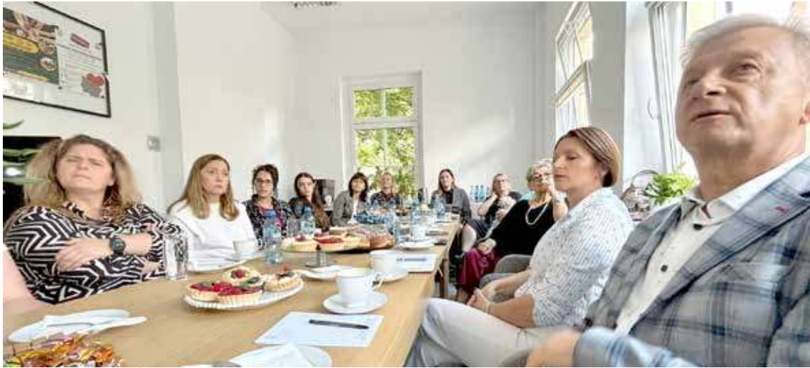
Spotkanie na temat CUS nowogardzkich „specjalistów” na początku września - Oj chyba za dużo słodkiego było, a cukier niezdrowy jest i myśleniu też nie służy... co kolejne wpadki z CUS potwierdzają.

Po decyzji wojewody z tego tygodnia uchylająca uchwałę rady miejskiej o powołaniu Centrum Usług Społecznych to nowogardzkiego CUS-su nie ma już nie tylko w praktyce - nikt nie zgłosił się do przetargu na dostosowanie pomieszczeń, patrz DN z ubiegłego tygodnia - ale także na papierze. Wszystko zasługa „niebywałego profesjonalizmu” Wiatra i jego ekipy - o czym trąbi w pustych, jak się okazuje co chwila, frazesach od rana do wieczora. Wojewoda uchylił uchwałę rady miejskiej w tej sprawie, bo jak pisze: „narusza obowiązujący porządek prawny”. Nowogardzka Inicjatywa Referendalna podaje też znamienne fragmenty uzasadnienia wojewody, które zupełnie kompromitują przygotowujących takie buble prawne jak uchwała o powołaniu CUS. Należy w tym aspekcie zwrócić uwagę na jeszcze jeden element - co za radca opiniuje takie prawne buble? Taki radca - biorąc też pod uwagę wcześniejsze uchylenia wojewody, uwagi RIO itp. - albo dramatycznie się nie zna, albo jest tylko po to, by podpisywać pieczęcią radcy pomysły burmistrza i spółki niezależnie jakie prawne bzdury one zawierają.