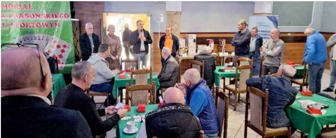
Rozpoczęcie zawodów brydżowych przy pełnej sali w Restauracji Przystań