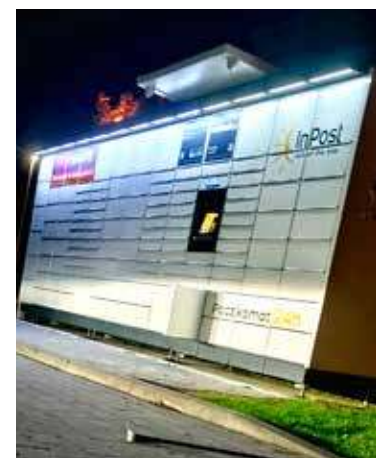
Paczkomat miał zostać otwarty za pomocą łoma

W konsekwencji prokurator zastosował wobec podejrzanych środki zapobiegawcze w postaci dozoru Policji oraz zakazu opusz-