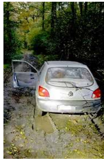
Auto zostało porzucone w lesie. Po 3 godz. kierowca sam zgłosił się na komendę

Nie oznacza to konieczności zatrzymania natychmiast — należy to zrobić w bezpiecznym miejscu, tak aby nie stwarzać zagrożenia dla innych uczestników