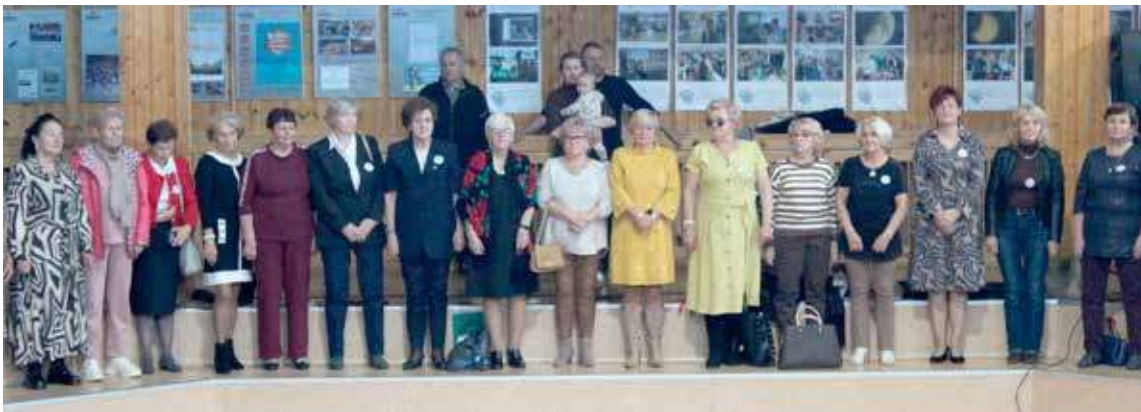
W trakcie inauguracji 14. roku działalności nowogardzkiego UTW gościnnie studentom udzieliło forum II LO