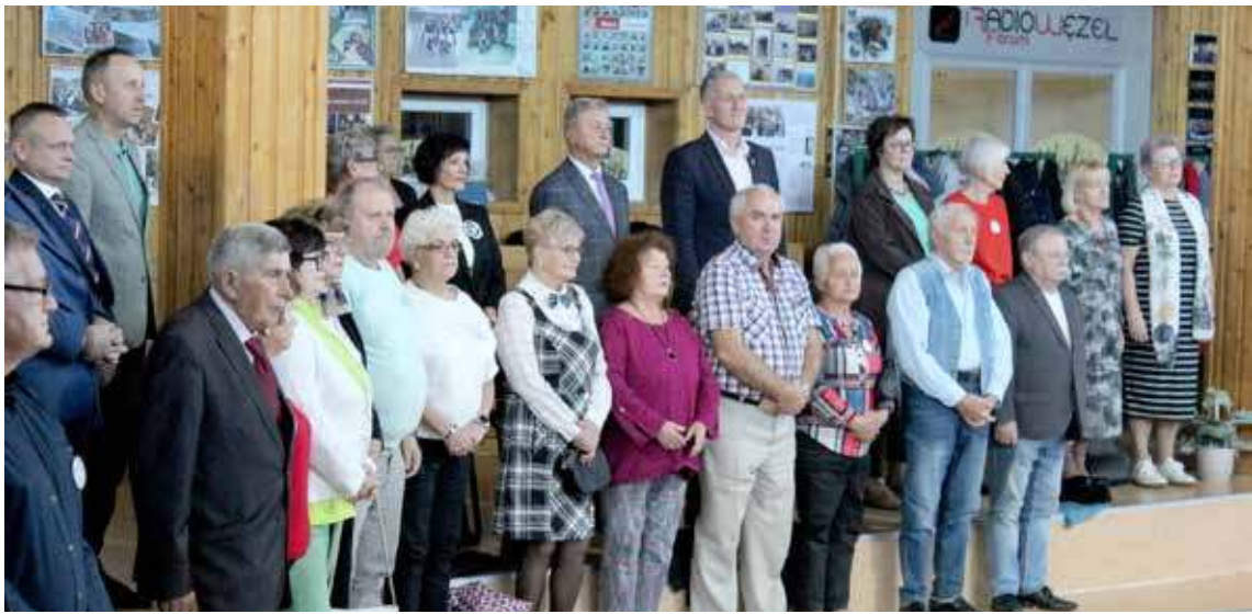
Już na początku nie zabrakło hymnu studenckiego