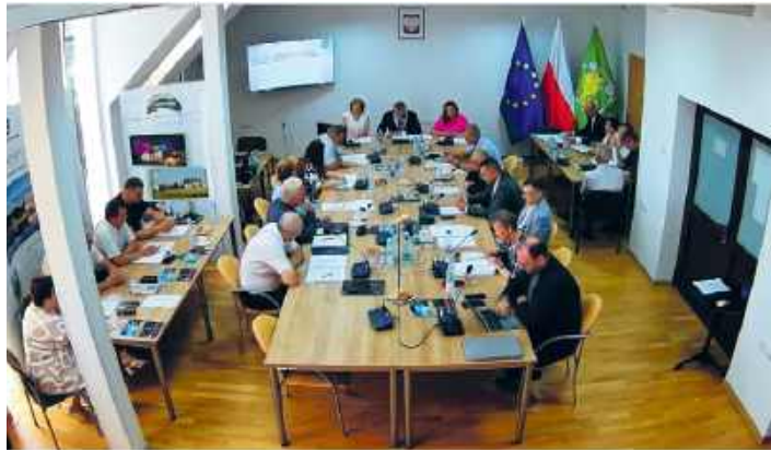
XII sesja IX kadencji Rady Gminy Krasnystaw