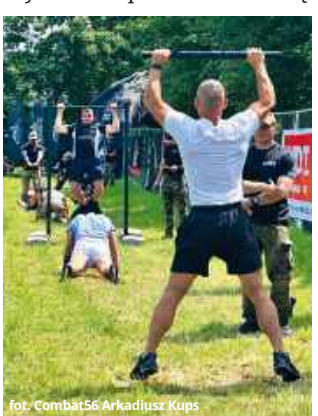
cy, analizując relacje z poprzednich edycji i budując zarówno formę fizyczną, jak i odporność psychiczną.

Zdaniem instruktorów współczesna młodzież często trenuje świadomie i systematycznie. Wielu kandydatów przygotowywało się do tego wydarzenia przez wiele miesięcy.