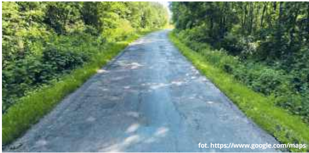
Prace na drodze prowadzącej do Popław mają rozpocząć się na ul. Grabowieckiej w Wojsławicach

Mieszkańcy gminy Wojsławice oraz kierowcy korzystający z drogi powiatowej nr 1839L mogą w najbliższych latach doczekać się jednej z ważniejszych inwestycji drogowych w tej części powiatu chełmskiego. Starostwo Powiatowe w Chełmie prowadzi obecnie intensywne działania związane z przygotowaniem przebudowy ponad dwukilometrowego odcinka trasy prowadzącej od Wojsławic do granicy powiatu.