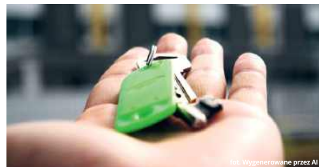
Źródło: Wygenerowane przez AI

Jak zatem przełożyć lipcowe spowolnienie na realne oszczędności przy zakupie mieszkania? Kluczowy okazuje się sojusz z pośrednikiem reprezentującym kupującego lub stronę sprzedającą. Licencjonowany agent doskonale wie, że udana