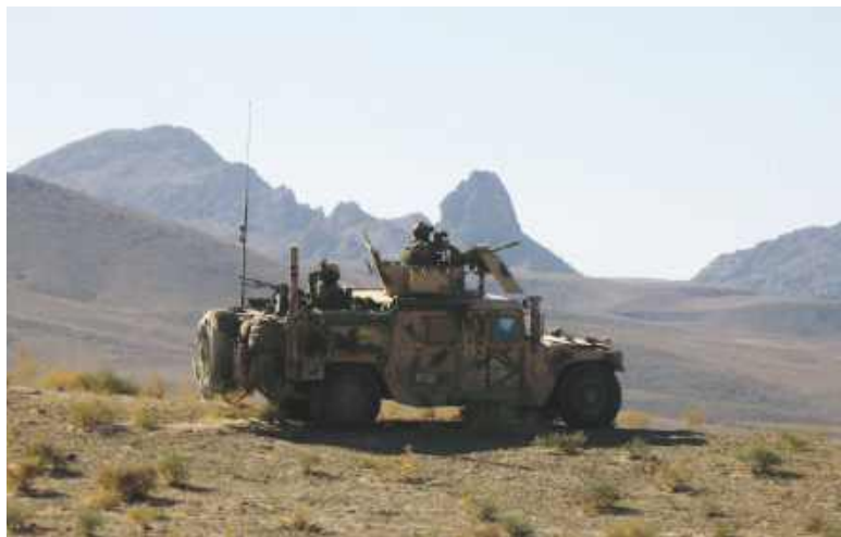
GROM w bazie sił sojuszniczych pod polskim dowództwem

T. L.: Urodziłem się na wsi w Kujawsko-Pomorskiem, obok miasteczka Brodnica. W tym miejscu, i w tamtych czasach, tj. w latach 80-tych XX w., nie było szalonych perspektyw na przyszłość. Ukończyłem technikum ekonomiczne, ale ciekawy byłem świata. Wojsko dawało mi, jako młodemu mężczyźnie, szerokie horyzonty i możliwości. Żeby nie było nudno, to nie wybrałem zwykłej jednostki wojskowej, ale chciałem do jednostek specjalnych Czerwonych Beretów. Wcześniej trafiłem do Wojskowej Komendy Uzupelnień w Brodnicy. Przystanek miałem w Lublińcu w szkole