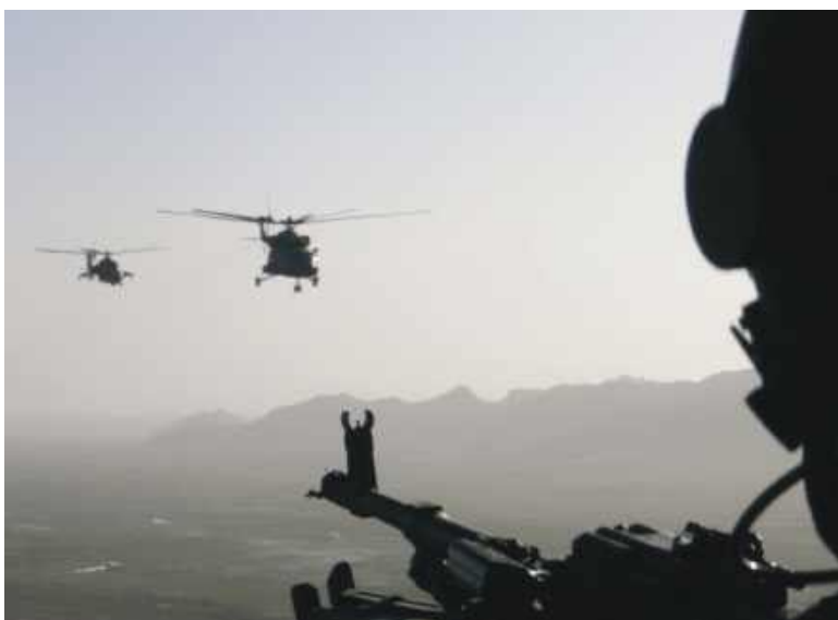
Powrót z akcji w Afganistanie