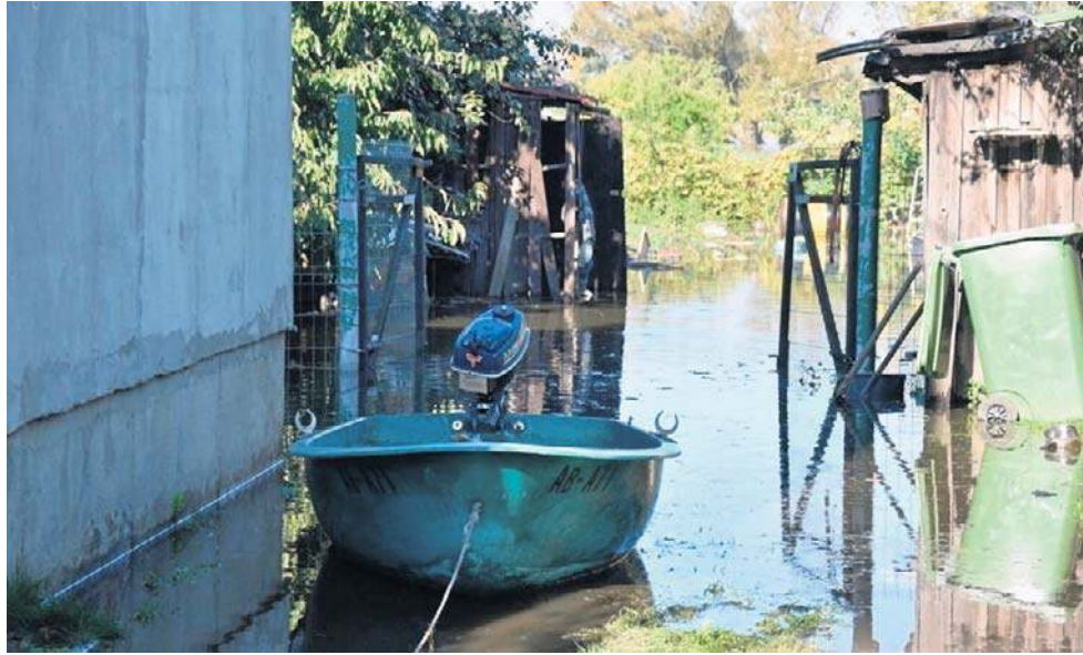
Ubiegłoroczna powódź była tragiczna w skutkach. Poszkodowani dostali ofertę pomocy.

Taki wniosek można składać do 1 października br. Jest on do pobrania na stronie internetowej