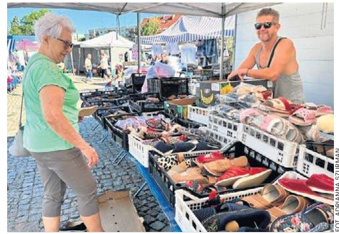
Dzień targowy w Strzegomiu. W każdą środę można znaleźć prawdziwe perełki. Kupujących nigdy nie brakuje.

Warto tu zajrzeć, bo ceny są konkurencyjne i znajdzie się coś na każdą kieszeń.©©