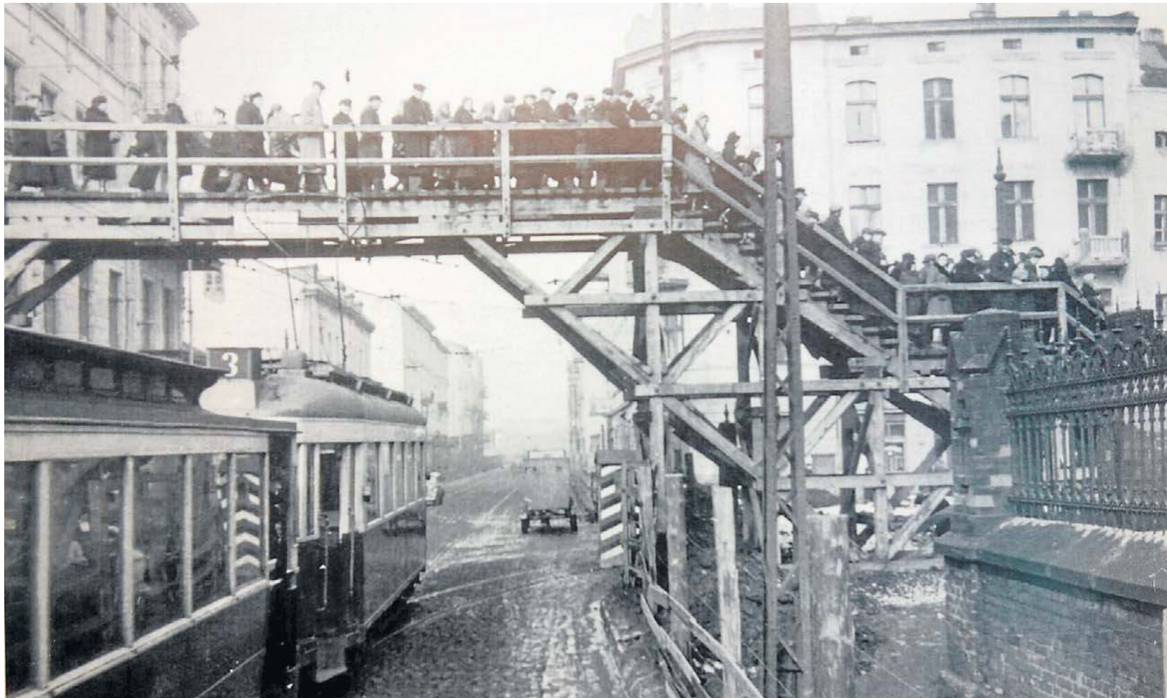
Warunki życia były straszne. Na jedno mieszkanie przypadało 7-11 osób. Był niesamowity głód – toczyła się ciągła walka o jedzenie.

Przesiedlenia do getta zakończono w połowie kwietnia 1940 roku. Jego granice przebiegały wzdłuż ul. Majowej, Jene-