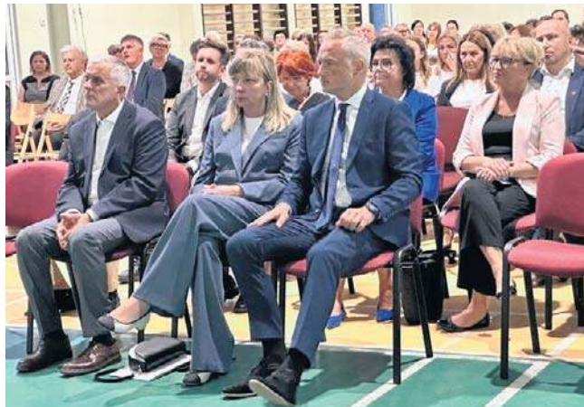
Podczas uroczystości w „Mechaniku” doceniono nauczycieli, zaś młodzieży obiecano atrakcyjne programy.

W sumie pod opieką przedszkoli samorządowych będzie blisko 1400 maluchów, a w pierwszych klasach naukę zacznie 747 uczniów. Do szkół poszło w Wałbrzychu 13 411 uczniów.