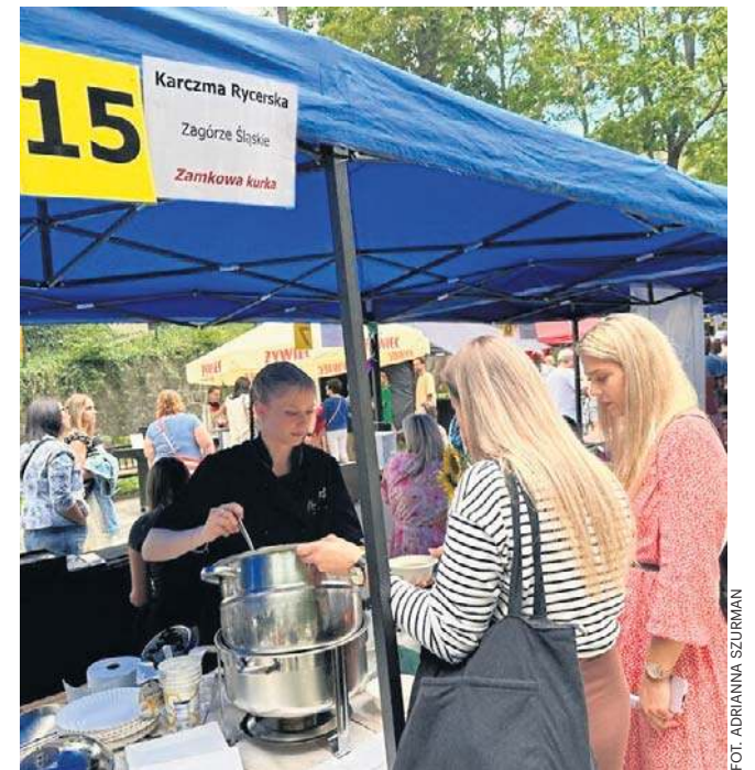
Jury nie wiedziało, kto jest autorem zup. Były dostarczane na stoły z numerkami, a sędziowie przyznawali punkty.

Razem z nią zupę nalewała m.in. posłanka Sylwia Bielaw-