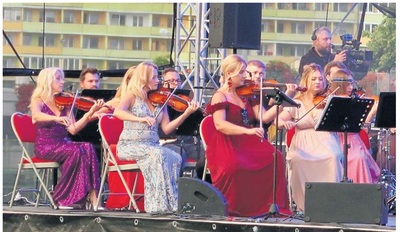
Filharmonia Sudecka zapraszała kiedyś na muzyczne wieczory na Rynku. Teraz zagościła na Piaskowej Górze.