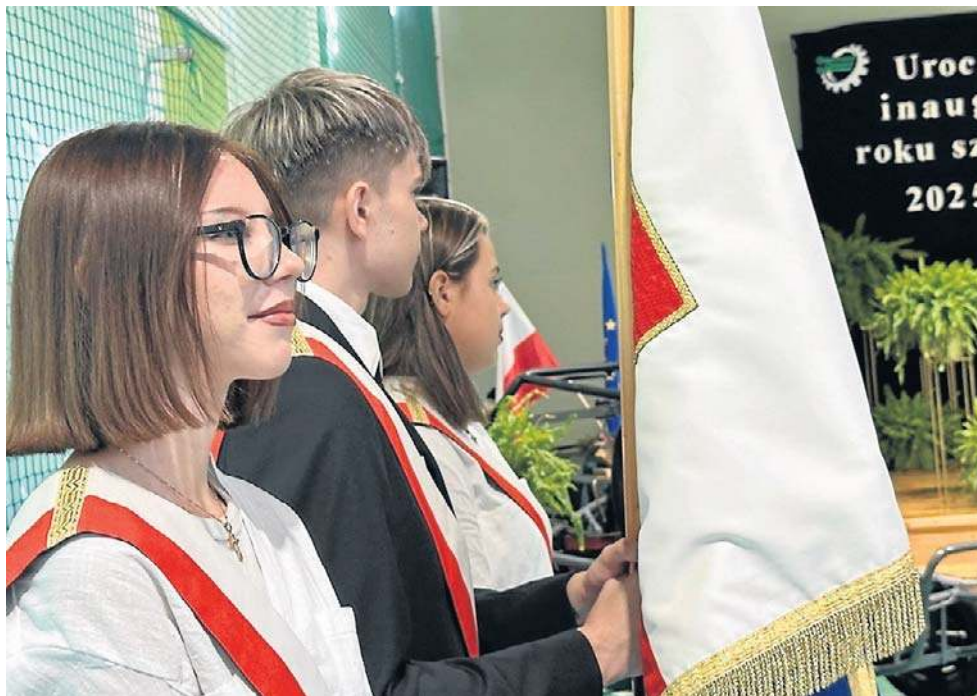
Uczniowie „Mechanika” byli dumni, że to u nich odbyła się miejska inauguracja roku szkolnego.

W tym roku liczba uczniów w naszych szkołach nie będzie mniejsza, a w niektórych nawet większa niż w poprzednim roku. To dlatego, że część uczniów dojeżdża do miejskich placówek spoza Wałbrzyska.