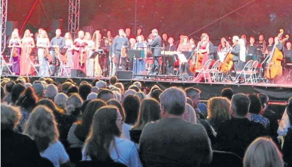
Muzycy zagrali: Grease, Upiór w operze, Love Never Dies, do tego Piratów z Karaibów.