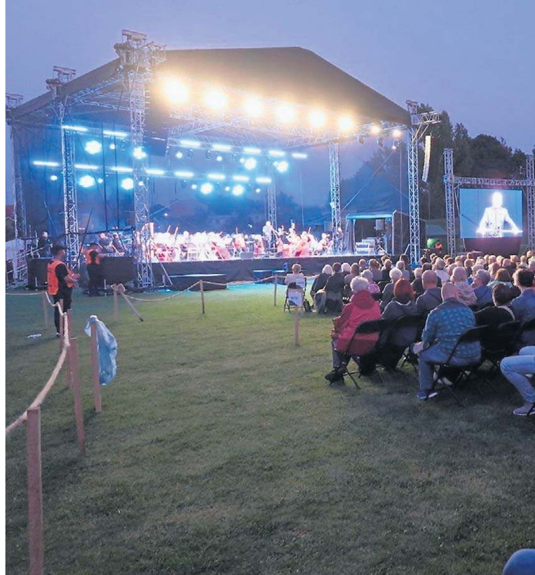
30 sierpnia na stadionie przy ul. Kusocińskiego w Wałbrzychu musicalowymi przebojami delekt