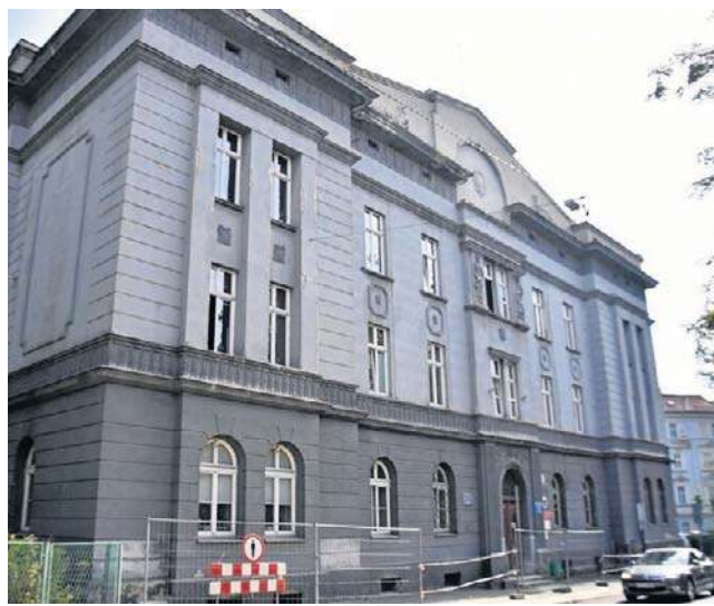
1 września podpisano umowę na termomodernizację zabytkowego budynku przy ul. Matejki 1 w Wałbrzychu.

Prezydent Szelemej podkreśla, że termomodernizacja zabytkowych obiektów nie jest łat-