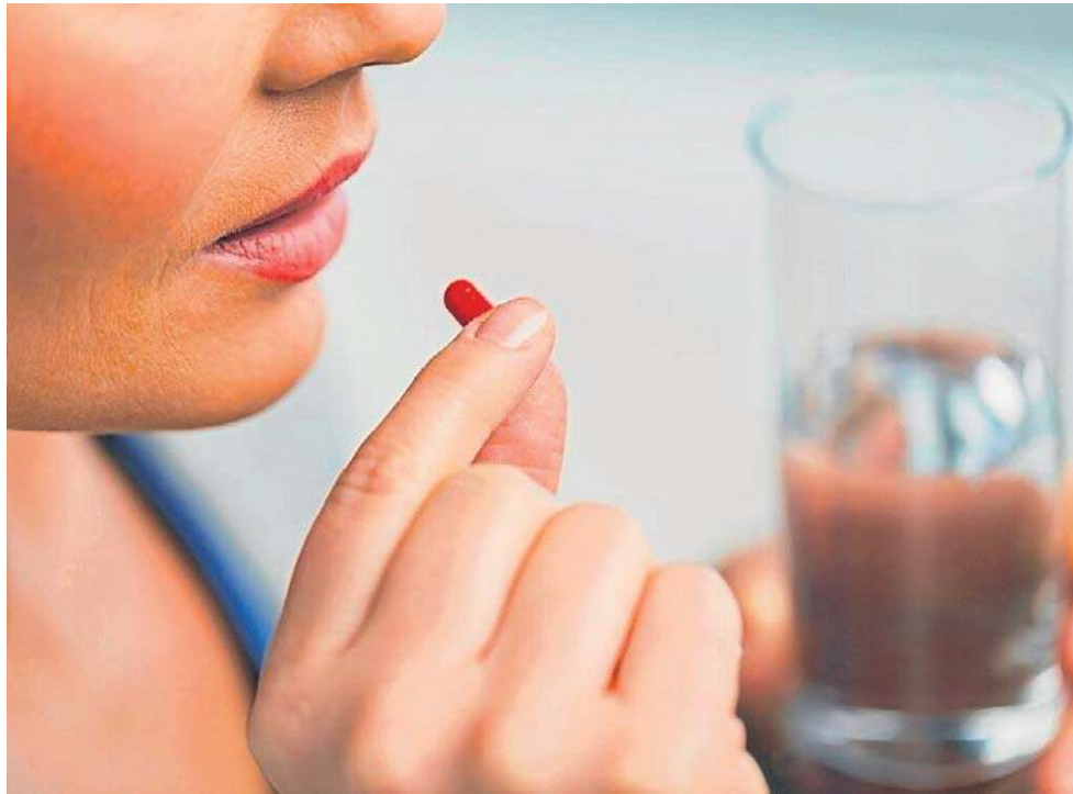
Wiele z substancji pomocniczych w lekach to związki niekorzystne dla zdrowia.

Substancje pomocnicze to związki, które w ilościach stosowanych w lekach nie mają własnego działania farmakologicznego. Umożliwiają nadanie odpowiedniej postaci leku,