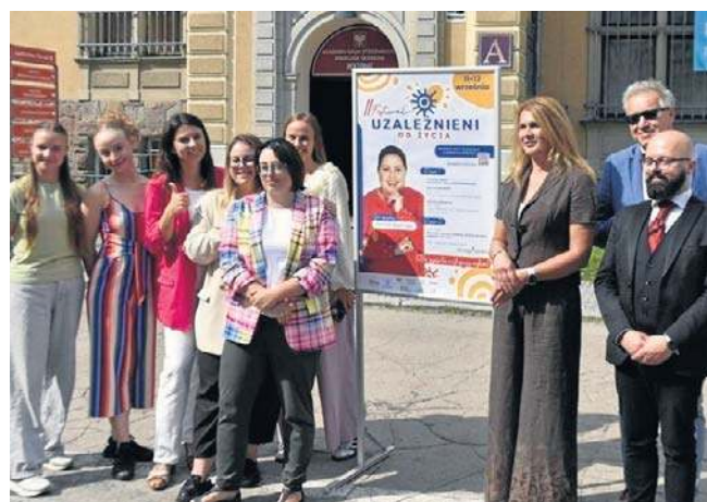
Organizatorzy II edycja festiwalu „Uzależnieni od życia” przedstawili założenia imprezy na konferencji prasowej.

Program wydarzenia: 11 września (dzień wykładowy) - rozwój fizyczny od dziecka do seniora; jak zadbać o swój dobrostan; nie hejtujemy - kul-