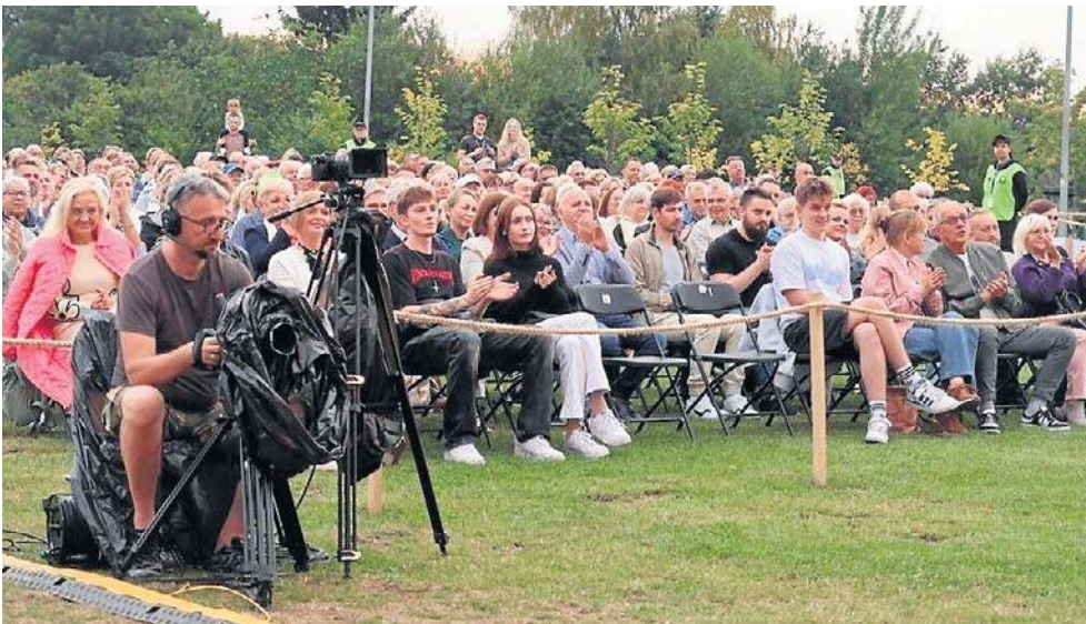
To była uczta: kompozycje z musicali i filmów, zagrane w letni wieczór pod chmurką.