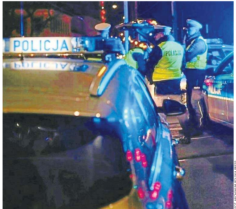
Policja otrzymała zawiadomienie o zabójstwie w niedzielę (31 sierpnia br.) rano.

§ 3. Karze określonej w § 2 podlega, kto jednym czynem zabija więcej niż jedną osobę lub był wcześniej prawomoc-