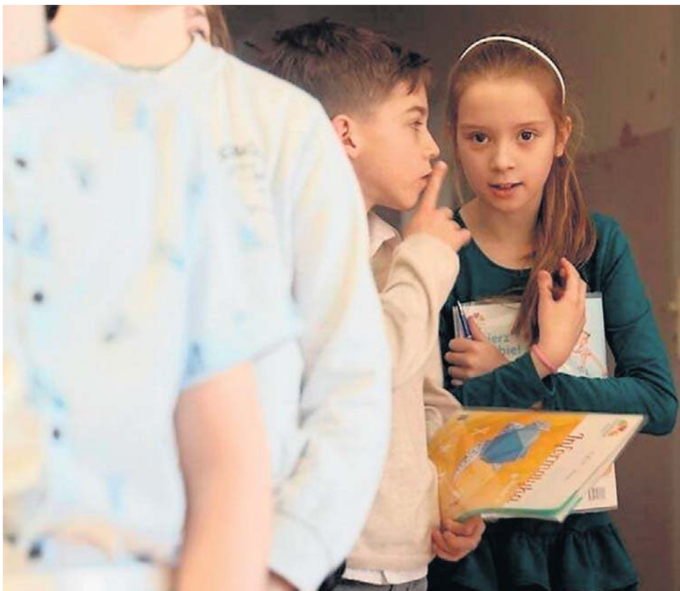
Obawy przeciwników edukacji zdrowotnej budzą kwestie LGBT. Więcnamawiają do bojkotu.

Jak dodaje, część dyrektorów zadeklarowała przygotowanie specjalnej prezentacji multimedialnej, którą zaprezentują rodzicom podczas zebrań. Tak, aby mieli świadomość, jakie treści mają być prezentowane uczniom i z czego rezygnują.