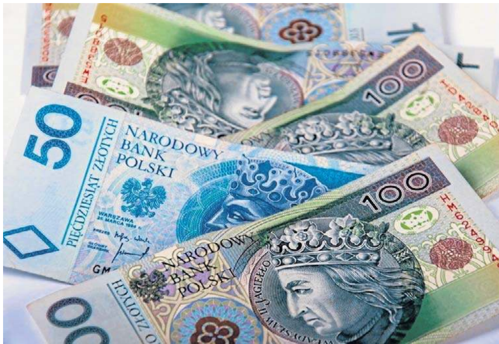
14. emeryturę ZUS wypłacił 8,9 mln emerytów i rencistów. 6,4 mln otrzyma pełną kwotę.

Dodatkowe środki, wypłacane z emeryturami, popularnie nazywanymi „czternastkami” będą trafiać ma konta seniorów