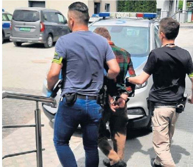
Policjanci z zatrzymanym 64-latką. Mężczyzna usłyszał wyrok pół roku bezwzględnej więzienia

W samo południe w poniedziałek policjanci włoszczowskiej drogówki skontrolowali w Olesznie Volkswagena prowadzonego przez 64-latkę. Mężczyzna miał ponad 3 promile alkoholu w organizmie. Do tego okazało się, że ciężko na nim sądowy zakaz kierowania.