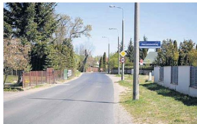
Ulica Perzanowskiej w Radomiu będzie przebudowana na odcinku od ulicy Mieszka I.

Na przebudowę ulicy Perzanowskiej miasto otrzyma prawie 6 milionów złotych z Rządowego Funduszu Rozwoju Dróg na przebudowę ulicy Stefani Perzanowskiej. Umowę na dofinansowanie inwestycji podpisali wojewoda mazowiecki Mariusz Frankowski i prezy-