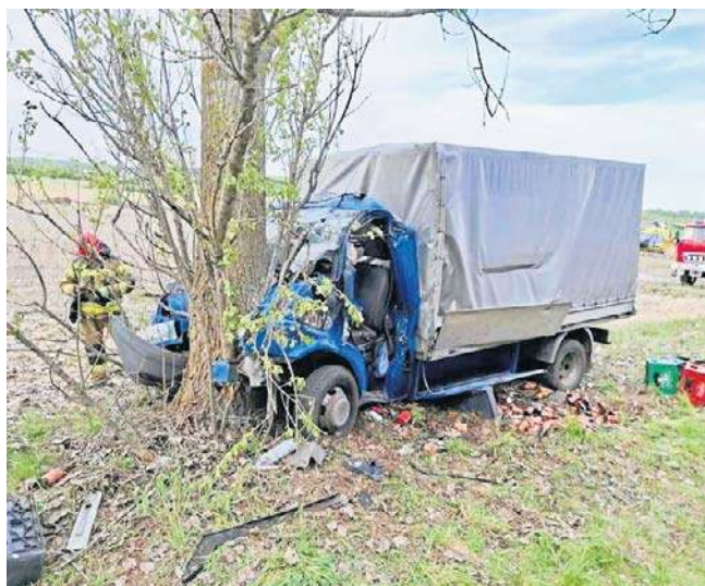
Kraska wydarzyła się na pograniczu powiatów pińczowskiego i jędrzejowskiego

Pierwszy sygnał wpłynął do strażaków z Jędrzejowa. Prócz dwóch zastępów z tej jednostki do akcji ruszyli drucho-