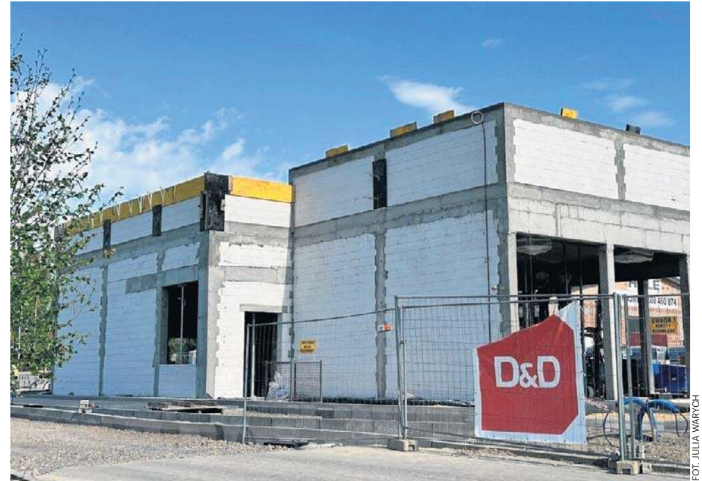
Amerykańska sieć Popeyes powstaje w strategicznym miejscu - w pobliżu głównej trasy łączącej Warszawę i Kraków, tuż obok funkcjonującej restauracji McDonald's

Nowa inwestycja to nie tylko poszerzenie oferty gastro-