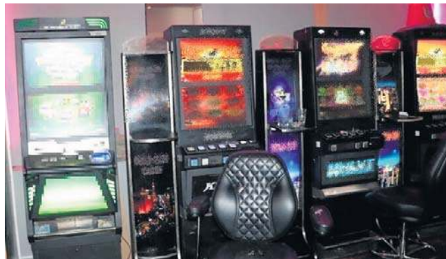
Policjanci znaleźli w nim cztery automaty do gier

- Na maszynach zainstalowane były gry o charakterze loso-