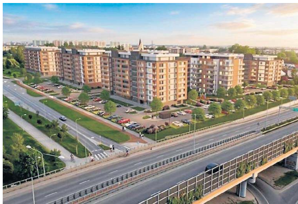
FOT. PROJEKT 2 QUADRA DEVELOPMENT

Planowane osiedle ma powstać po północnej stronie ulicy Jacka Kuronia, czyli południowej obwodnicy Radomia. Od strony zachodniej teren przylega do ulicy kapitana Wincetego Michalczewskiego.