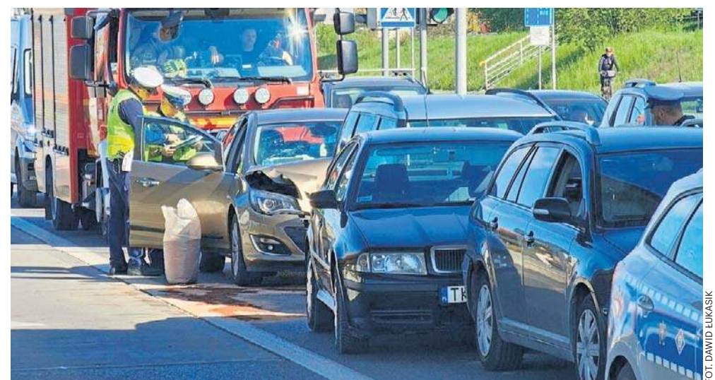
Cztery samochody zderzyły się na ulicy Grunwaldzkiej w Kielcach

- Siła uderzenia sprawiła, że Skoda najechała na poprze-