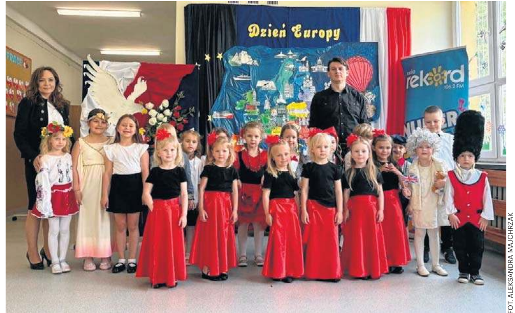
Dzieci z pięciu grup przez dwa tygodnie przygotowywały program artystyczny. Mali artyści zabrali publiczność w symboliczną podróż po krajach Europy.

Na scenie nie zabrakło różnorodnych występów artystycznych, w tym tańca narodowego, a także przygotowanej przez przedszkolaków inscenizacji „Lekcja geografii”, podczas której dzieci zabrały publiczność w symboliczną podróż po wybranych krajach Europy. Dzieci wspólnie odśpie-