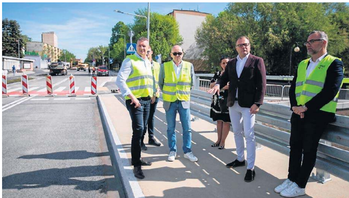
Ulica Chrobrego w Radomiu ponownie otwarta. Zakończyła się przebudowa wraz z budową mostu.

Wykonawcą inwestycji była firma Budromost-Starachowice. Wartość zadania wyniosła 3 miliony 591 tysięcy złotych, a realizacja była możliwa dzięki dofinansowaniu z programu Fundusze Europejskie dla Polski Wschodniej.