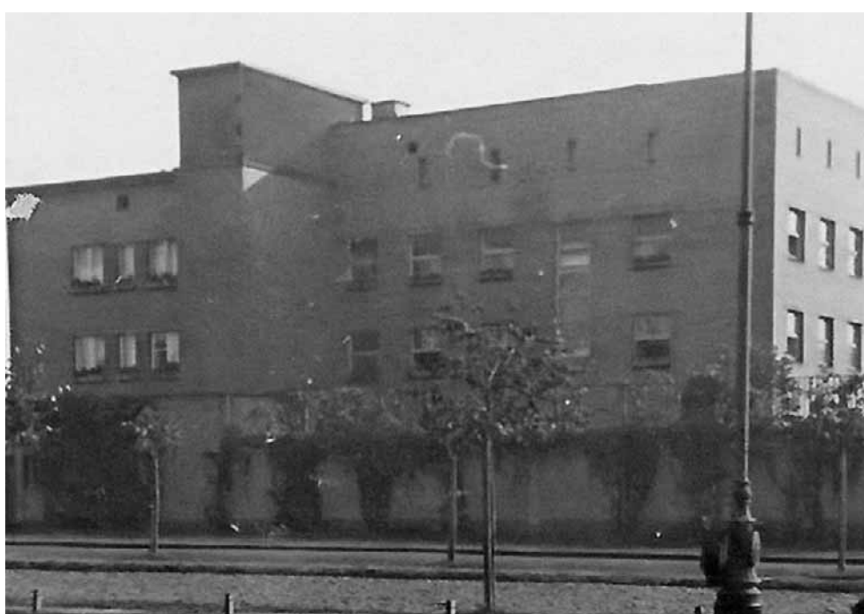
Ulica Wawelska 9, lata 30. Siedziba Samodzielnego Referatu Technicznego, podlegającego Oddziałowi II Sztabu Głównego Wojska Polskiego