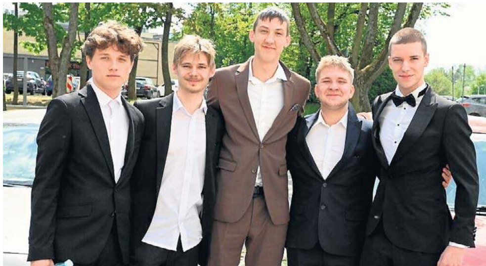
Maturzyści z VII Liceum imienia Józefa Piłsudskiego w Kielcach po egzaminie z języka angielskiego

Spośród 52 uczniów III Liceum Ogólnokształcącego z Oddziałami Integracyjnymi we Włoszczowie tylko jedna osoba zdecydowała się na język rosyjski, reszta zdawała język angielski. Podobnie sytuacja wyglądała wśród uczniów Technikum numer 2 z Oddziałami Integracyjnymi we Włoszczowie.