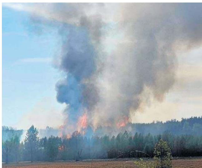
Groźny pożar lasu w Zastroniu w powiecie szydłowieckim. Ogień objął kilka hektarów.

Sytuacja była bardzo groźna, ogień objął około 4 hektarów powierzchni. Mieliśmy do czynienia z pożarem wierzchołkowym młodnika - relacjonuje Ochotnicza Straż Pożarna w Orońsku.