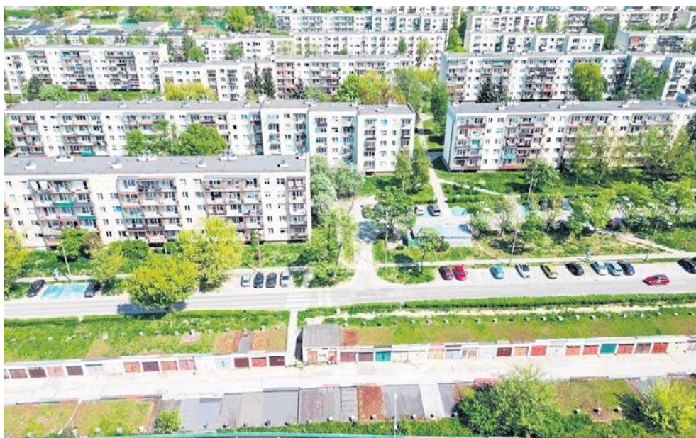
Opuszczone garaże na osiedlu Bocianek w Kielcach, przygotowywane pod budowę drogi ekspresowej S74

Opróżnienie garaży było konieczne, by umożliwić dalsze działania związane z realizacją inwestycji. Choć same obiekty wciąż stoją, teren został już przygotowany do kolejnych