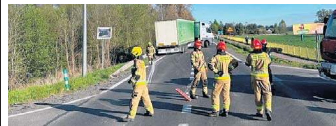
Do wypadku doszło w miejscowości Nietulisko Małe

Na miejscu działało pięć zastępów straży pożarnej.