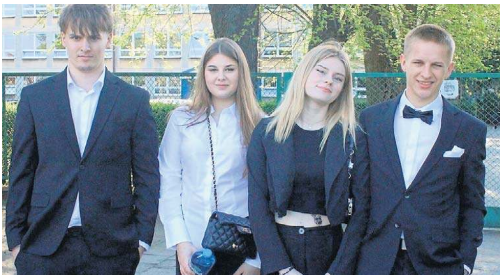
Maturalne egzaminy pisemne już za nimi. Na zdjęciu: Maturzyści z Zespołu Szkół Ekonomicznych w Radomiu przed maturą z matematyki zachowywali spokój.

Choć język angielski uchodzi za jeden z łatwiejszych egzaminów maturalnych, nie za-