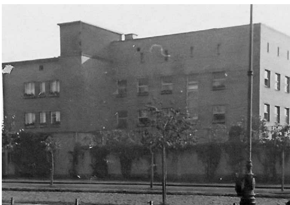
Ulica Wawelska 9, lata 30. Siedziba Samodzielnego Referatu Technicznego, podlegającego Oddziałowi II Sztabu Głównego Wojska Polskiego