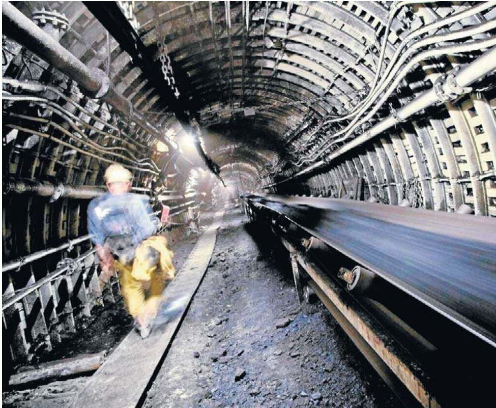
JSW na skraju zapaści. Jak wygląda sytuacja na początku 2026 roku?

Model Finansowy JSW przedstawiony kilka miesięcy temu zakładał na najbliższe kilkanaście miesięcy m.in.: obniżenie poziomu nakładów na inwestycje rzeczowe, które nie wpłyną na ograniczenie potencjału produkcyjnego w okresie średnioterminowym (intensyfikacja działań zmierzających do zwiększenia wydobycia), obniżenie kosztów operacyjnych o około 900 mln zł w porównaniu roku 2025 do 2027, (poprzez sukcesywne przejmowanie kompetencji firm