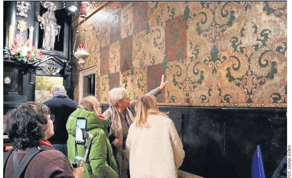
Kurdybany na Jasnej Górze odnowione. Tworzą szlachetne tło dla ołtarza z Cudownym Obrazem Matki Bożej

Jasnogórskie kurdybany charakteryzują się wybijanymi w skórze drobnymi wzorkami, które układają się w większe wzory i na końcu dodana była