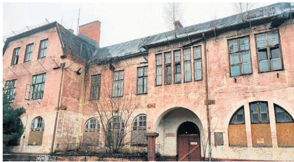
Budynki KWK Saturn w Czeladzi zyskują drugie życie. Tak wygląda Dom Ludowy, który czeka na modernizację

- W 2013 roku przeprowadzony został remont kopalnianej elektrowni gdzie funkcjonuje galeria Sztuki Współczesnej. W 2019 zakończył się remont Warsztatów Elektrycznych i Transformatorowni, które to obiekty zagospodarowało Centrum Usług Społecznych i Aktywności Lokalnej. W 2023 roku hucznie oddawaliśmy do użytku największy pokopalniany obiekt, cechownię. Tam od razu zaczęła funkcjo-