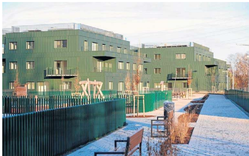
Nowe osiedle przy ul. Kosmicznej w Katowicach jest już niemal ukończone. Niedługo ruszy nabór wniosków o najem tamtejszych mieszkań

- Osiedle przy ul. Kosmicznej wpisuje się w ideę tworzenia miasta przyjaznego do życia. To nie tylko 111 nowych mieszkań dla katowiczanki i katowiczana, ale także inwestycja, której funkcjonowanie będzie wiązało się ze zdecydowaniem mniejszym oddziaływaniem na środowisko naturalne. Dzięki zastosowaniu nowoczesnych technologii pozyskaliśmy ponad 42 mln zł na re-