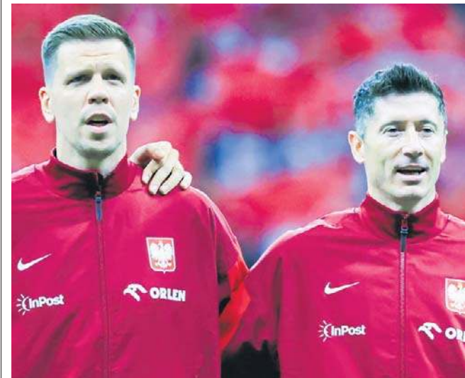
FOT. SYLWIA DĄBROWA

W tym roku Szczęsny będzie jednak pełnił rolę rezerwowego. Scenariusz, w którym to Joan García spóźnia się na odprawę przedmeczową, wydaje się mało prawdopodobny przed starciem z baskijskim klubem. Nie przeszkadza to jednak Polakowi, który nawet podczas podróży wręcz emanował dobrym humorem i pozytywną energią. Półfinałowe spotkanie FC Barcelony z Athletikiem Bilbao zaplanowano na środę, 7 stycznia, na godzinę 20.00. Transmisja dostępna będzie tylko w Eleven Sports 1. Drugiego finalistę wyłonią czwartkowe derby Madrytu między Realem a Atlético. ©©