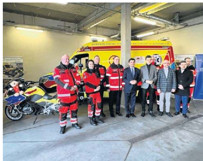
Od 1 stycznia 2026 roku w Będzinie stacjonuje nowy, trzyosobowy zespół ratownictwa medycznego

Takich trzyosobowych zespołów ratownictwa medycznego