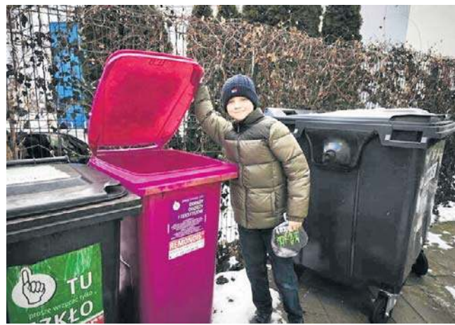
W Gliwicach nie trzeba jechać na PSZOK. Ubrania można wyrzucić do takich pojemników

Jak działa system zbiórki tekstyliów? Osoby mieszkające w domach jednorodzinnych otrzymują fioletowe worki, a ich zawartość opróżniana będzie raz w miesiącu, w systemie „worki za worek”. Mieszkańcy budynków wielorodzinnych, po uzgodnieniach z zarządcami, dostaną fioletowe pojemniki, które będą opróżniane co dwa tygodnie.