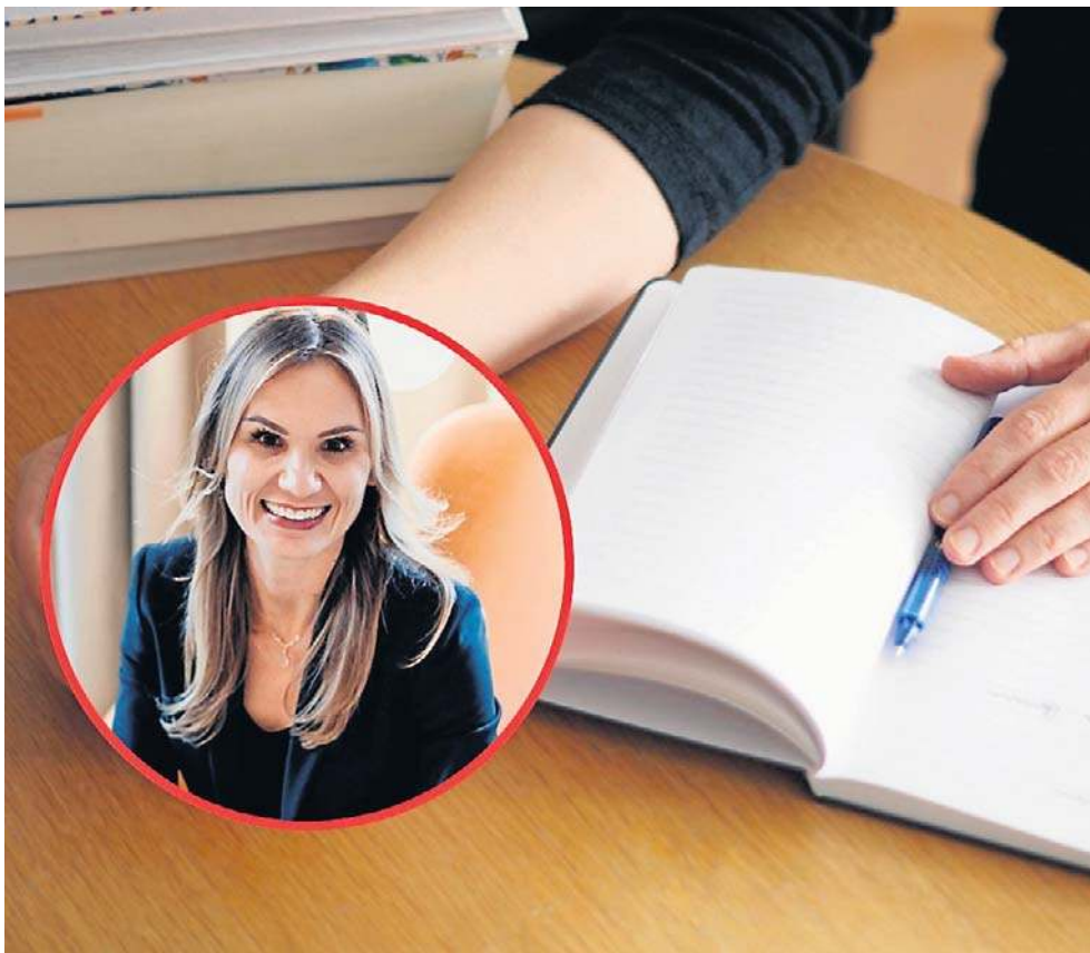
Postanowienia noworoczne wymagają świadomego podejścia, planowania i konsekwencji

Najważniejsze wydają się więc 3 pierwsze miesiące nowego roku, bo po tym czasie liczba osób, którym się nie powiodło, rośnie przez trzy kolejne miesiące tylko o 4 procent.