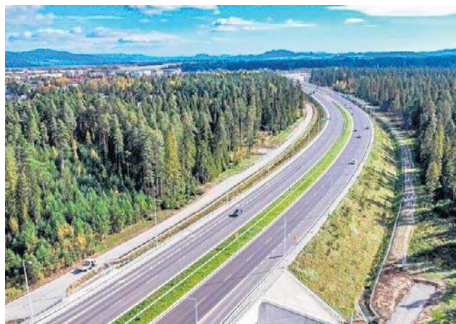
Beskidzka Droga Integracyjna ma ułatwić podróż z Bielska-Białej do Krakowa

Planujemy budowę 17 obiektów - mostów, wiaduktów i estakad. Najdłuższy obiekt, most o długości ponad 200 metrów,