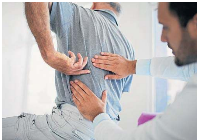
Należy włączyć fizjoterapeutów do długoterminowej opieki zdrowotnej oraz rozwijać usługi w domu pacjenta

Już od narodzin dzieci mogą korzystać ze wsparcia fizjoterapeutów, którzy pomagają prawidłowo rozwijać postawę i ruch.