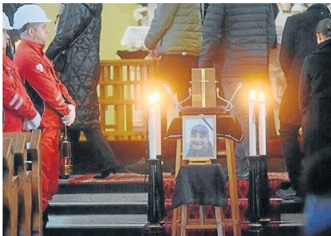
Nabożeństwo żałobne odbyło się w Kościele Ewangelicko-Augsburskim w Drogomyślu

Zabytkowy kościół w Drogomyślu wypełniony był po brzegi.