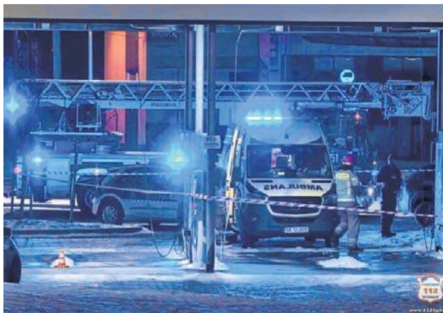
Z nieustalonych na ten moment przyczyn mężczyzna wpadł do kanału technicznego na terenie myjni

Po kilkugodzinnej, intensywnej walce o jego życie mężczyzna zmarł.